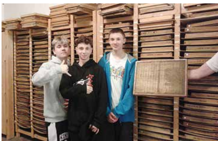
Osmáci našli v papírnách i matrici se znakem Čeladné