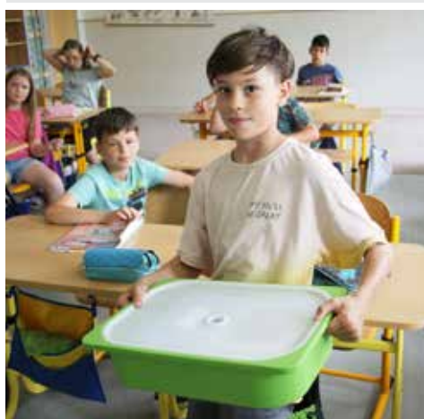
V tomhle boxu se vám nic nepomačká