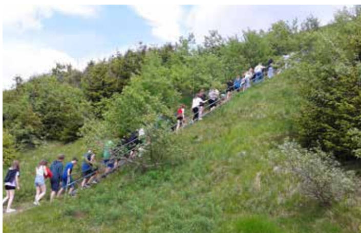
Vzhůru k horní nádrži Dlouhých strání