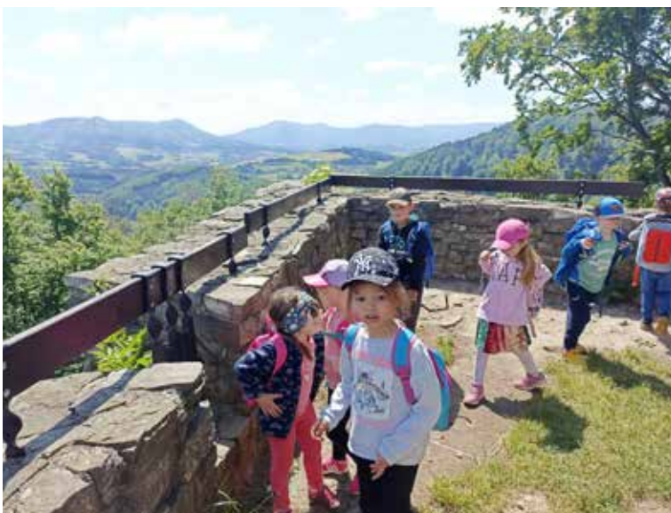
Počasí nám umožnilo výhledy do dalekého okolí