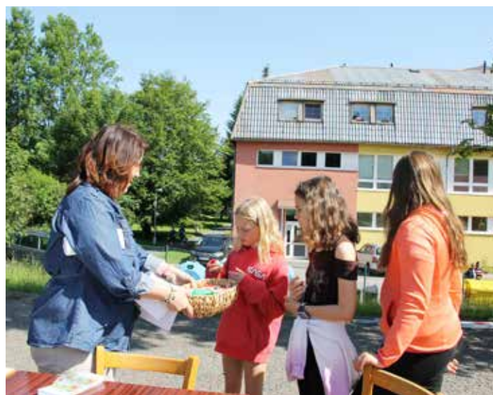
Odměna pro všechny, kteří se prošli po čeladenském chodníčku