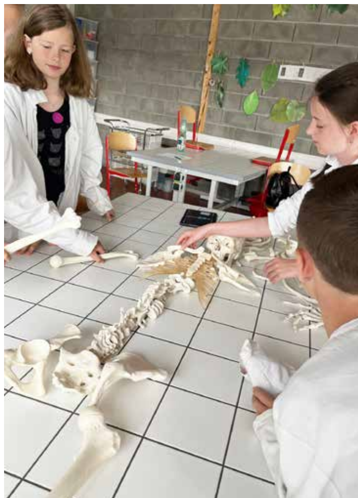
Složili jsme lidskou kostru!