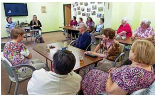
Právě probíhá informativní beseda

Červnové klubové akce proběhly dle plánu, krom níže uvedených programů probíhaly další pravidelné akce v klubovně, tzn. zdravotní cvičení obou skupin a úterní karetní posezení. Jen kroužek angličtiny se nedobrovolně odmlčel již před prázdninami. Ještě nás po uzávěrce čeká nenáročná vycházka s cílem v restauraci U Pařezu.