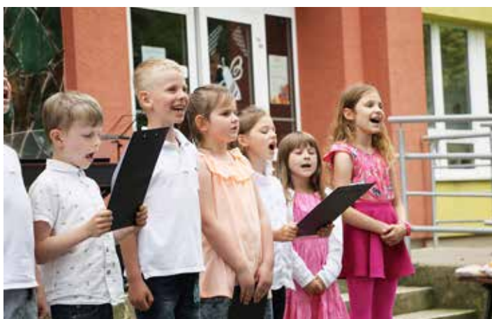
Prvňáčci s chutí a radostí zazpívali oblíbenou píseň o Večerníčkově