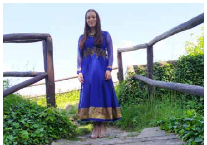
To je ona, opravdová královna Grafie