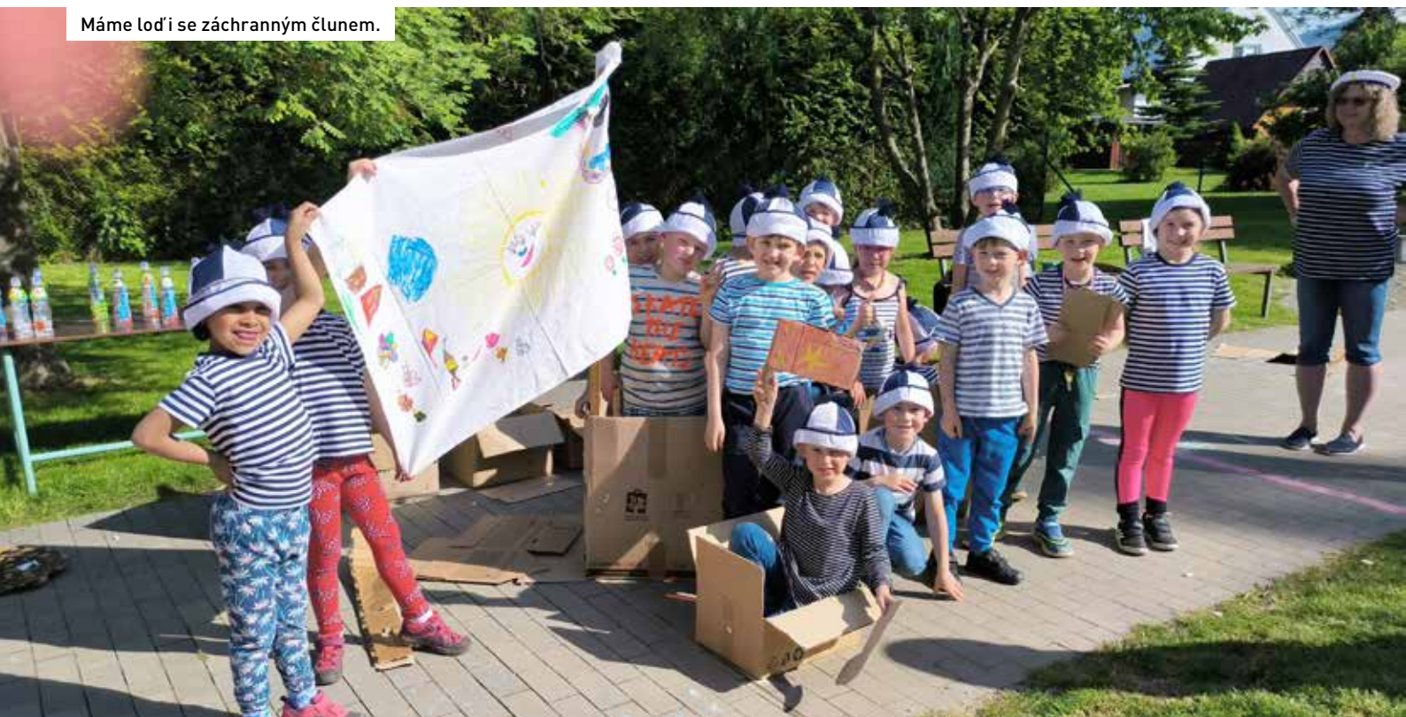
Máme loď i se záchranným člunem.