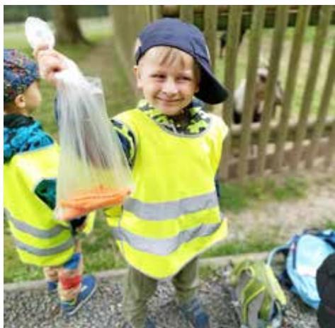
Taky Tobík má spoustu krmení pro kozičky