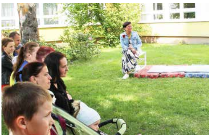
Program se líbil paní ředitelce i divákům