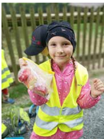
Julinka a dobrůtky pro kozičky