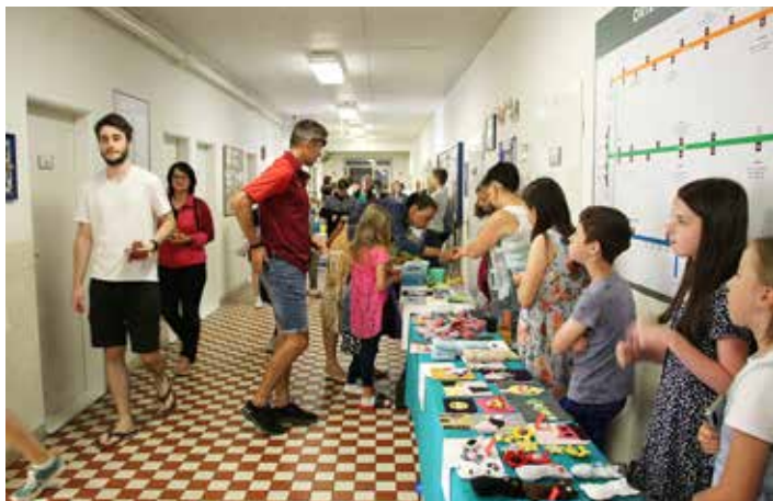
Chodba v přízemí se zaplnila prodejními stánky a bylo z čeho vybírat