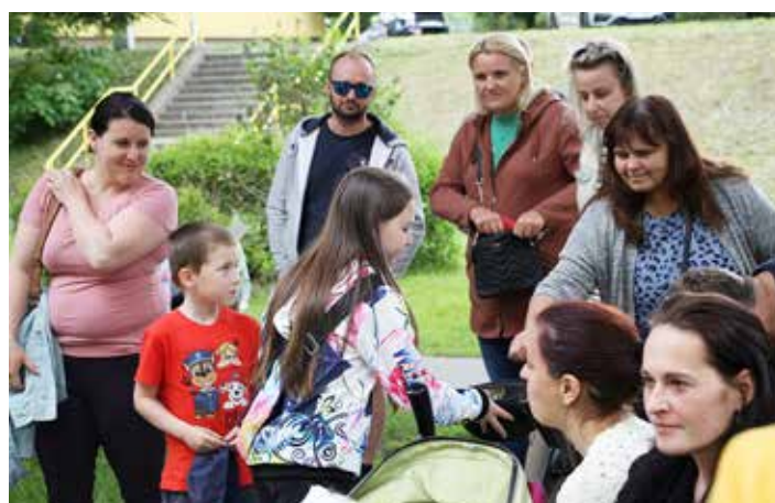
Vybírání do klobouku po každém vystoupení aneb zasloužená odměna