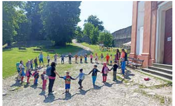
Plníme poslední úkol královny Grafie