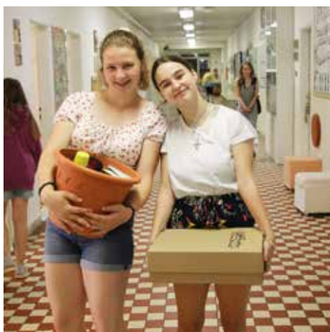
Bez aktovek to bylo hned veselější