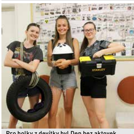
Pro holky z devítky byl Den bez aktovek výzvou, které nemohly odolat