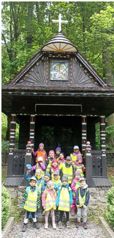
Vyrážíme od Cyrilky hledat poklad