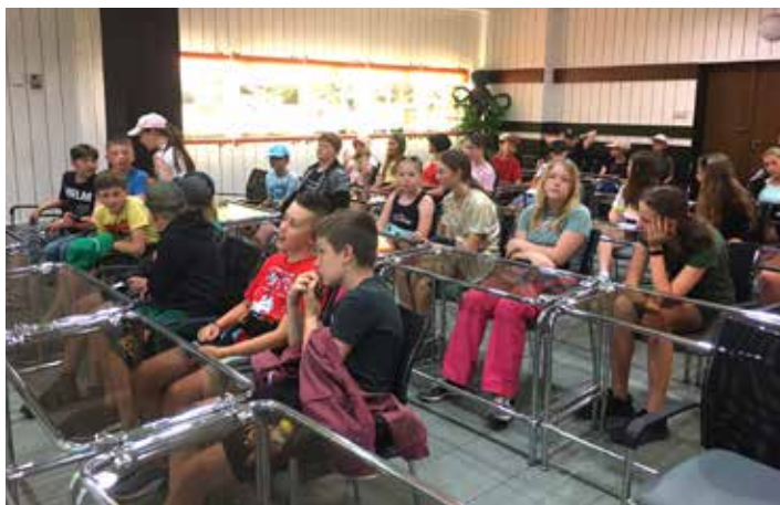
V informačním centru Dlouhých strání nám promítli dva filmy