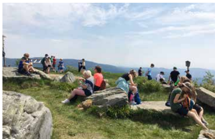
Svačinka u horní nádrže ve výšce 1353 metrů nad mořem