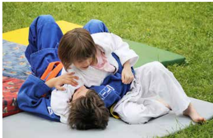
Ukázka juda diváky hodně zaujala