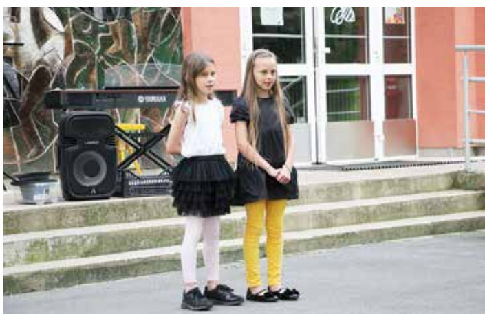
O červeném šátečku zpívala děvčata z třetí třídy