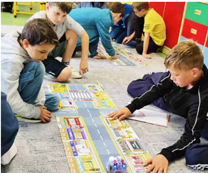
Rovně? Doleva? Doprava? Kam pošleme včelku dále?