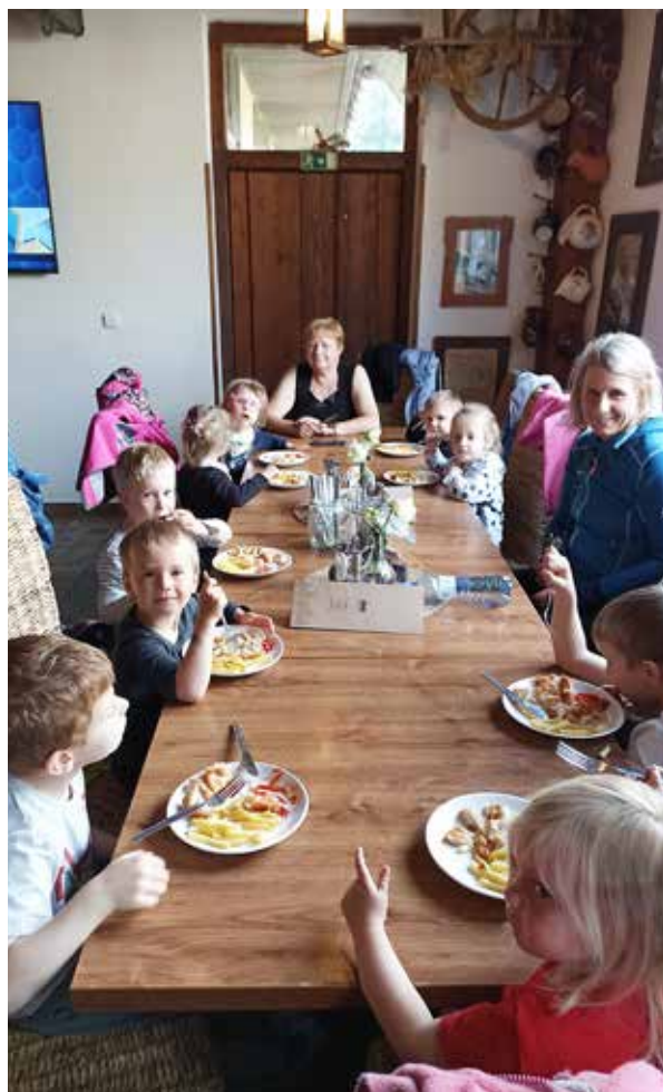
Takhle se dětem z Květinčky baští v Dukle