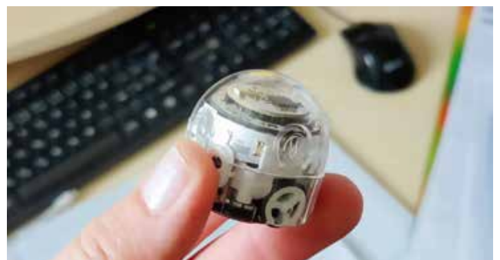
Mrňousek mezi roboty, Ozobot EVO