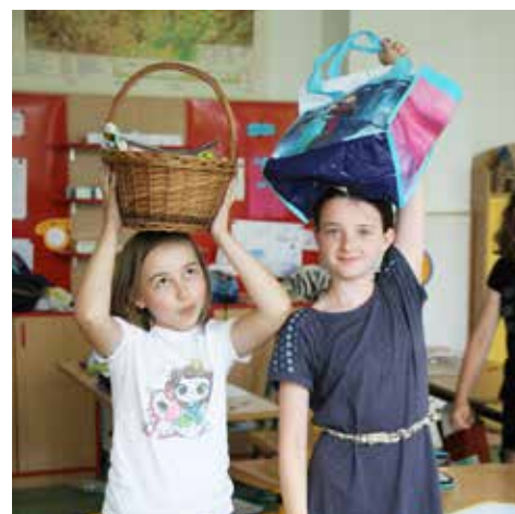
Bez aktovek ve čtverce