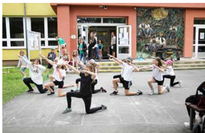
Kumštřplac na chvíli zaplnily holky z TK Antonio