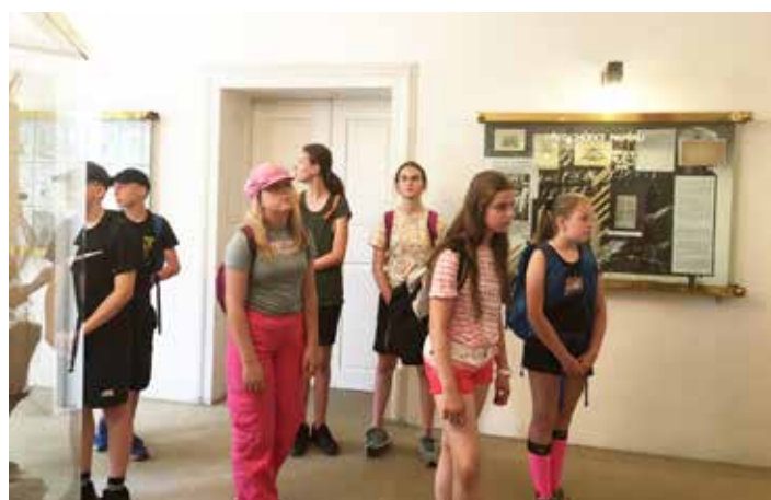
Prohlídka papírny některé nudila, jiné naopak zaujala