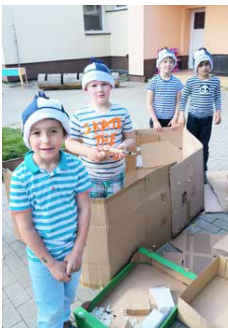
Kluci, stavitelé loďe