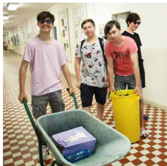
Seďmáci nezklamali a den bez aktovek pojali velmi kreativně