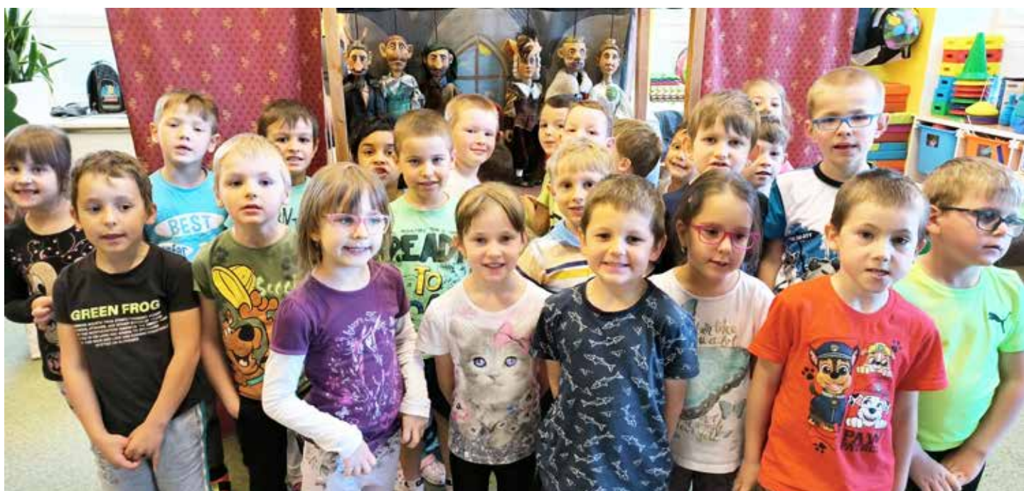
Žabičky s dřevěnými herci