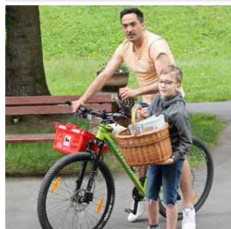
Ještě že máme tak obětavé rodiče