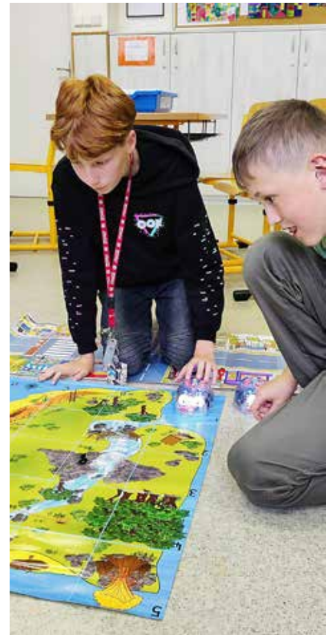
BeeBot a jeho cestování po mapě