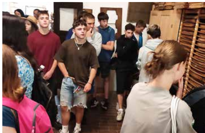
Prohlídka výroby ručního papíru ve Velkých Losinách