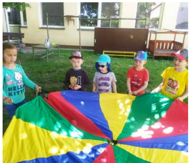
Zahřívání dinosauřího vejce, aby se vylíhlo