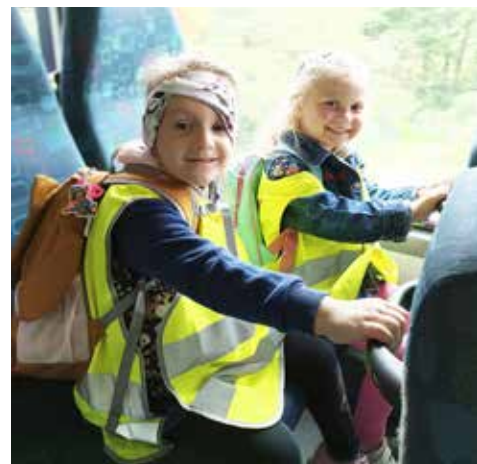
Timinka a Terezka: v autobusu je to nejlepší