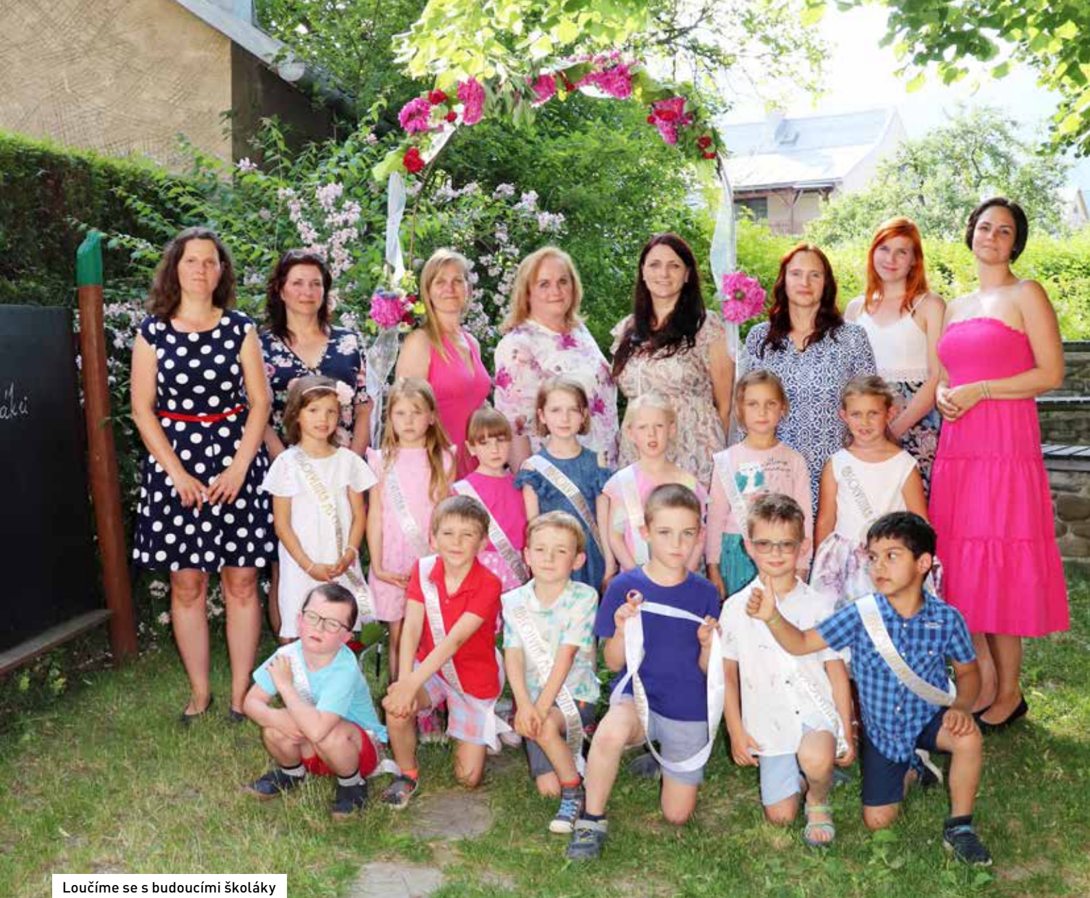
Loučíme se s budoucími školáky