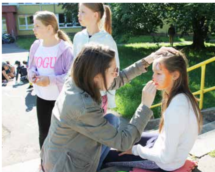
Děti si užily i malování na obličeje, změnily se rázem ve zvířátka

Pro kluky, děvčata i jejich vychovatele jsme připravili pestrý program, který zahrnoval šipkovanou s plněním úkolů, kreslení na chodník, kvíz, sportovní aktivity i malování na obličeje. Téměř padesát dětí se aktivně zapojilo do připravených disciplín, počasí nám přálo, prostě den jako korálek.