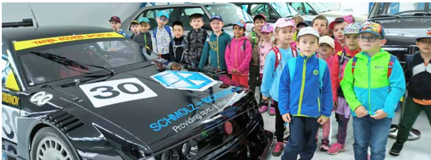
Žabičky a závodní Tatra