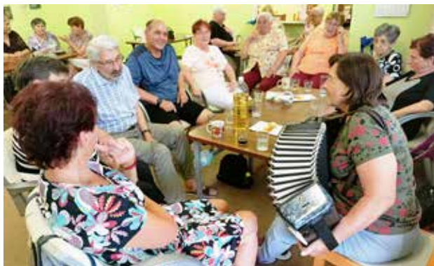
Vaječina pozřena, v akci harmonika