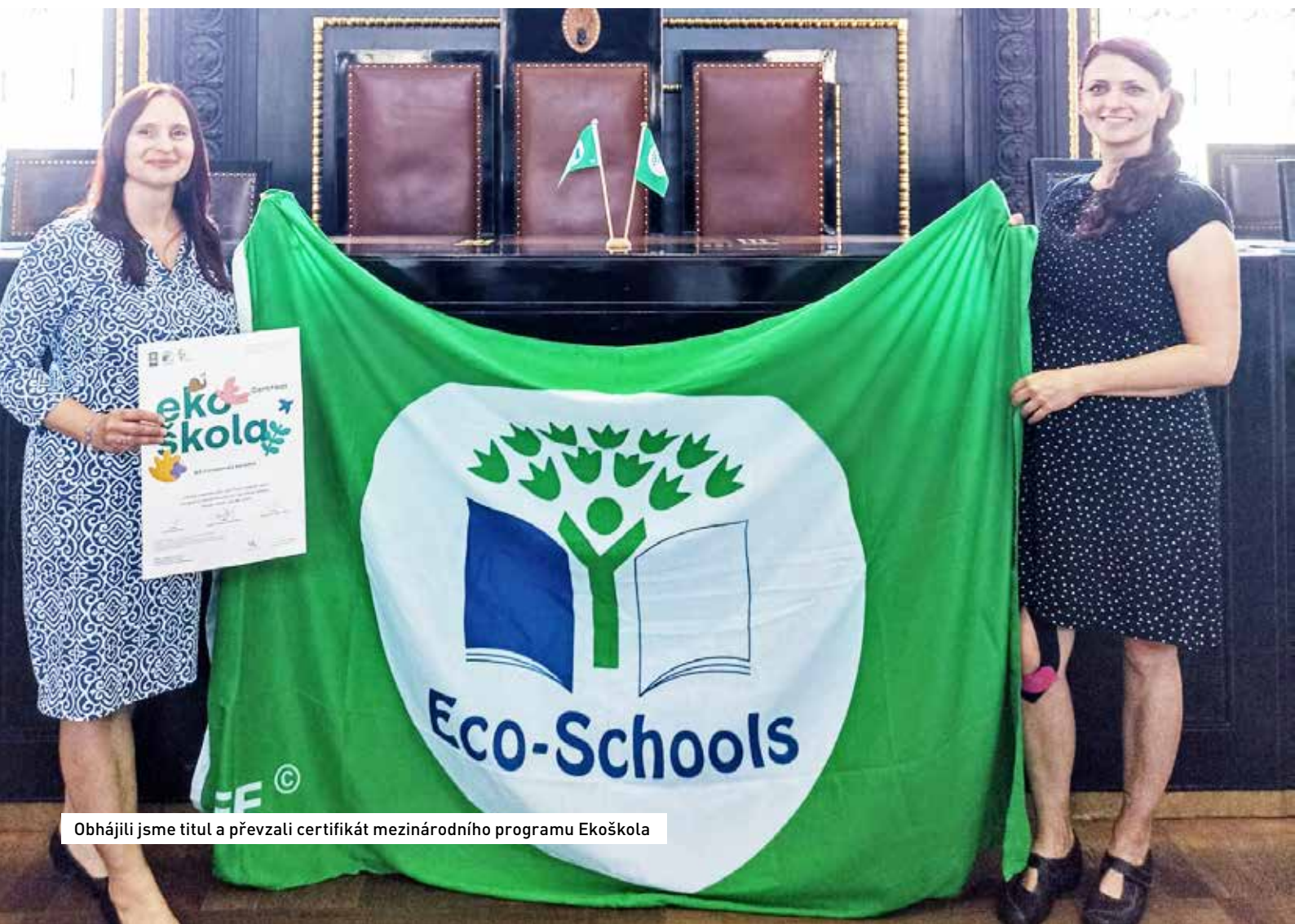
Obhájili jsme titul a převzali certifikát mezinárodního programu Ekoškola