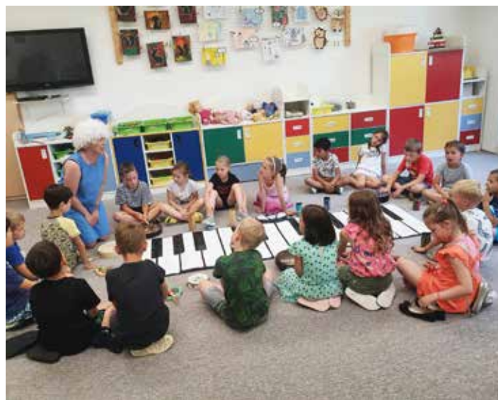
Odpoledne s Mozartem ve školní družině