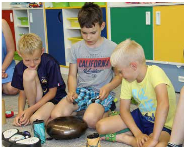
Mozart dokázal pobavit i naše fotbalisty