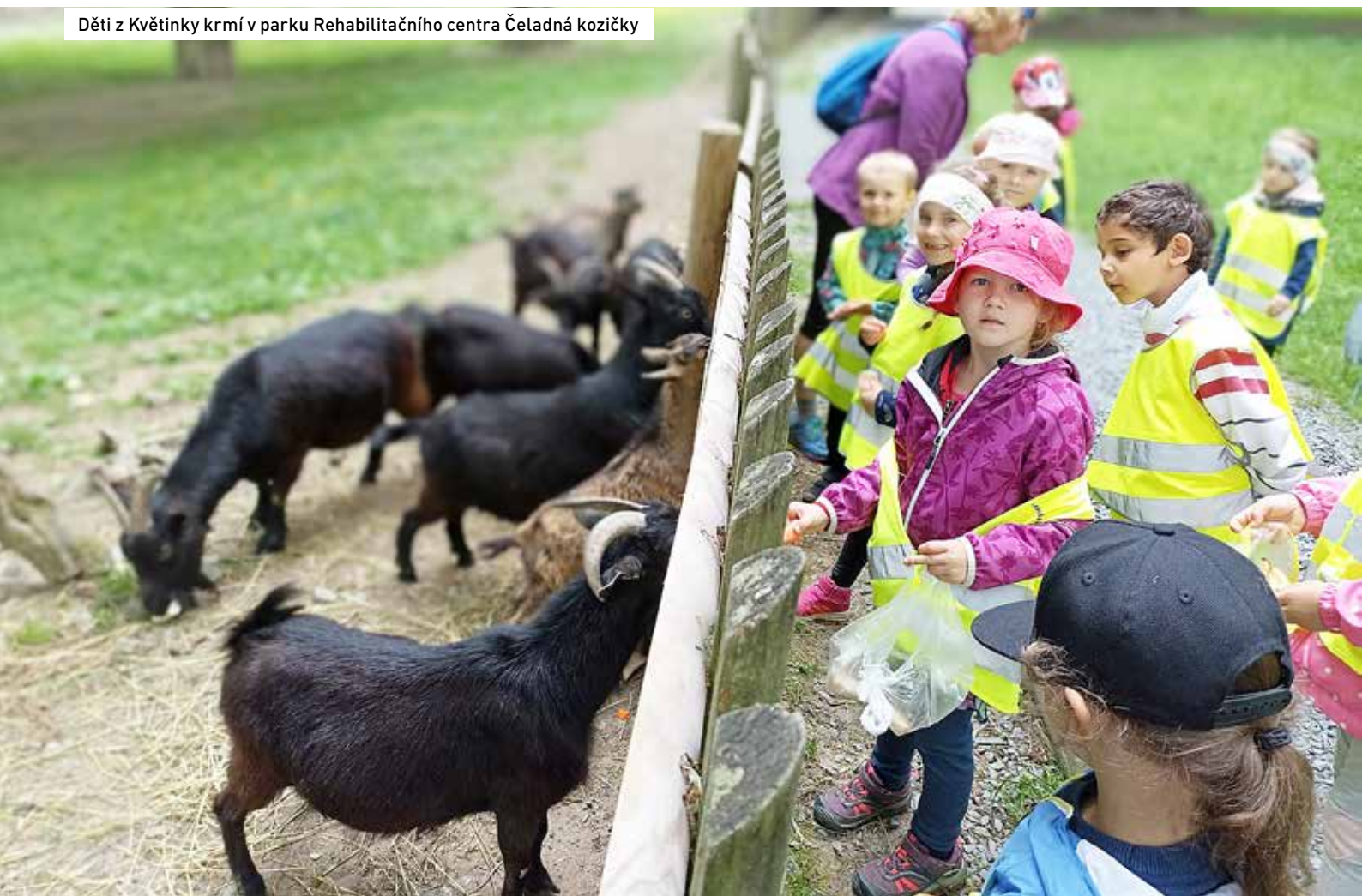
Děti z Květinky krmí v parku Rehabilitačního centra Čeladná kozičky