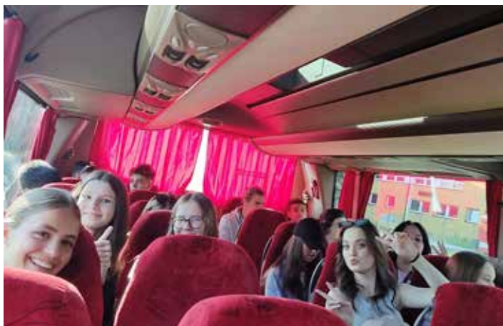
Cesta autobusem byla dlouhá, ale užili jsme si ji