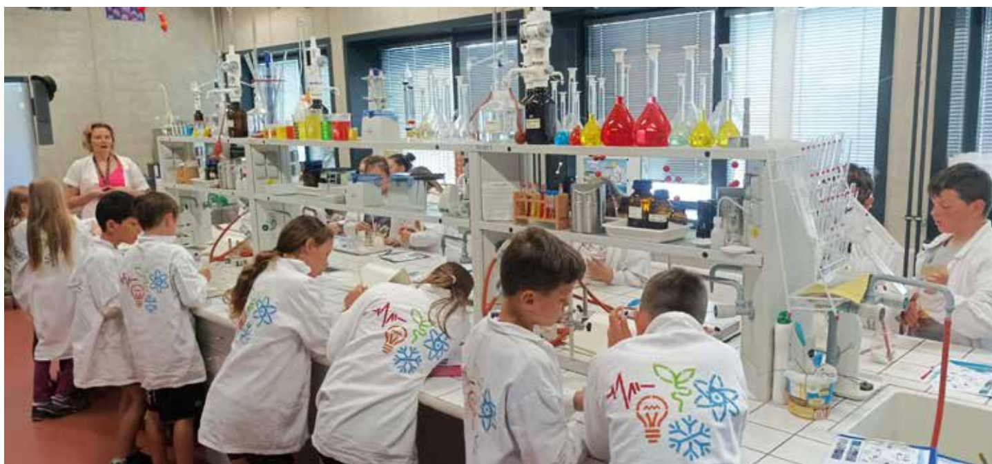
Ve Světě techniky mají báječnou učebnu chemie