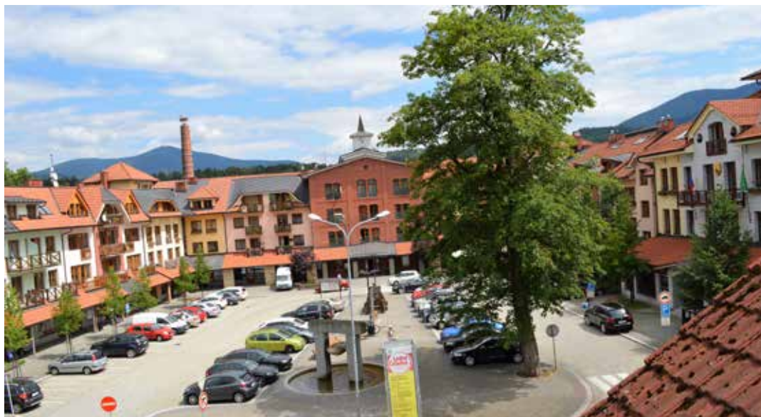
Podpořit úsilí obce byl měl každý, kdo nechce, aby se Čeladná stala rájem developerů