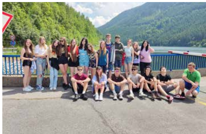
Devětáci na hrázi dolní nádrže elektrárny