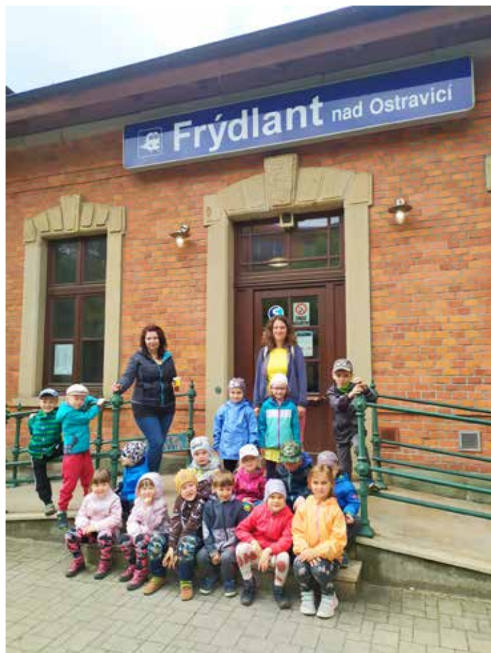
Nádraží ve Frýdlantu nad Ostravicí jsme si prohlédli důkladně