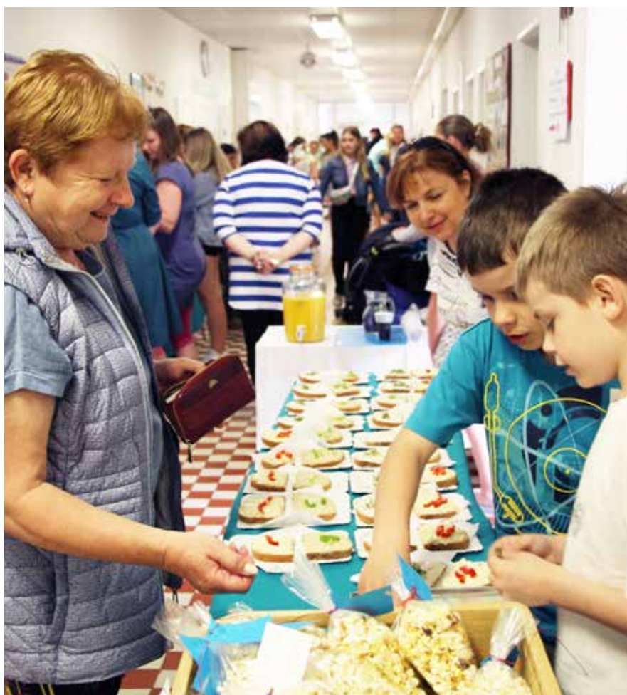
Finanční gramotnost v praxi aneb jak prodávali druháci