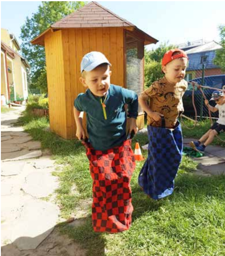
Dinosauři opatrně skáčou mezi tekoucí sopečnou lávou