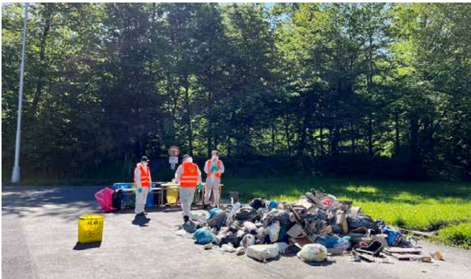
Analýza odpadu z obce probíhala na parkovišti za sportovní halou

JRK Česká republika s.r.o. www.meneodpadu.cz