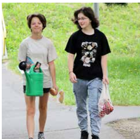
Ano, i takhle se dá přinést učení do školy