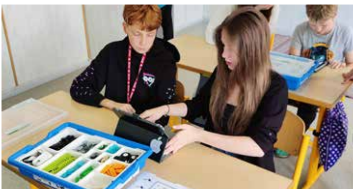
Umět sestavit funkční větráček z Lega se může v letním parnu hodit