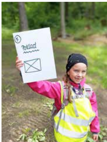
Thea: Hurá, našli jsme poklad!