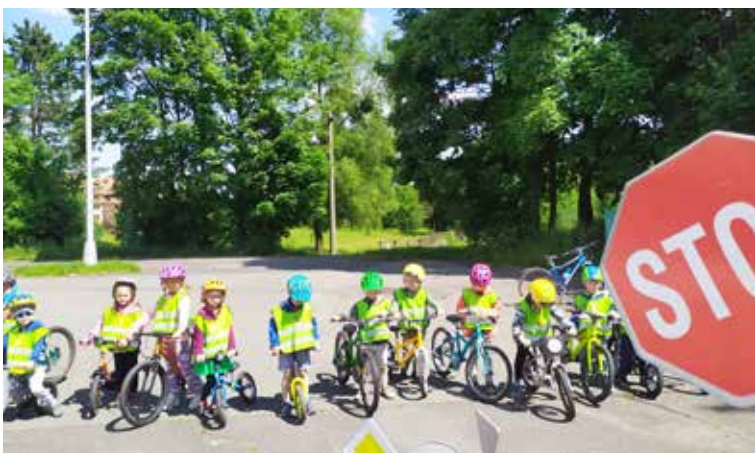
Děti se seznamovaly s dopravními značkami a řešily různé situace