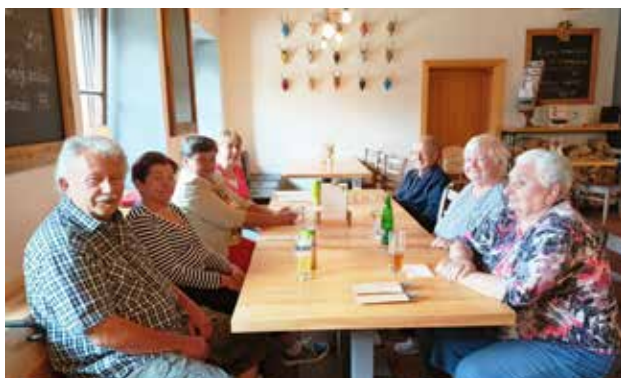
A zase v hospodě, tentokrát Na Rozcestí