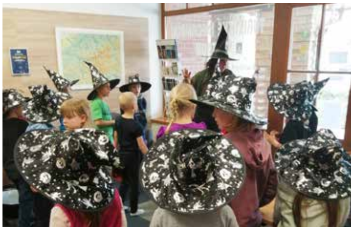
K povedeným akcím patřila návštěva čarodějnic