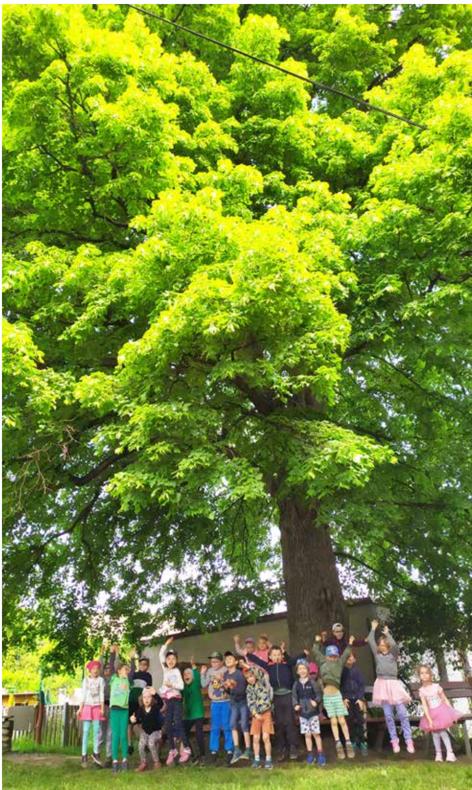
Lípa starší než kostel