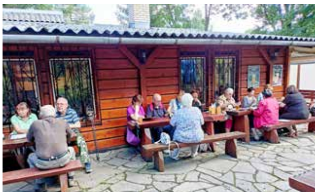
Seniorská invaze U Pařezu

Vše o našem klubu od jeho vzniku v r. 2010 najdete na www.senioriceladna.cz .