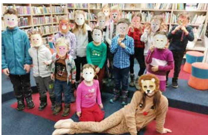
Společné čtení: lev v knihovně