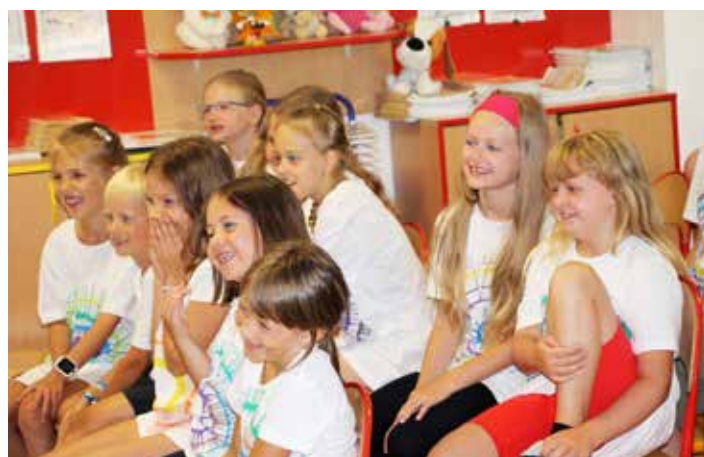
U vystoupení kouzelníka se děti výborně bavily