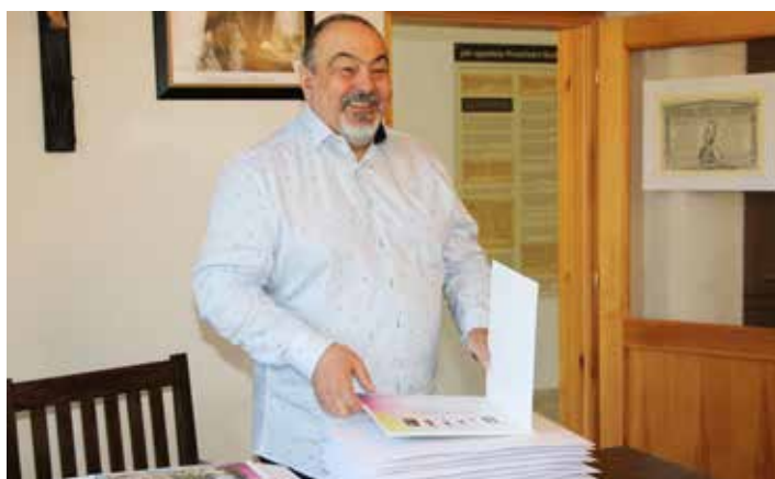
Almanach, krásnou knihu plnou vzpomínek na léta strávená na základní škole...