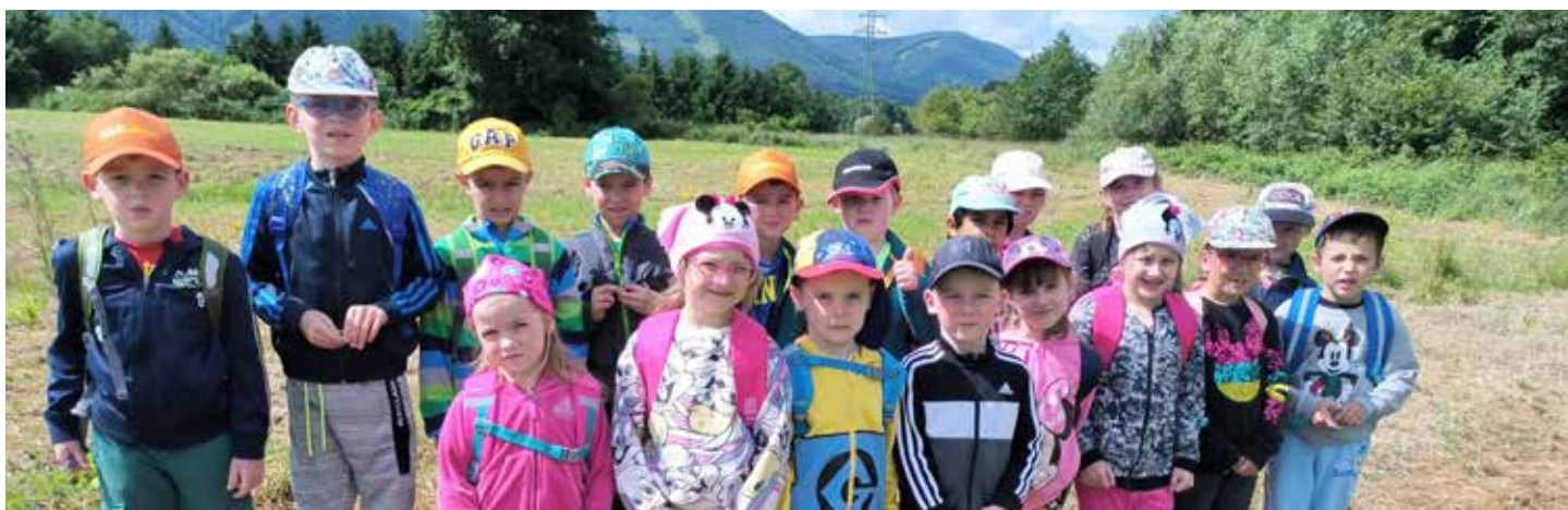
Výlet do přírody se nám vydařil