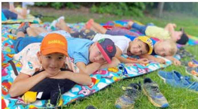
A takhle v létě odpočíváme...