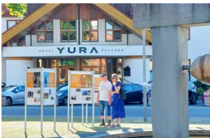
V dalších dnech se u panelů zastavovali místní i přespolní...