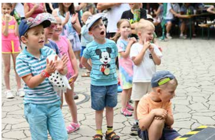
kluci civěli jak puci...