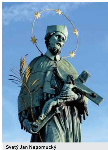
Svatý Jan Nepomucký

Jan byl blahořečen roku 1721 a brzy na to, roku 1729, také kanonizován. Stal se pak jedním z nejuctívanějších českých svatých a jeho kult se brzy rozšířil v celé střední Evropě. Sochu svatého Jana Nepomuckého potkáváme často poblíž mostů nebo na jejich zábradlí jako patrona a ochránce těchto staveb. (Jedna ze soch svatého Jana Nepomuckého je dokonce pod vodou – a to