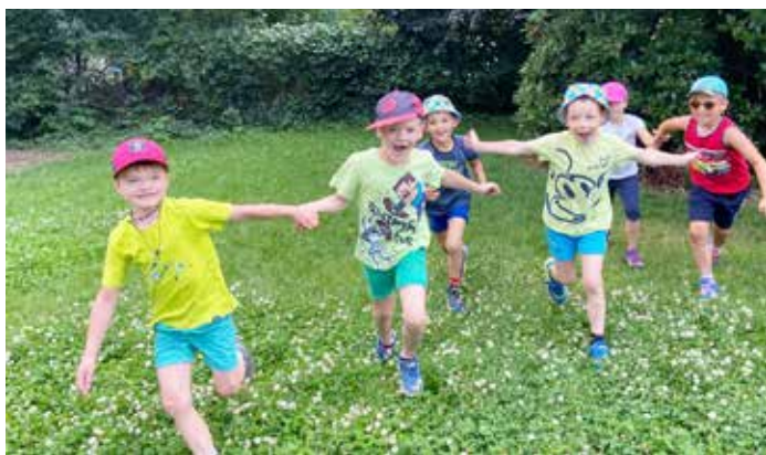
...dovádíme na zahradě...