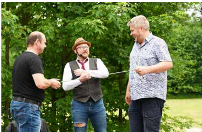
Na to, co předváděl kouzelník s dětmi i jejich rodiči...