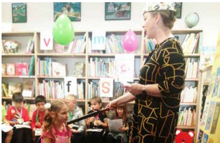
Pasování prvňáčků na čtenáře