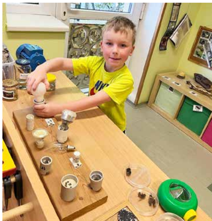
Matyášek v centru pokusy a objevy