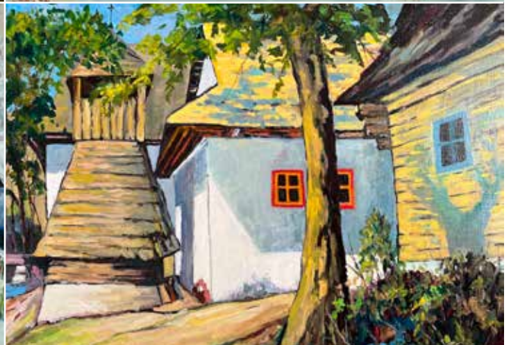
Obrazy čeladenského rodáka Zdeňka Kurečky inspirované Beskydami