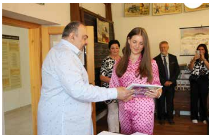
...obdržel z rukou starosty obce každý žáky deváté třídy...