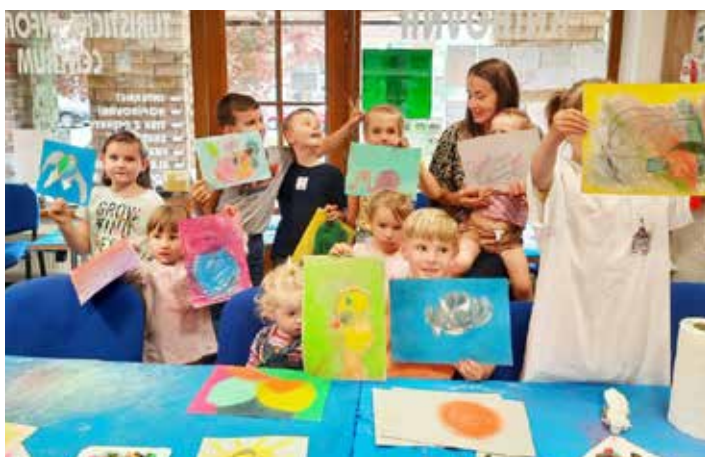
Malování v knihovně