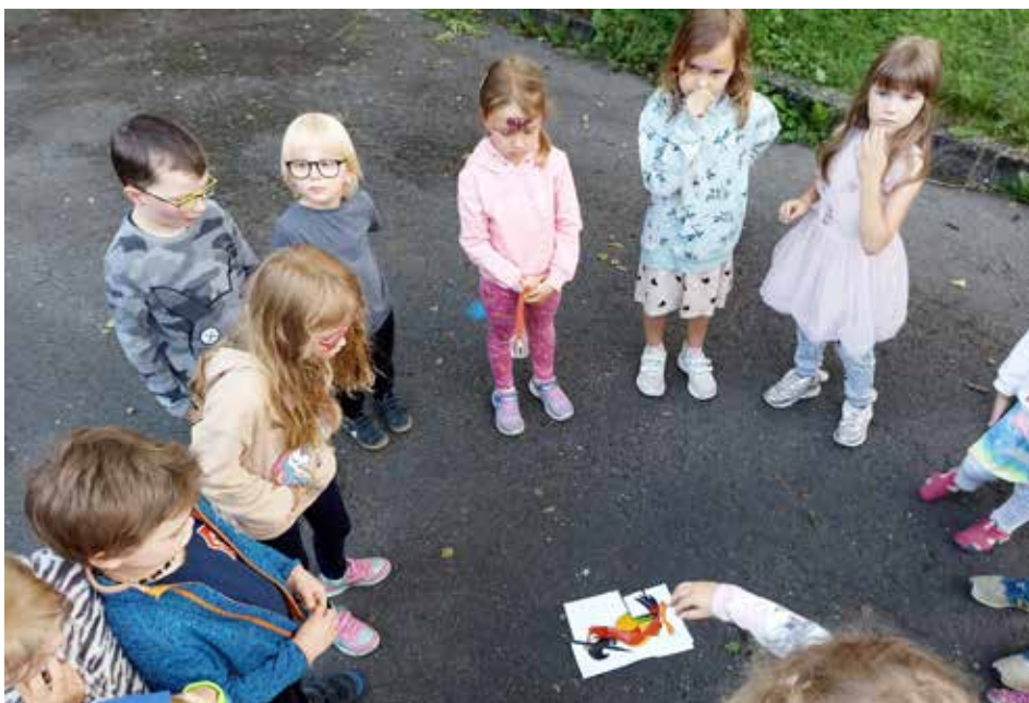
To bude asi obrázek papouška piráta Robertse