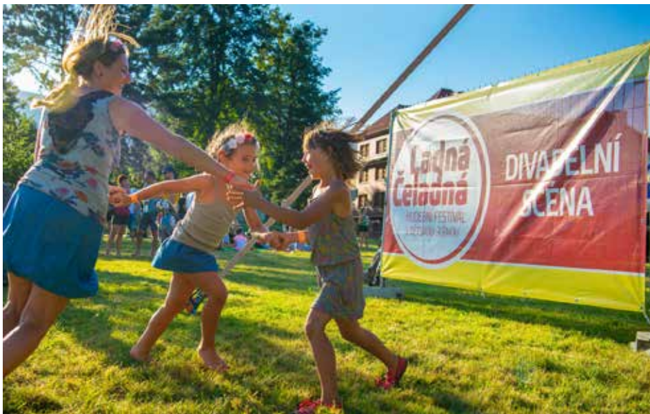
Ladná nabízí nejen dětský program, ale i dětské (případně rodinné) zvládnuté vstupné

Z Čeladné jezdí autobusy od 20:30 do 0:30 co hodinu. V opačném směru spoje jezdí co hodinu od 21:00 do 23:00. Autobusy poznáte podle festivalové cedulky Ladná Čeladná.