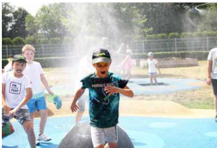
V parném dnu je třeba se ochladit