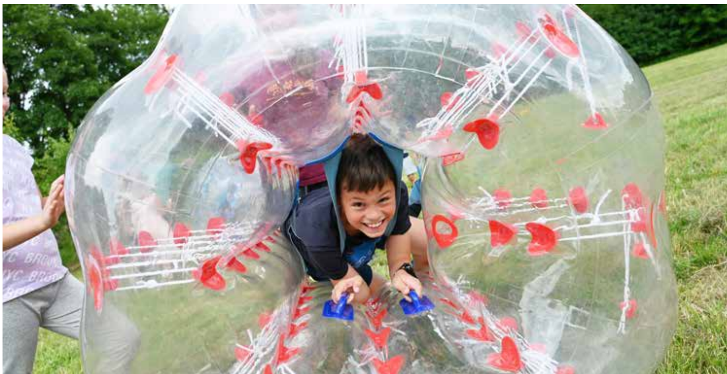
Vítání prázdnin mělo tři hity: kouzelníka, hasiče a „bumperbaly“

Poslední školní den se nesl ve znamení zábavy, kterou pro děti připravila kulturní komise ve spolupráci s obcí a hlavně za vydatné podpory hasičů. Ti připravili nejen spoustu soutěží, ale i ukázkou své techniky a parádní požární útok v podání svého dětského družstva.