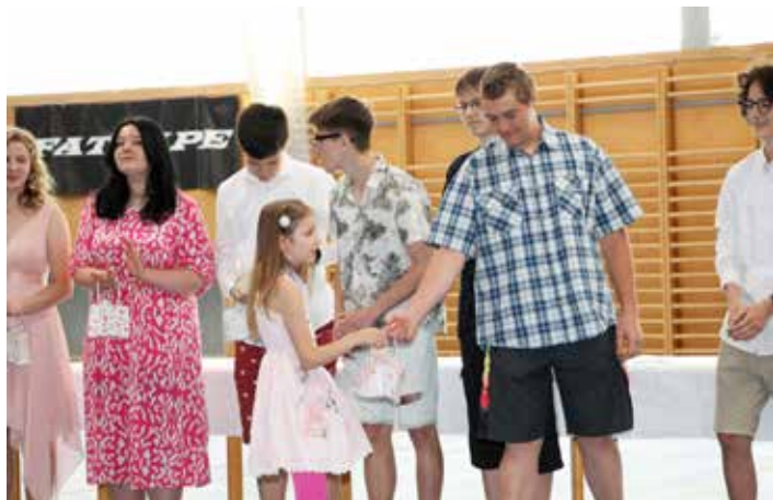
S devětáčky se za celou školu rozloučili ti nejmenší, prvňáčci