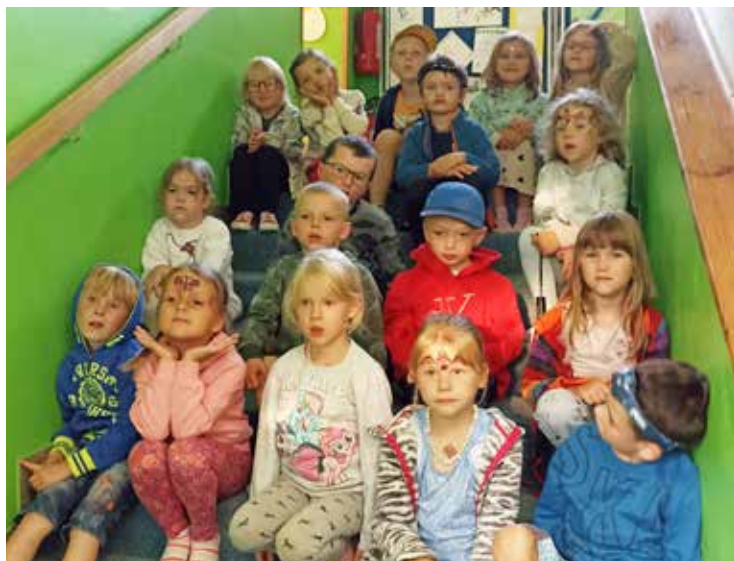
Parta z noční školky