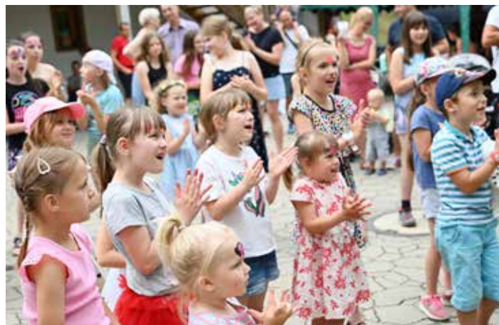
...holky koukaly s otevřenou pusou...