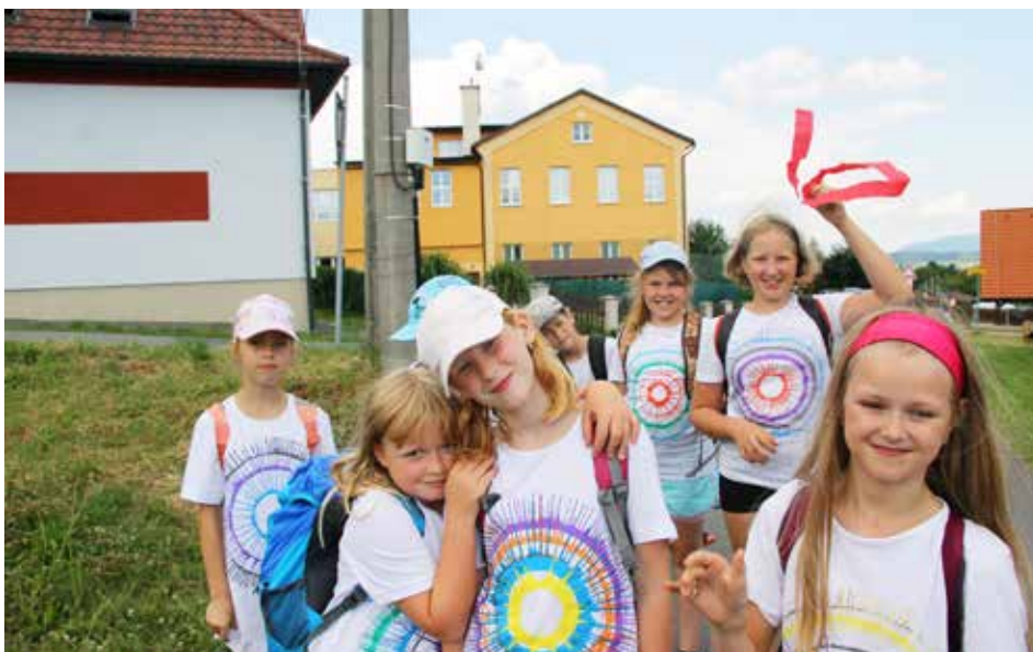
Poznáte, kde jsme?

Hurá za poznáním. Je těžké najít něco, kde by děti ještě nebyly nebo to co by ještě neznaly. A nám se to podařilo. V hasičském autobusu, který bezpečně šoféroval pan Čajánek, jsme vyrazili do Valašského Meziříčí. Zde se nachází interaktivní herna Vrtule, kde se pod jednou střešou propojuje svět hraní, učení se i kreativity. Tři patra plné těch nejzotodivnějších her, hlavolamů, bludišť, optických klamů a mnoho dalšího. Tohle je opravdu parádní místo na trávení volného času a pokud můžete, tak si Vrtuli nenechte ujít. Doporučuj všichni z Prázdninové družiny! A pak hurá, hned vedle řeky tu mají