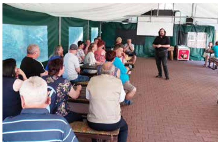
který přítomné zaujal přednáškou o počátcích křesťanství