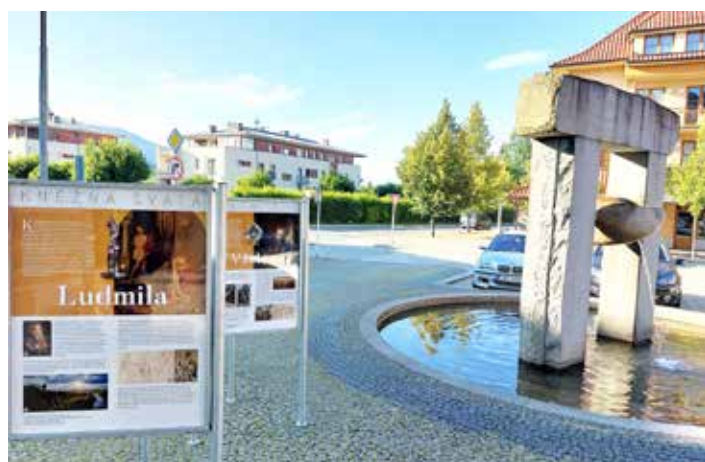
...a shodli se, že výstava krásně dokreslila letní atmosféru obce