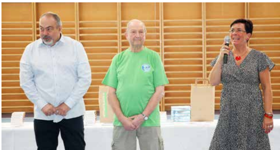
Ocenění za svou práci obdrželi nejen žáci...

Nejstarší žáky ještě čekalo vedení obce v Památníku Josefa Kaluse, kde každý deváťák dostal z rukou starosty obce almanach s fotografiemi ze školních let. Tak milí deváťáci, přejeme vám všem „šťastnou cestu“.