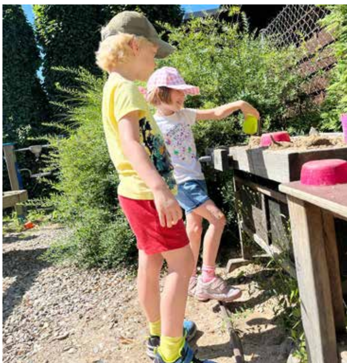
Blátivá kuchyně je jedno z nejoblíbenějších míst pro prázdninové hry