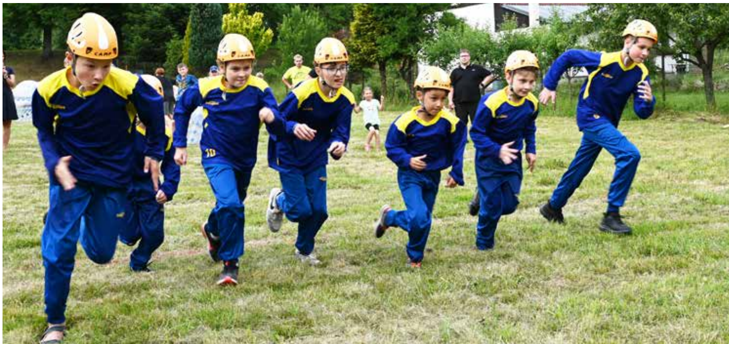
Celá akce byla v režii hasičů, kteří zajistili zábavu, soutěže a předvedli pravý hasičský útok. Podařil se jim skvěle od startu...