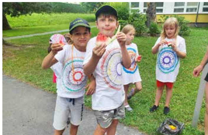
Melounové hodiny k prázdninám patří