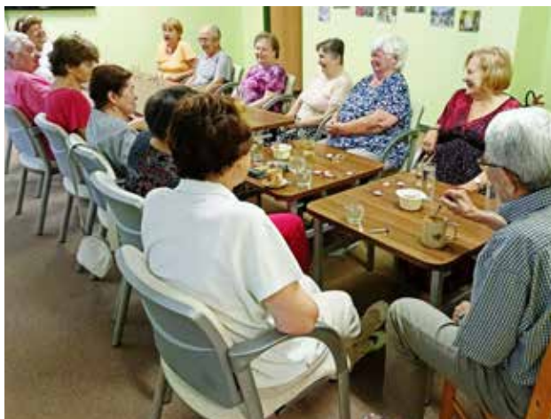
V dobrém rozmaru při Posezení jen tak