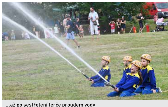
...až po sestřelení terče proudem vody