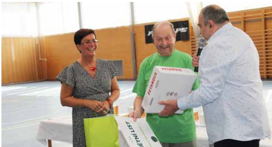
Ředitelka školy děkovala za vedení rybářského kroužku, starosta za obec