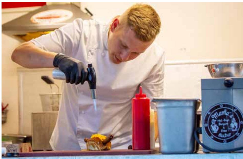
Svačinu si neberte, ve festivalových stáncích vás čeká spousta lahůdek

Klienti ČPZP mohou na místě zakoupit vstupenky s 20% slevou.