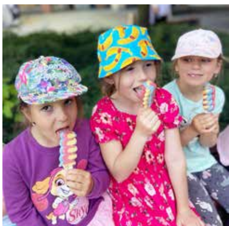
Emičce, Terezce a Josefínce nanuk chutná