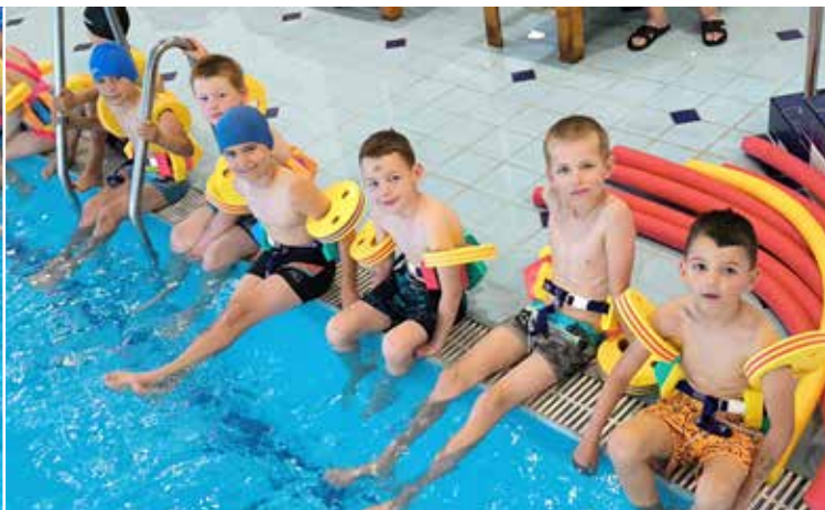
Poslední plavání jsme si parádně užili