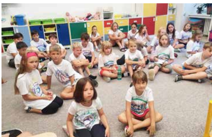
Tohle je parta dětí, která s námi prožila Prázdniny z klobouku