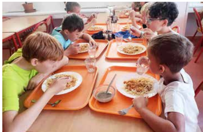
Mňam, pořádně se nablábnout a už frčíme na další hru