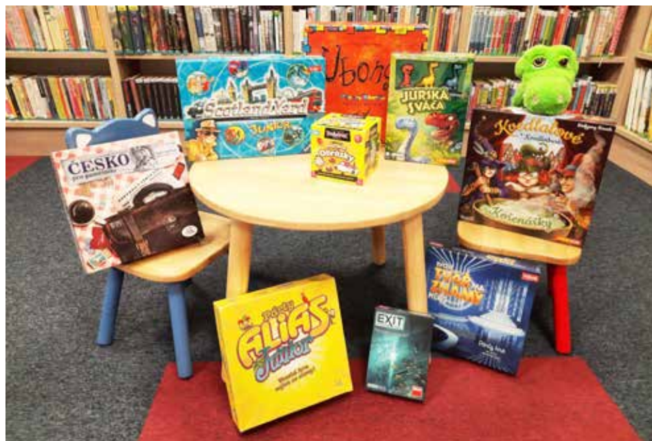
VÝBĚR JE VELKÝ / Jen v prvním pololetí knihovna nakoupila 200 novinek, k zapůjčení jsou i populární deskové hry

Nová hra na letošní turistickou sezonu. Zapojit se mohou i děti z Čeladné.