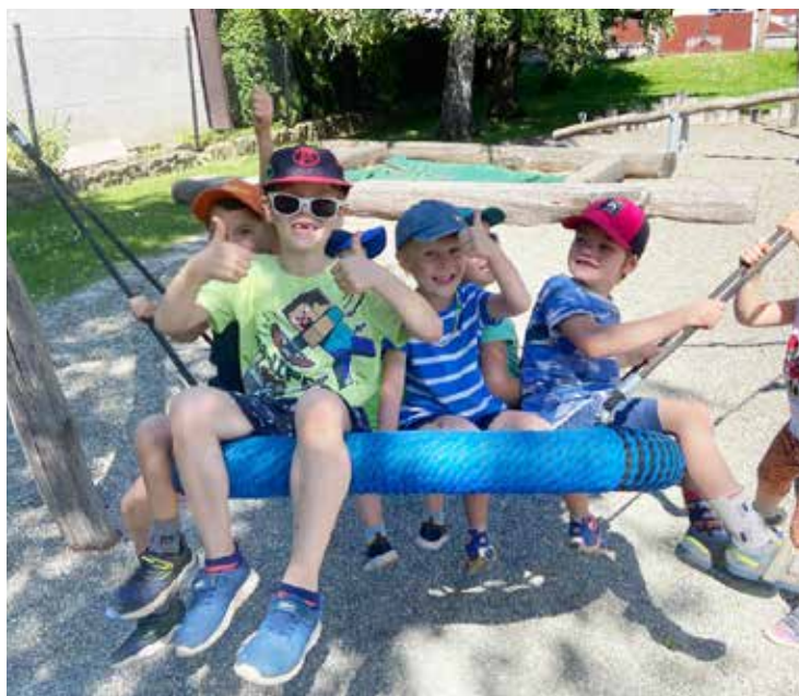
Na houpačce je to super!