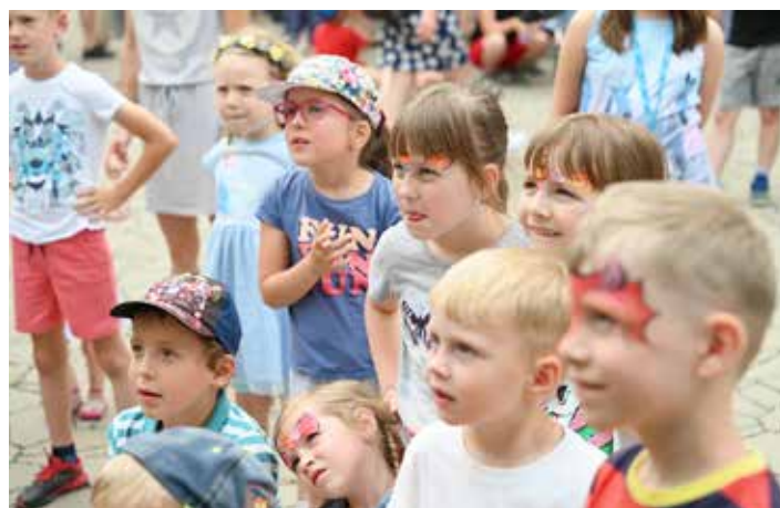
a všichni dohromady si akčního kouzelníka moc užívali