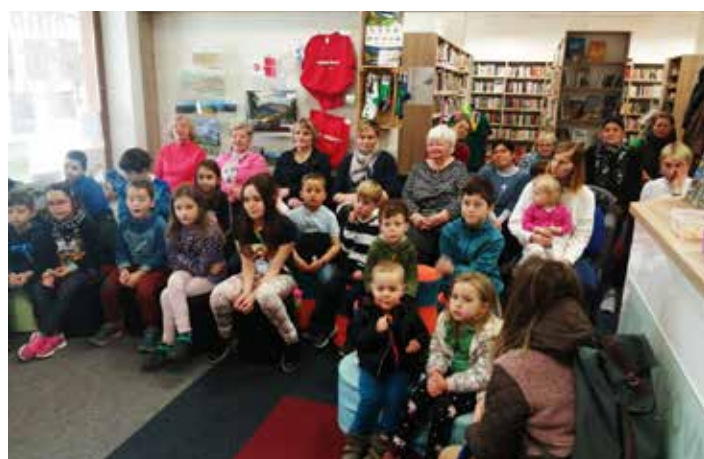
Společné čtení: Za šípkovým keřem