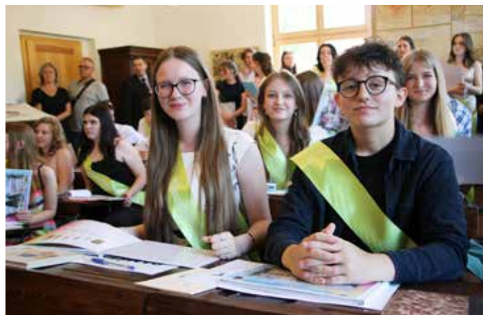
Nechyběla ani šerpa pro absolventy ZŠ Čeladná