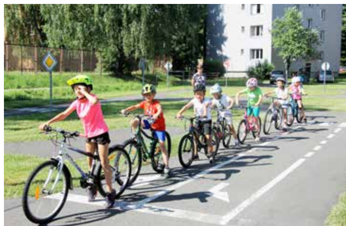
Jízda na kole podle značek a semaforů nebyla vůbec snadná a přesto ji všichni zvládli