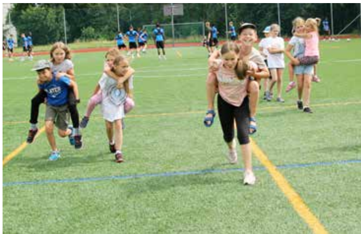
Společně to zvládneme, jsme přece jeden tým