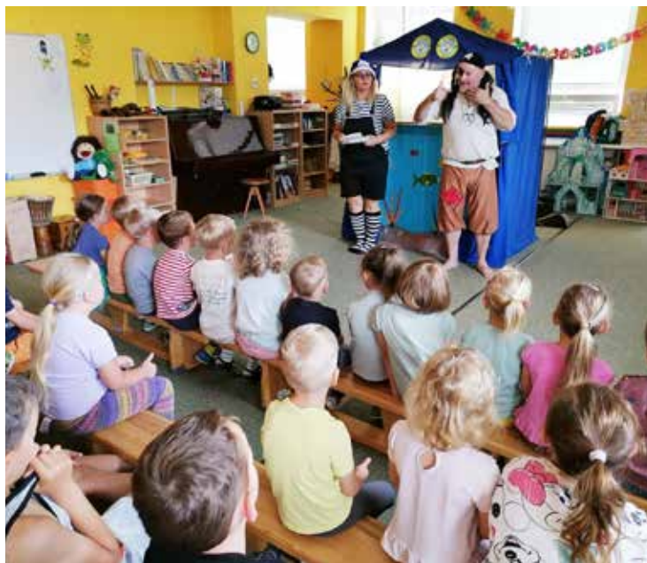
Divadlo Smíšek za námi přijelo i o prázdninách