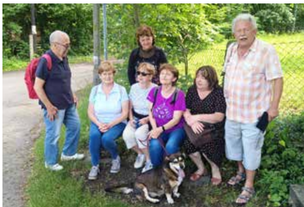
Zastavení na okruhu Anny Trefilové oklikovou cestou do Pařezu