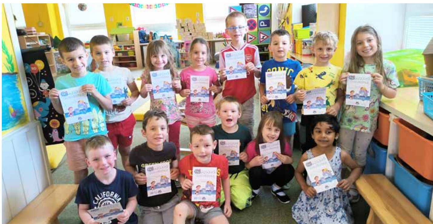
Malí plavci a jejich mokrá vysvědčení