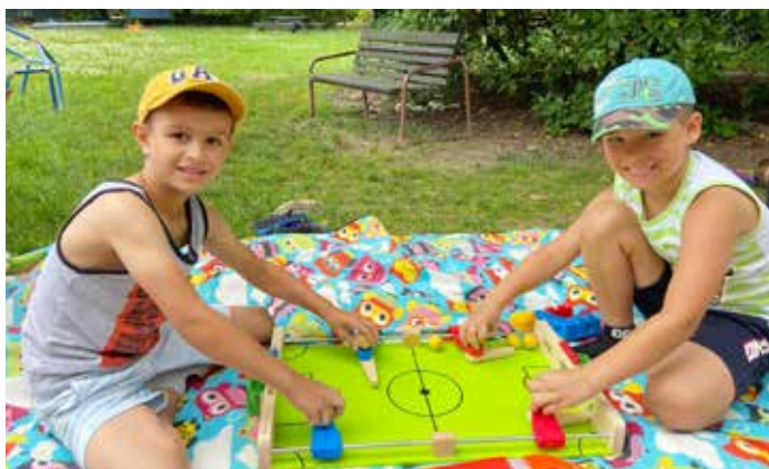
...a hrajeme fotbalík, jako třeba Viktorěk a Sebík