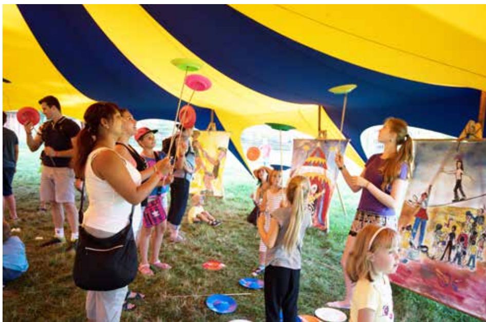
Na festival přijede i populární Cirkus trochu jinak se svým šapitó

V tělocvičně také proběhne slosování o ceny, do něhož se mohou zapojit děti, které na soutěžních stanovištích splní úkoly a nasbírají razítka.