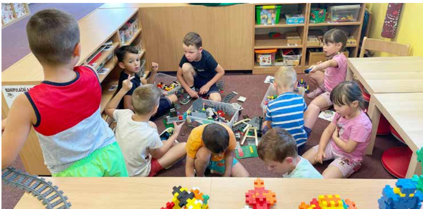
Když vás chytne legománie