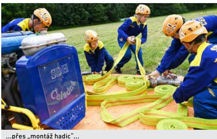
...přes „montáž hadic“...