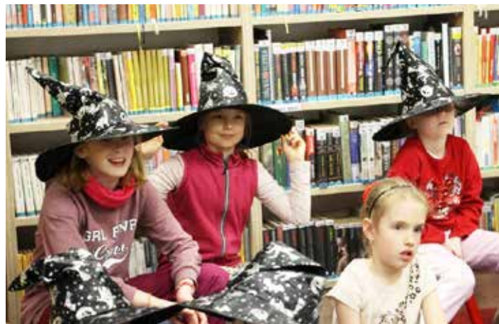
Děti se pobavily a poučily, jako ostatně v knihovně vždy