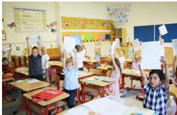
Prvňáčci se mohli pochlubit svým vysvědčením