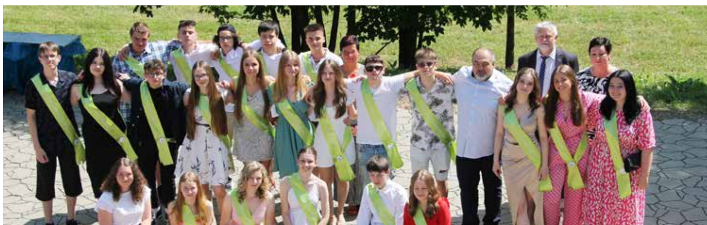
To jsou oni, dojatí devětáčky s třídním učitelem, ředitelkou a zástupci vedení obce Čeladná