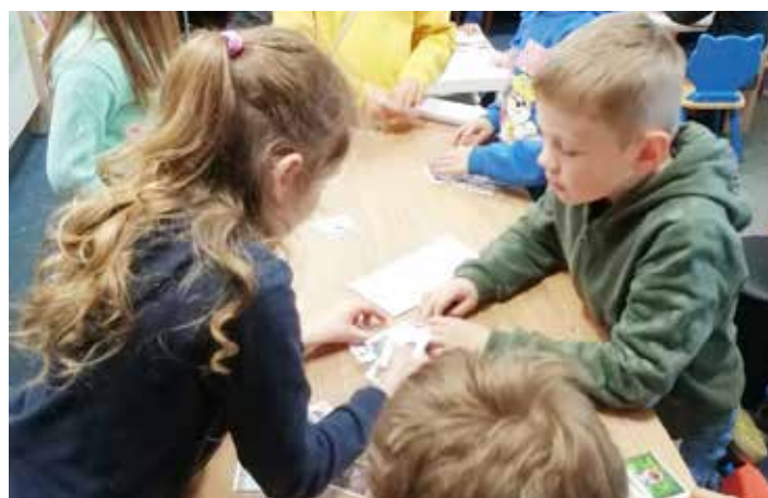
Děti jsou vždy moc šikovné, ať už přijdou s učitelkami nebo rodiči