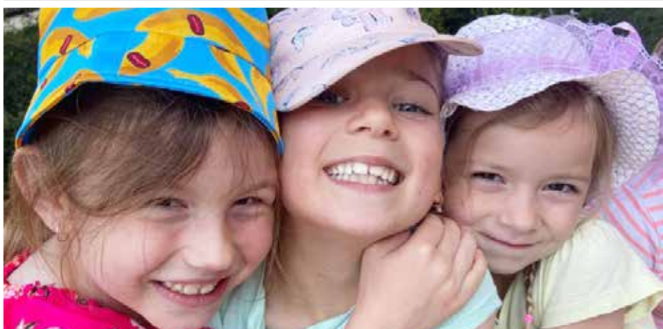
Jsme fakt kamarádky!