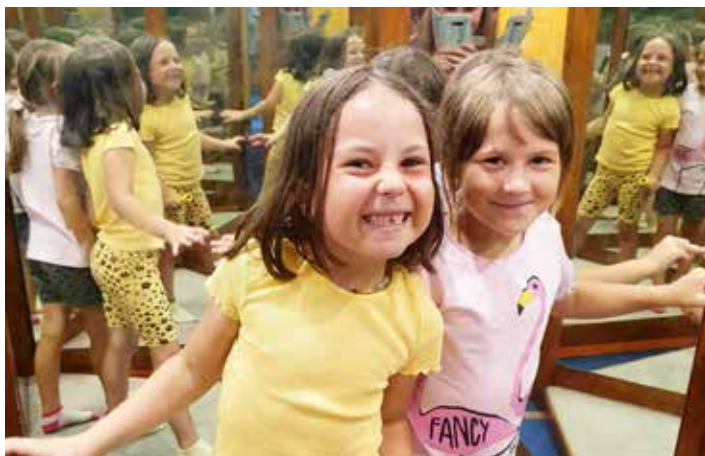
Výlety s družinou, to nás prostě baví