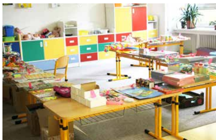
Závěrečný obchůdek plný odměn pro kluky a holky