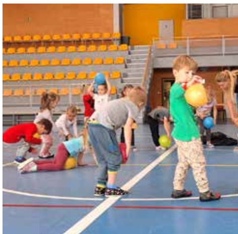
Květinka cvičí v tělocvičně