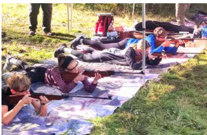
...lépe nám šla střelba ze vzduchovky