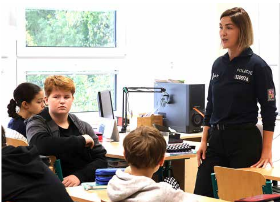
V sedmé třídě se probírala kyberkriminalita