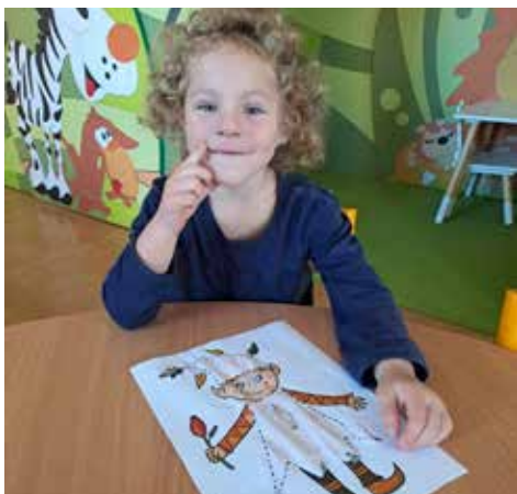
Sofínka tvoří podzimníčka