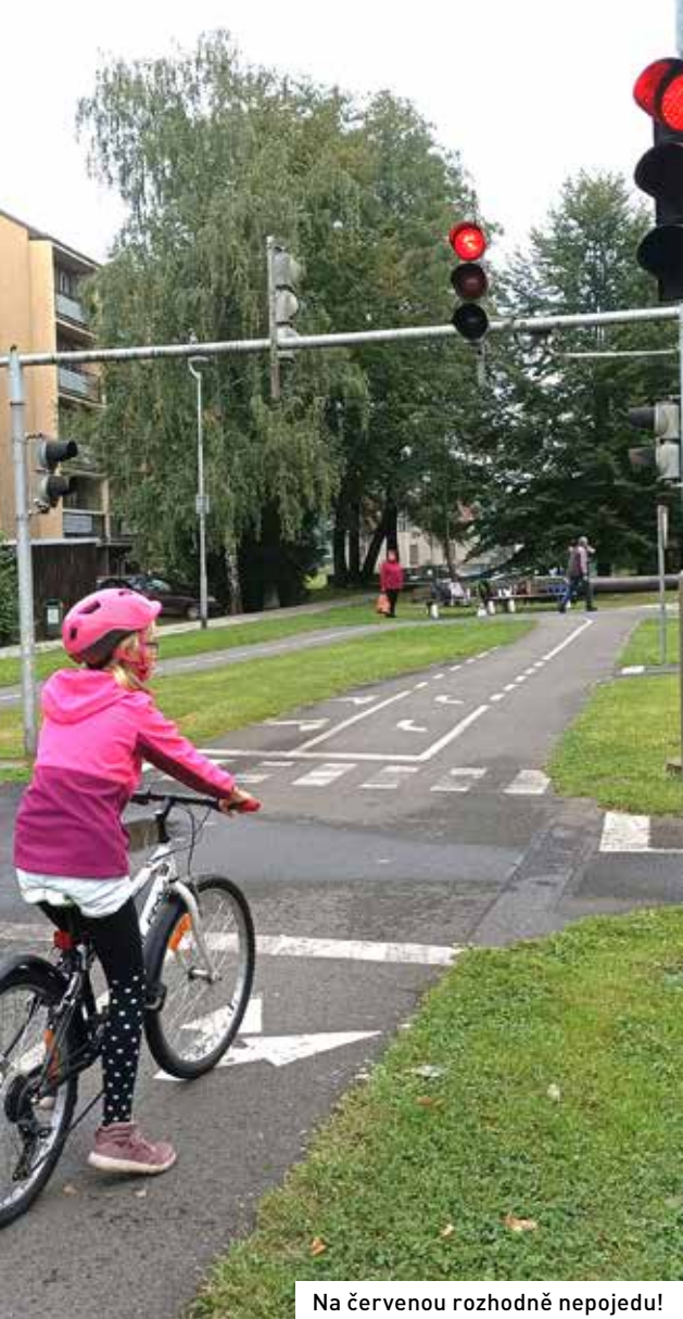
Na červenou rozhodně nepojedu!