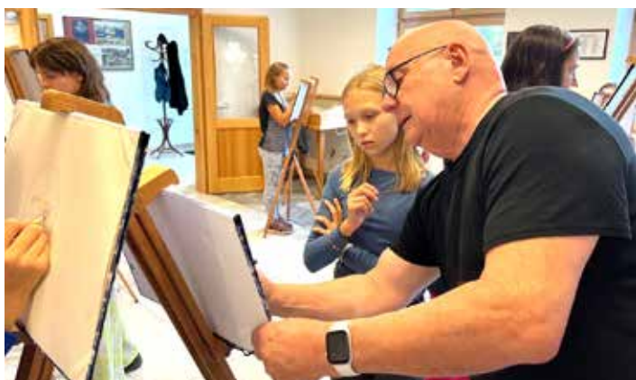
...a nejlepší bylo, když nám radil přímo při tvorbě