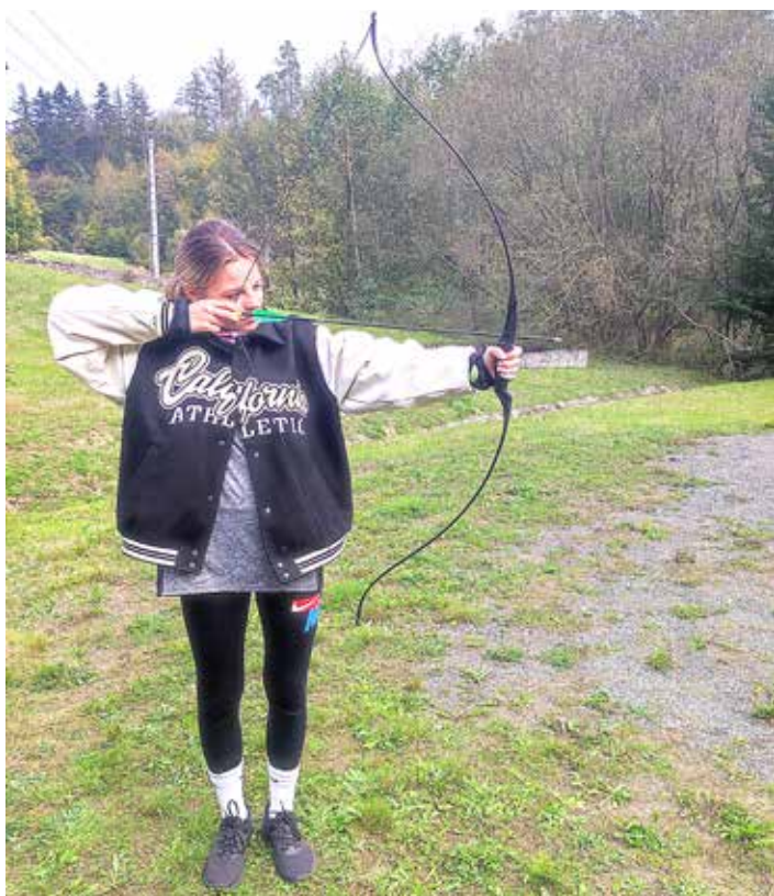
Z luku stříleli indiáni...