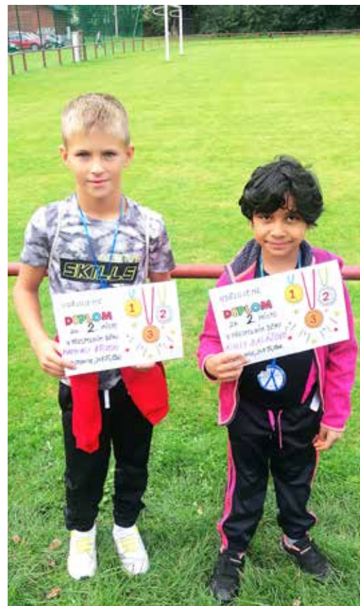
Medailistům z přespolního běhu gratulujeme