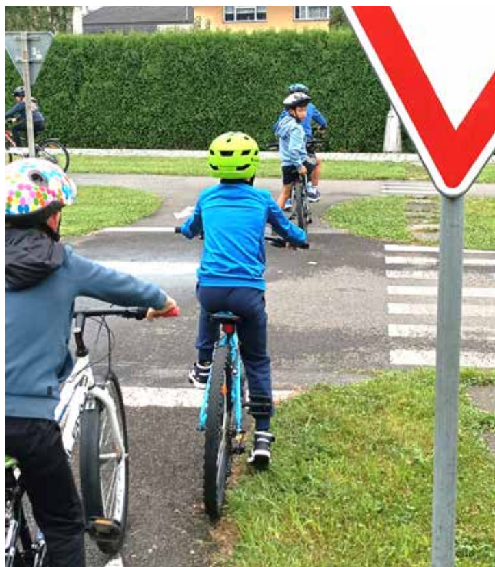
Dám přednost a můžu jet