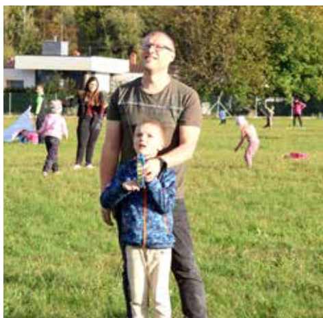
...když jste na to dva, tak to jde lépe...