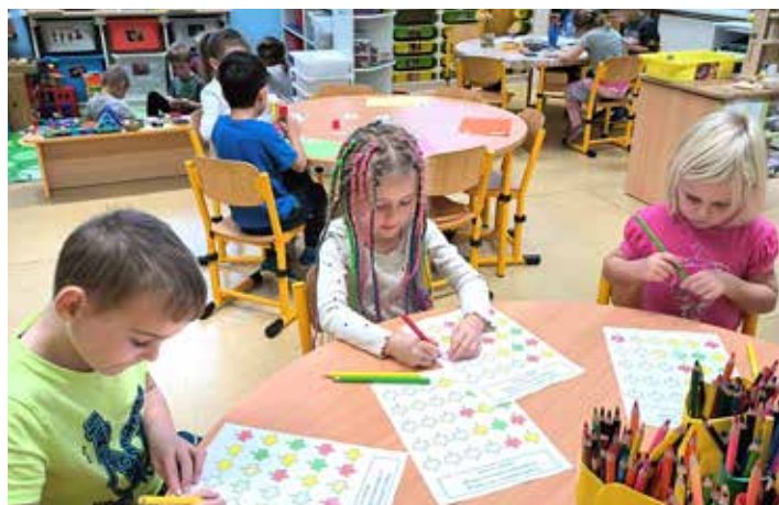
Vybarvíme to správně