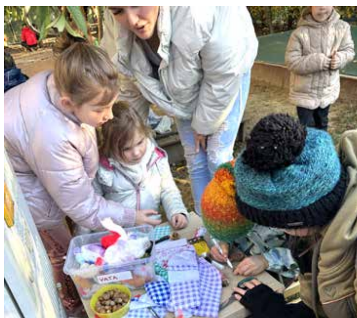
Výroba miminek ze žaludů