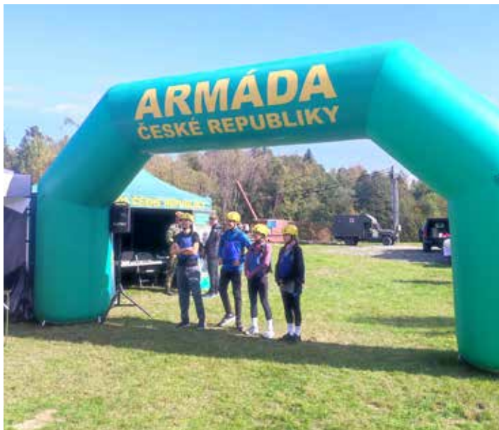
Na startu už jsme tušili, co nás čeká