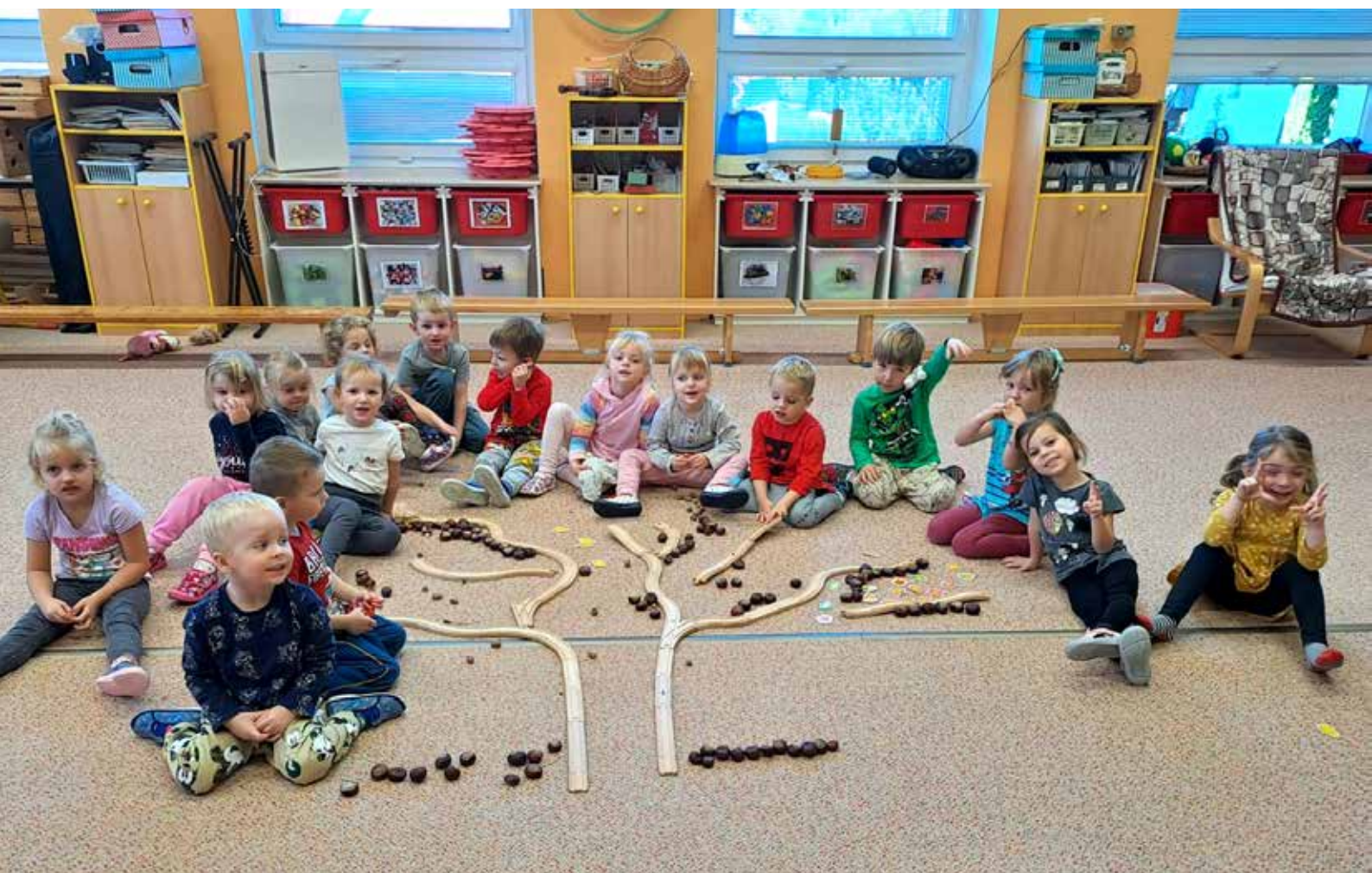
Děti z Květinky si vytvořily krásný strom z přírodnin