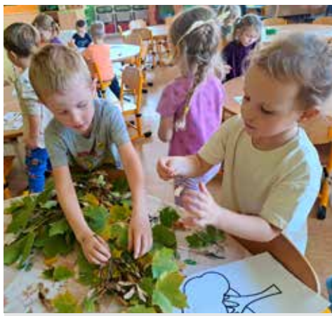
Josefínka a Maty tvoří z podzimních přírodních materiálů