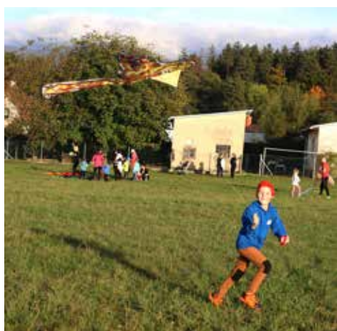
Slunečné odpoledne si děti užily...