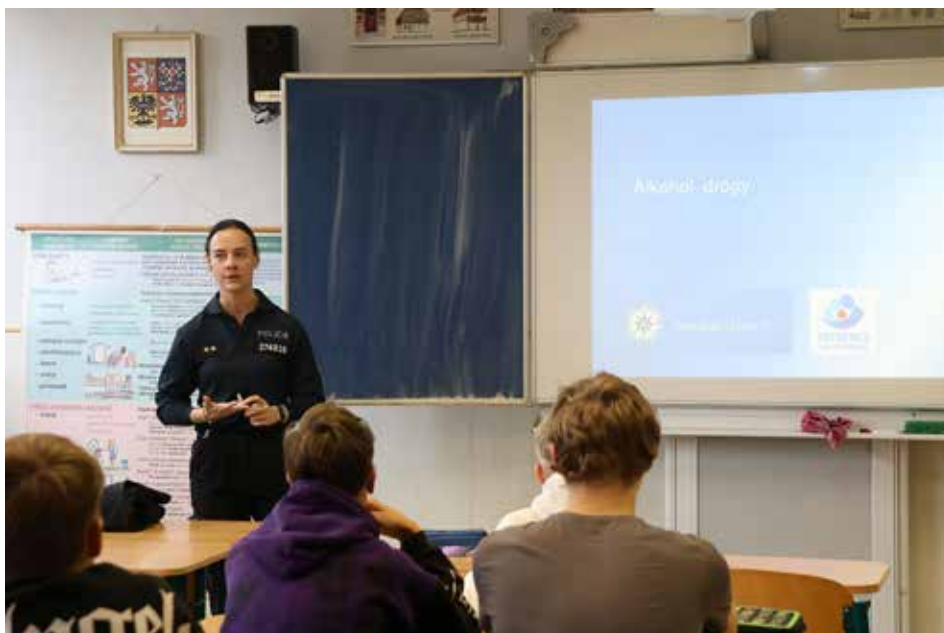
Osmáci besedovali o drogách