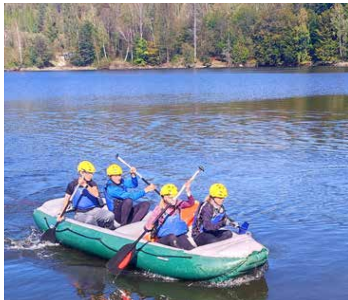
Pádlování na raftu byl velký boj