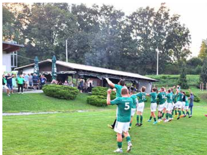
Po vítězství ve Staříčí - diváci jsou naším 12. hráčem i venku