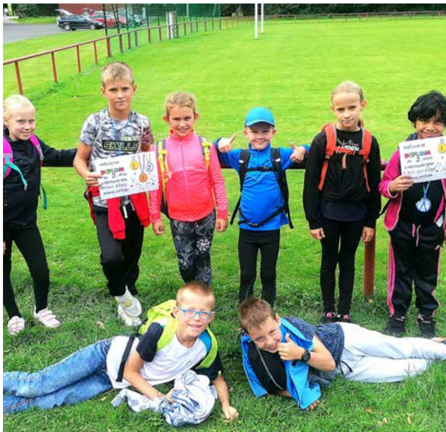
Děkujeme za vzornou reprezentaci naší školy