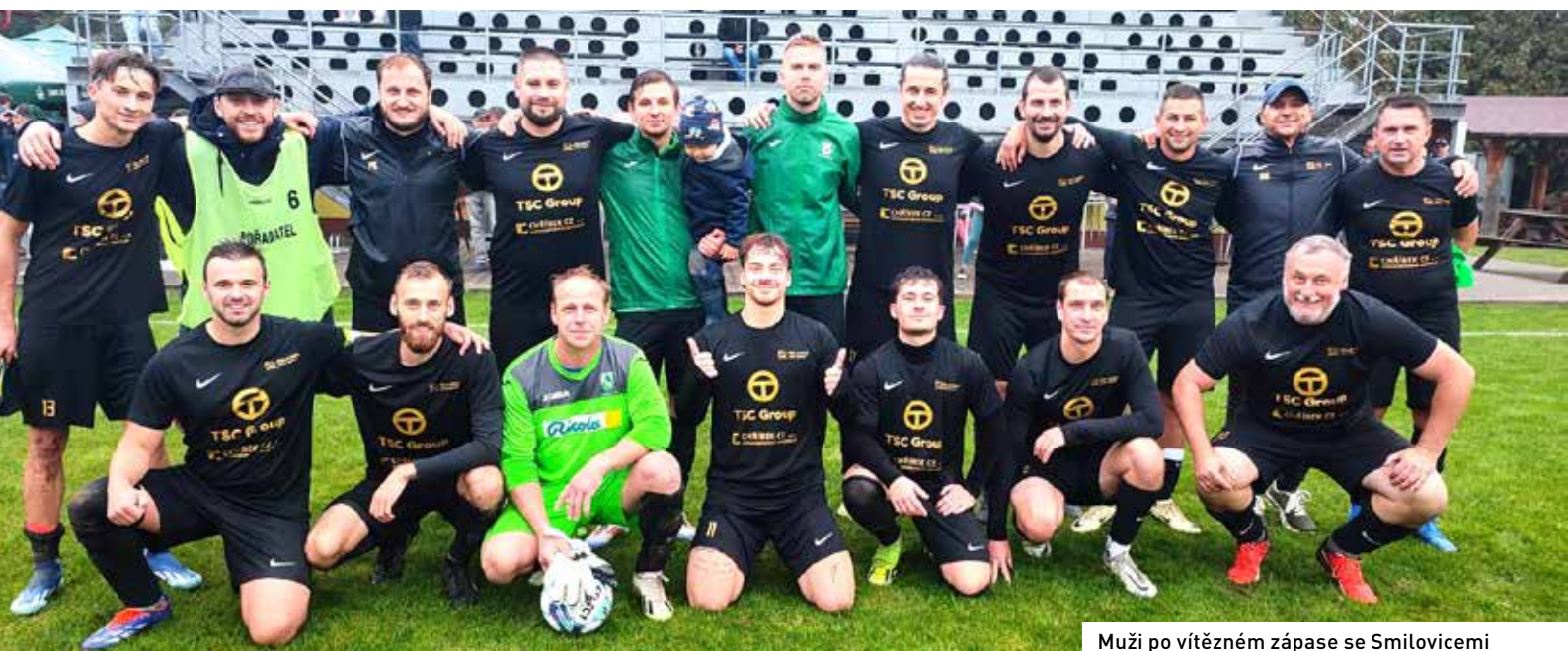
Muži po vítězném zápase se Smilovicemi