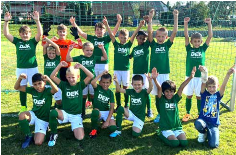
Na venkovním zápase přípravek