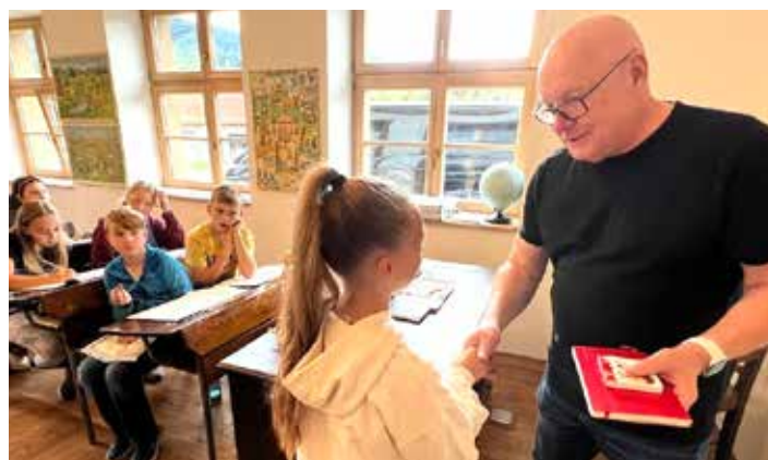
Každý účastník dosal osvědčení o absolvování kurzu