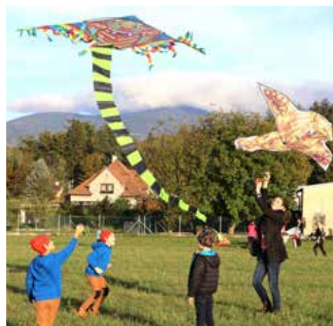
...když se to podaří, tak drak vyletí do oblak.