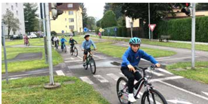
Závodění na silnici nepatří