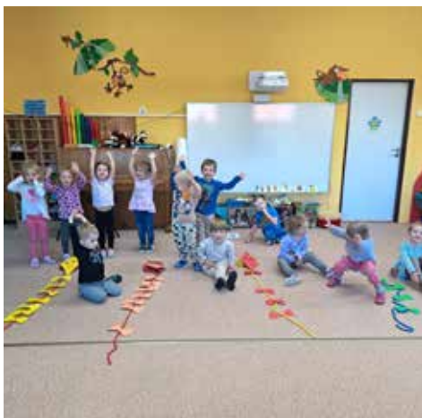
Květinka vyrábí draky