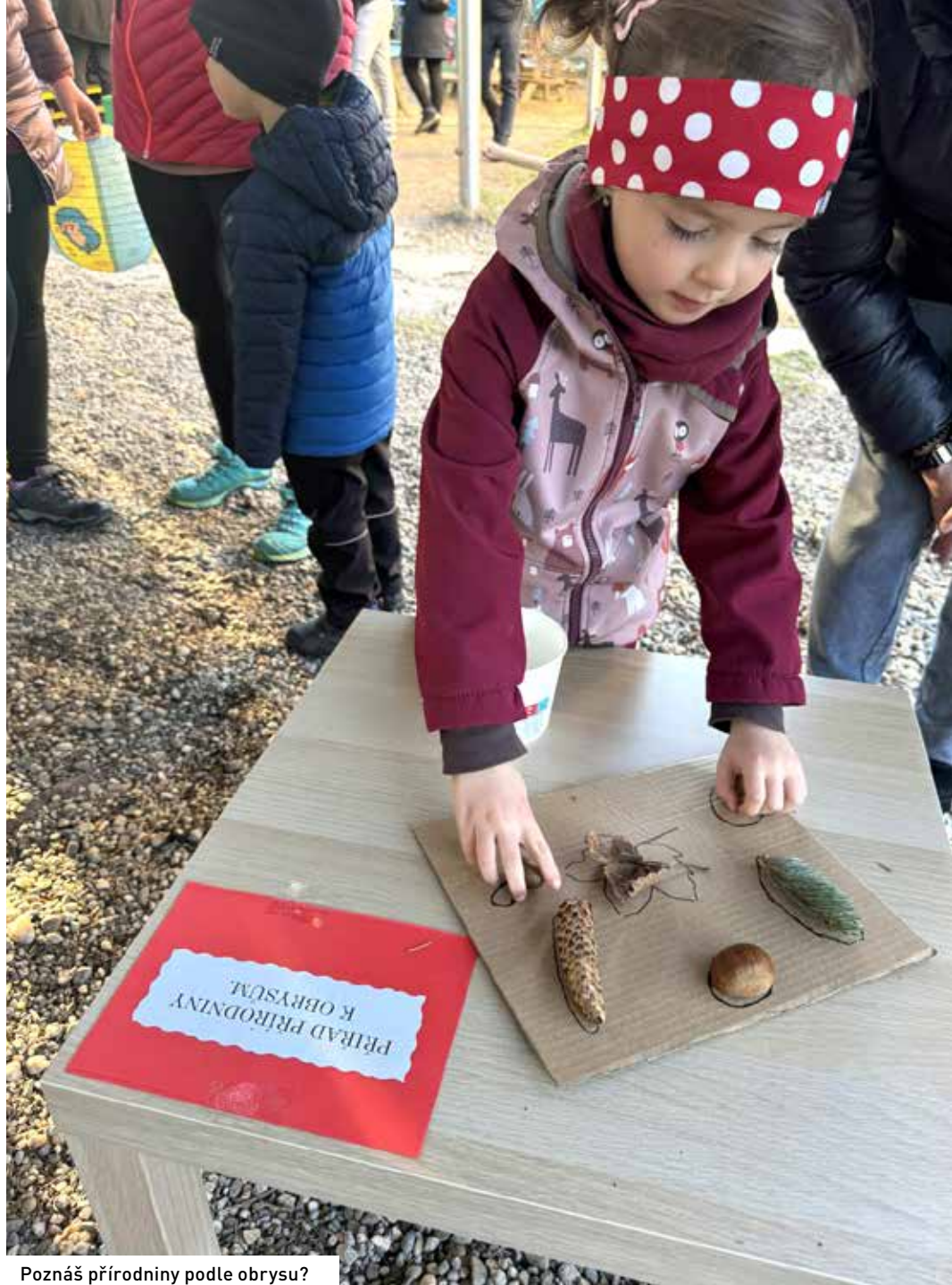
Poznáš přírodniny podle obrysu?