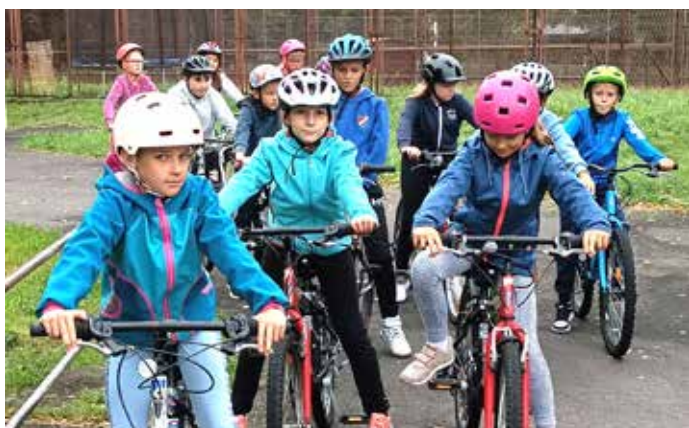
Helmy jsou nasazeny, můžeme vyrazit!