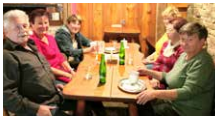
Pohoda ve Stodole