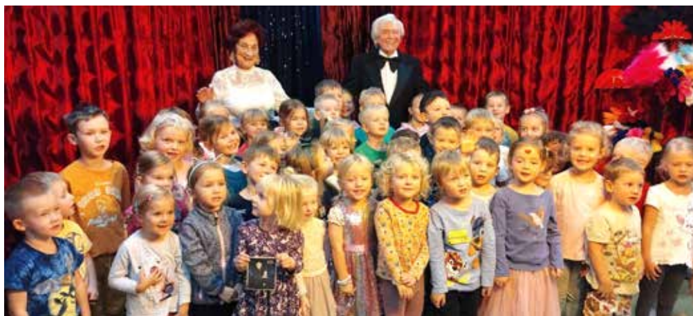
Užili jsme si to!