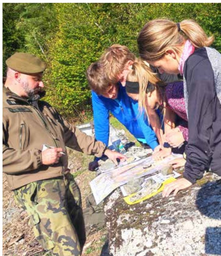
Podle mapy jsem právě na tom protějším kopci