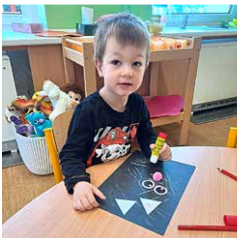
Tadeášek tvoří kočku