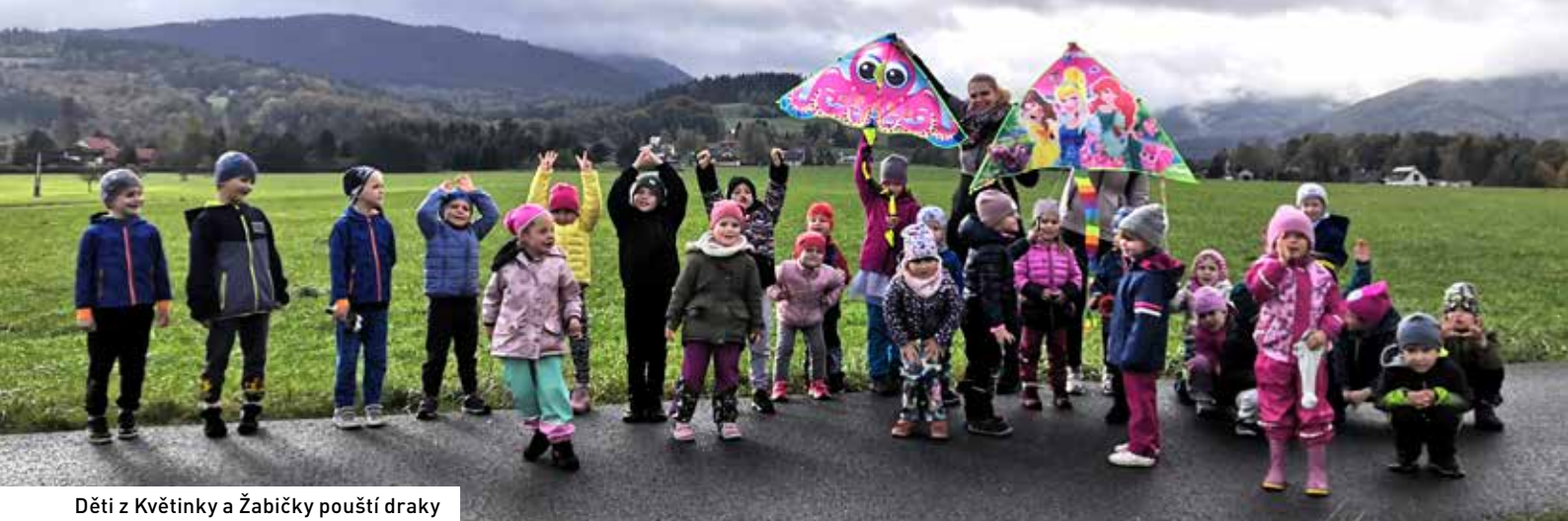
Děti z Květinky a Žabičky pouští draky