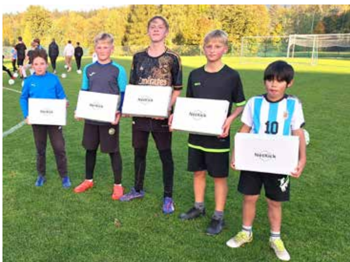
Žáci soutěžili na tréninku o ceny v dovednostních disciplínách