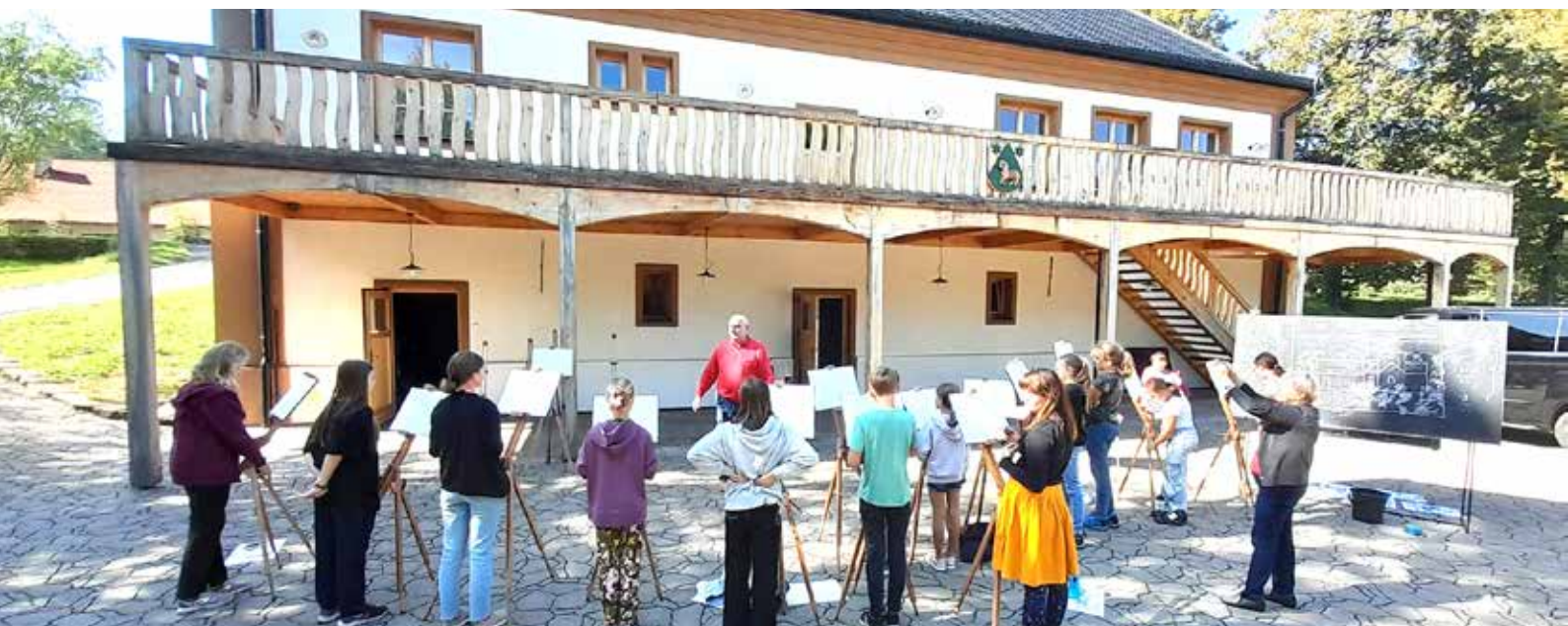
Areál Památníku Josefa Kaluse je pro pořádání podobných akcí ideální