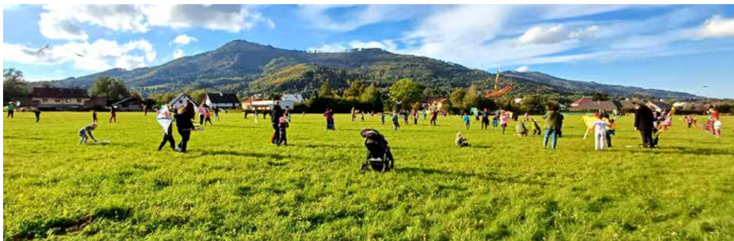
Společnou drakiádu se školní družinou si ve slunečném babím létě užilo přes 120 dětí, rodičů a prarodičů