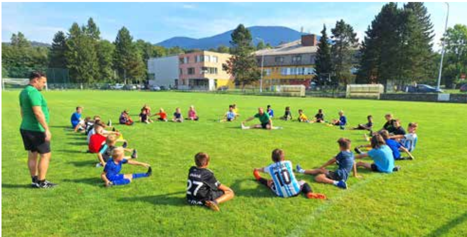
I ty nejmenší učíme, jak je důležité se pořádně protáhnout