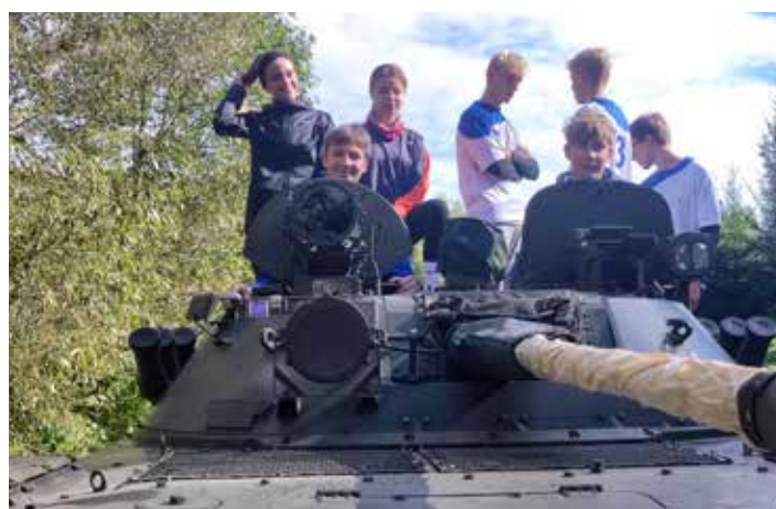
Poslední foto z báječného závodu