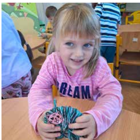
Rozárka si upletla kočku z vlny