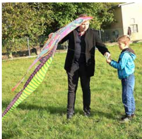
Pouštět draka není tak snadné...