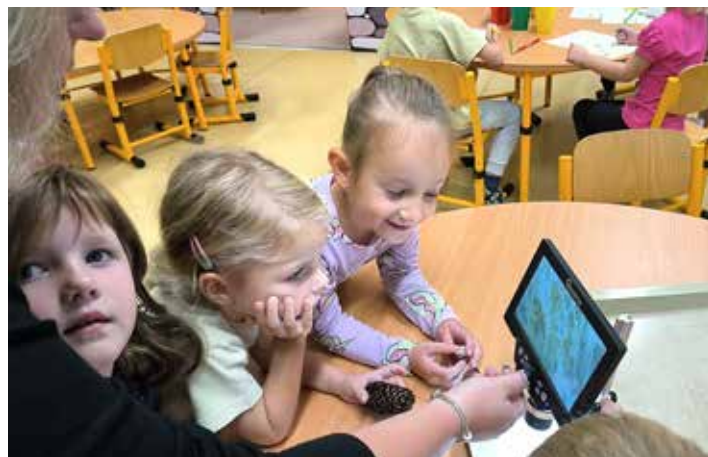
To vypadá zajímavě!