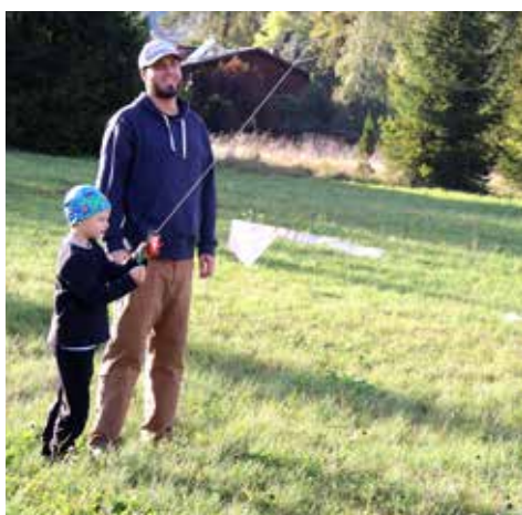
...společně se členy rodiny...