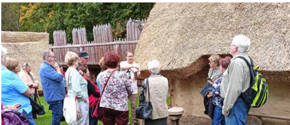
Komentovaná prohlídka hradiska v Chotěbuzi