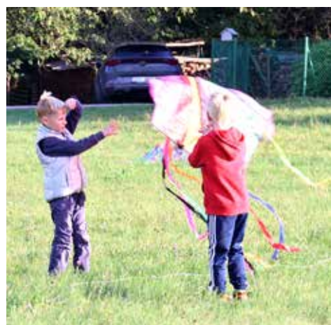
...i s kamarády.