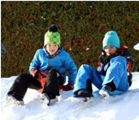
Dětská radost z pravé zimy