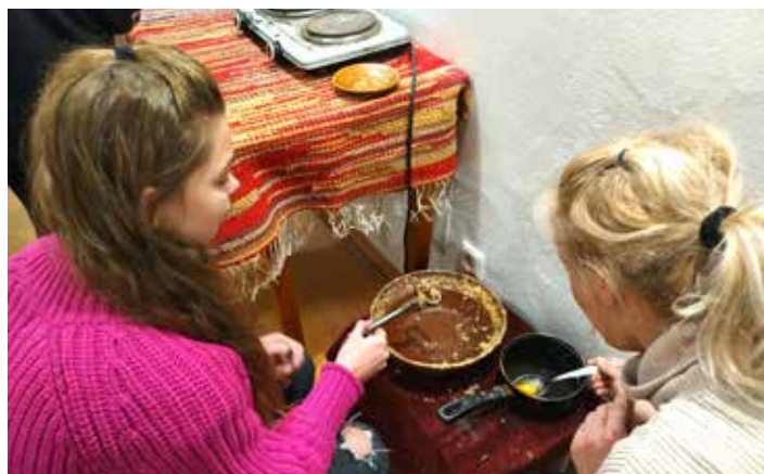
Věštění budoucnosti prostřednictvím odlitků z vosku