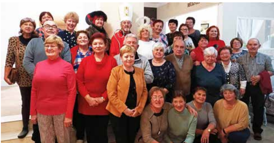
Úvodní společné foto účastníků modulu