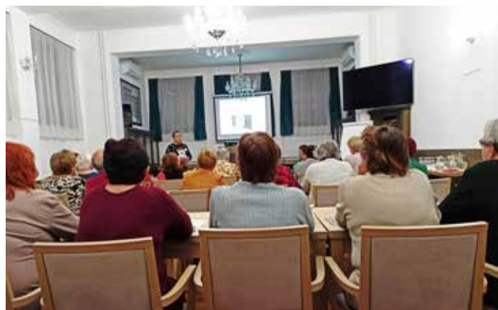
Probíhá jedna z přednášek