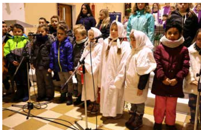
O svatě Barboře vyprávěli páťáci společně s prvňáčky