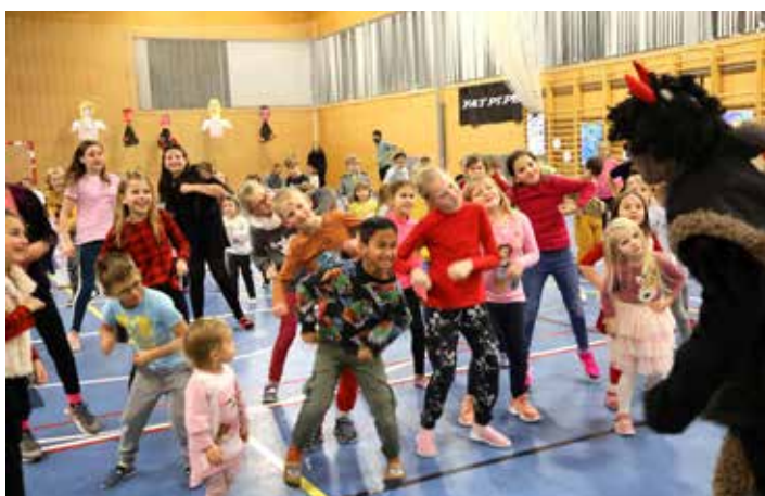
Čertovské řádění na Sněhovánkách musí být