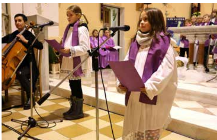
Koncert byl parádní díky sboru a nechyběla ani sólová vystoupení