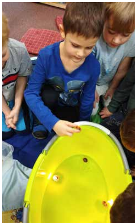
Jedna z vánočních tradic je pouštění lodiček se svíčkami