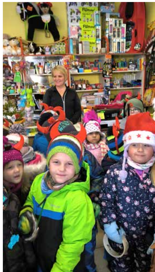
Na koledě v hračkářství