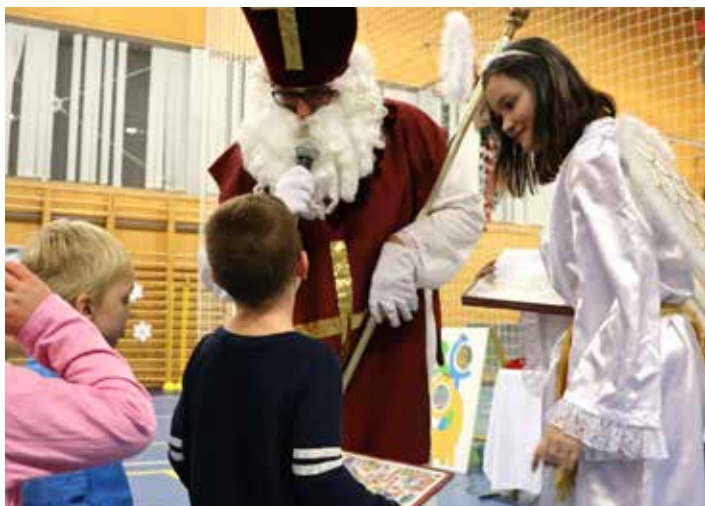
Přišel! A všem účastníkům Sněhovánek přinesl sladkou odměnu.