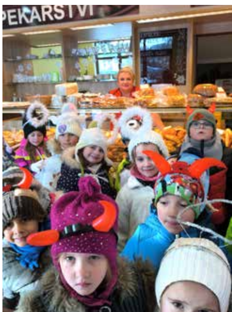
Na koledě v Pekařství Boček