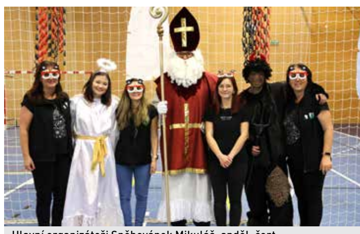
Hlavní organizátoři Sněhovánek Mikuláš, anděl, čert a paní vychovatelky v plné parádě