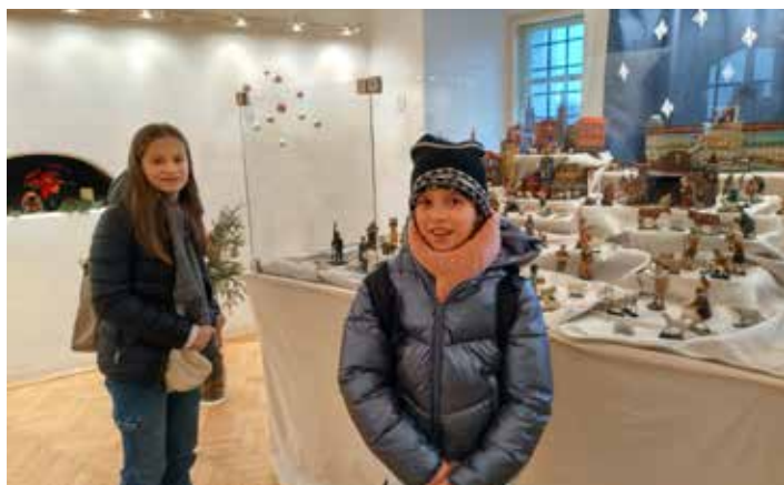
Tolik betlémů pohromadě jsme ještě neviděli