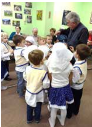
Zasloužená sladká odměna