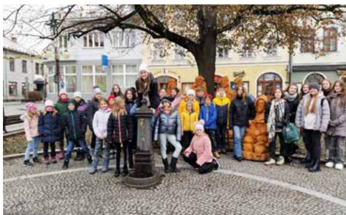
Účastníci předvánočního výletu pěkně pohromadě