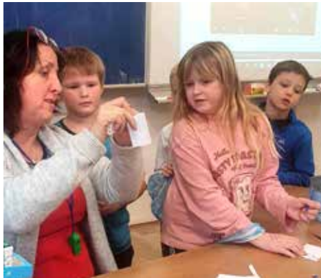
Na vánočních dílničkách se tvořilo o sto šest