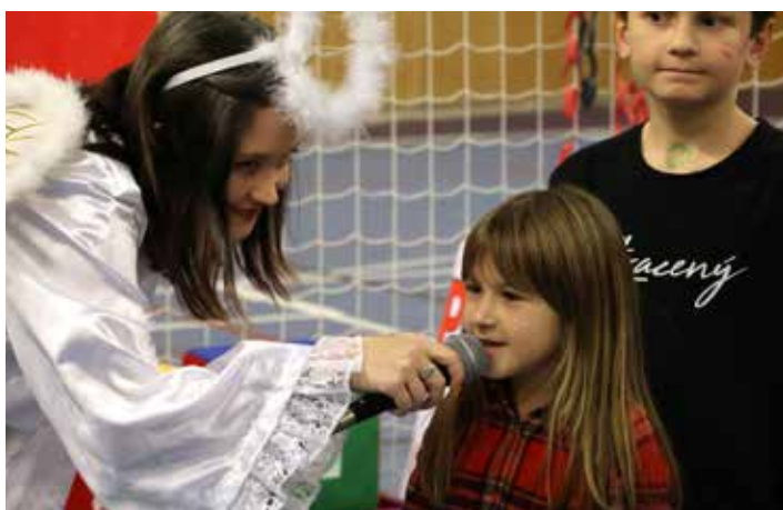
Nechyběla písnička pro Mikuláše...