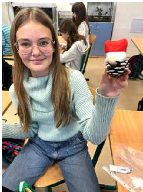
Skřítci ze šišek se povedli všem