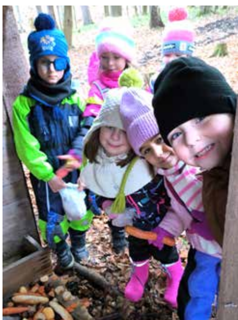
Žabičky nadělují zvířátkům