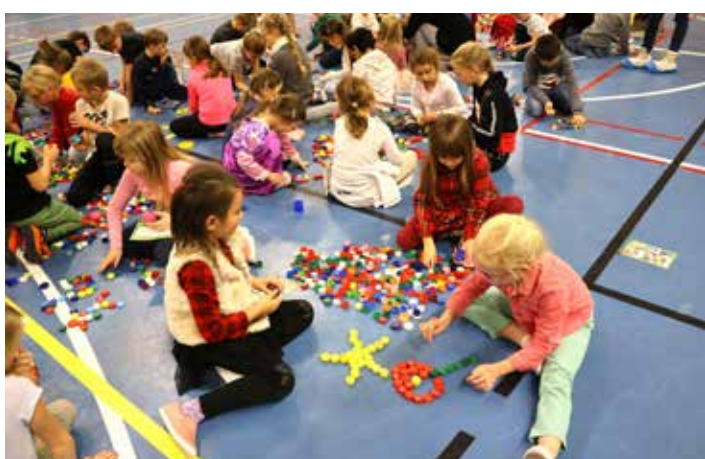
Na své si přišli i ti, kdo mají raději kreativní zábavu