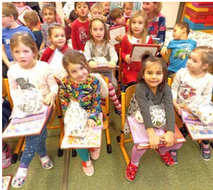
Žabičky s mikulášskou nadílkou