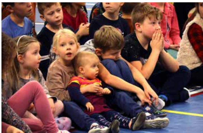
Čekání, zda přijde Mikuláš, bylo napínavé