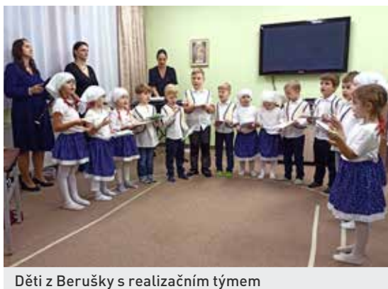
Děti z Berušky s realizačním týmem

První probíhalo v předvánoční atmosféře, pojedli jsme „nanečisto“ nějaké cukroví, popovídali si a popřáli hezké Vánoce. Druhý klubové setkání mezi svátky mělo charakter rozloučení se starým rokem. Vzhledem k vývoji posezení tentokrát nedošlo k promítání fotek a volbě fotky roku 2023, zrealizujeme jindy. Nakonec jsme si popřáli do nového roku a rozešli se do svých domovů.