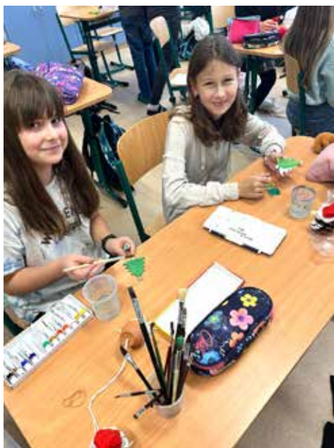
Děvčatům ze šestky šla práce pěkně od ruky