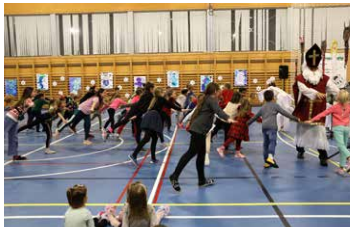
...a s Mikulášem byla i zábava