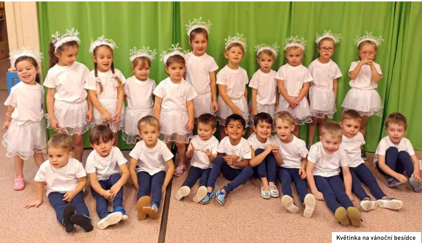
Květinka na vánoční besídce