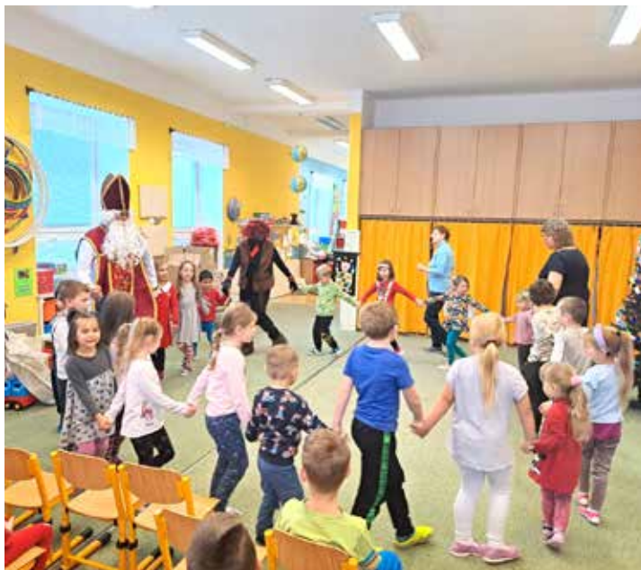
Tanec s Mikulášem