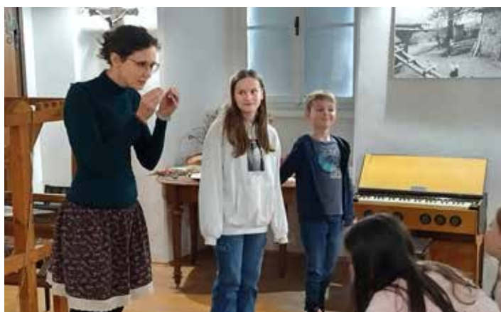
Lektorka vysvětluje jak probíhalo koledování...