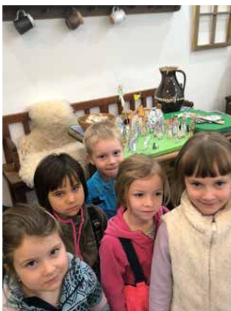
Žabičky a betlém ve Frenštátě