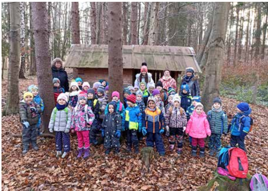
Děti z MŠ Krteček koledují u krmelce