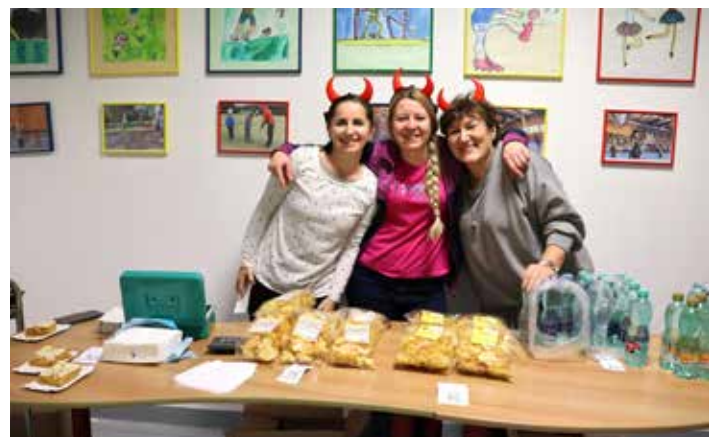
Aby nikdo netrpěl hladem či žízní měly na starost naše šikovné paní kuchařky