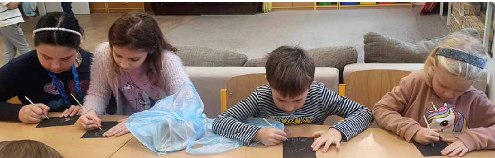
Vyrábění pohltilo malé i velké