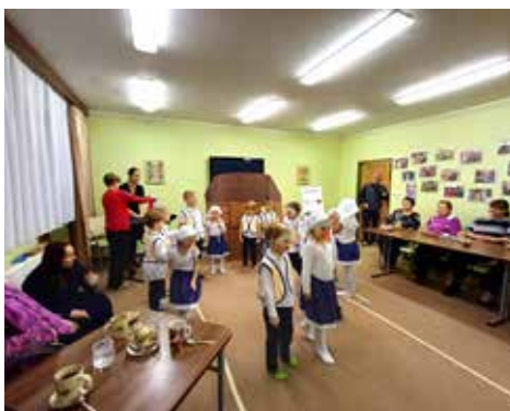
Na besídce v klubu seniorů