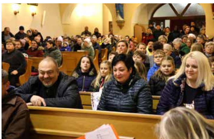
Diváci se na vánočním koncertu bavili skvěle