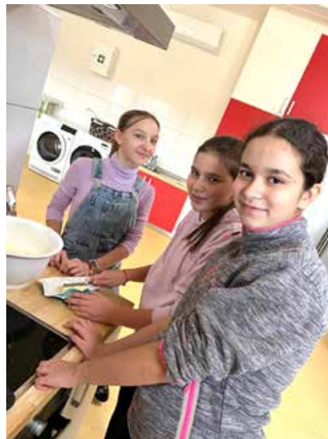
Vlastní recept na výrobu kuliček byl famózní