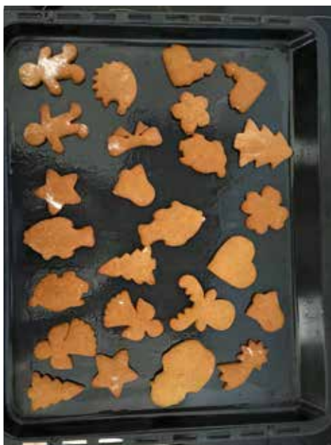
Perníčky se povedly na jedničku s *