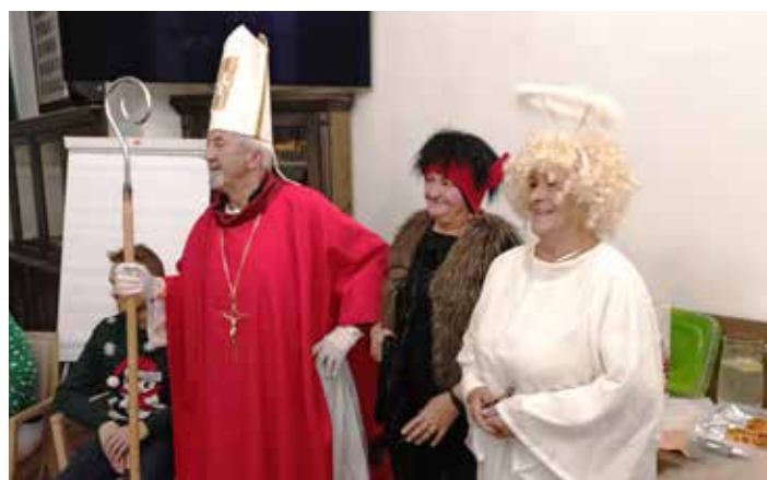
Mikulášský tým zubrohlavský