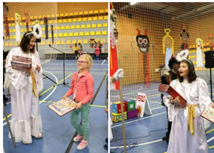
I anděl zíral, kolik hodných dětí na Čeladné máme