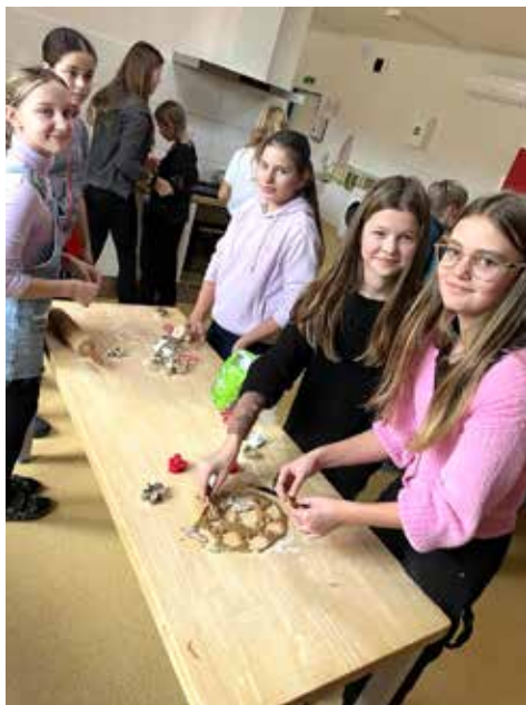
Školní kuchyňka zavoněla perníkem