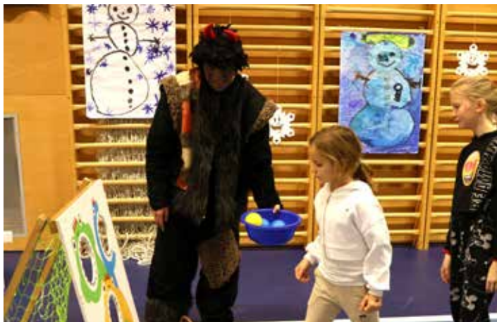
Čert nestránil, naopak si s dětmi užil rošťárny a čertoviny...