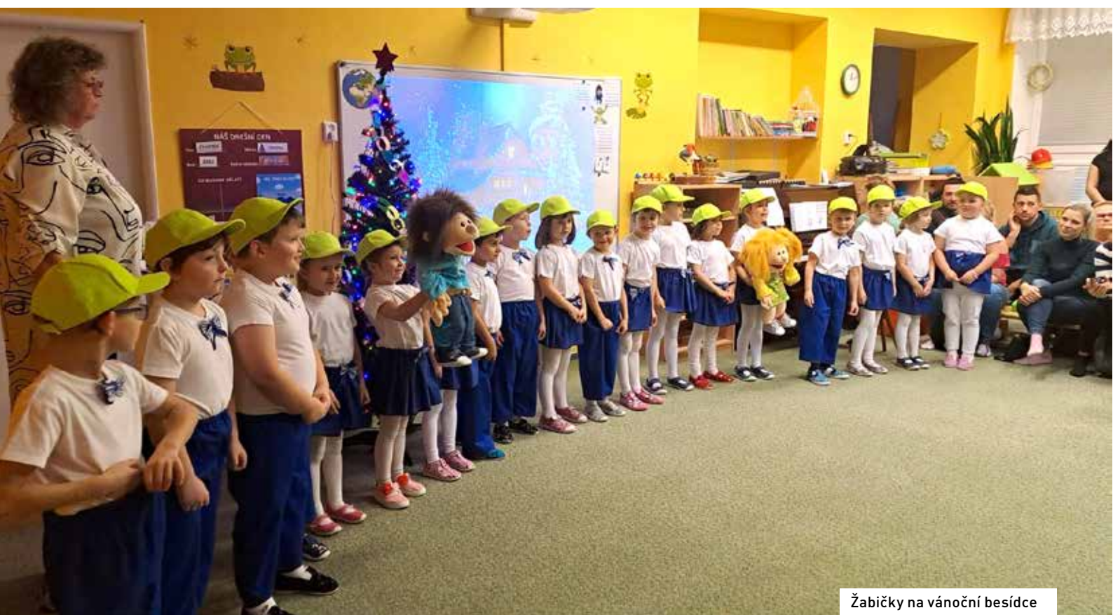
Žabičky na vánoční besídce