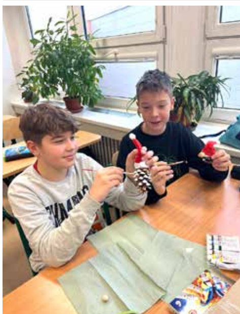
Nejen holky i kluci se mohli pochlubit skvělým výsledkem