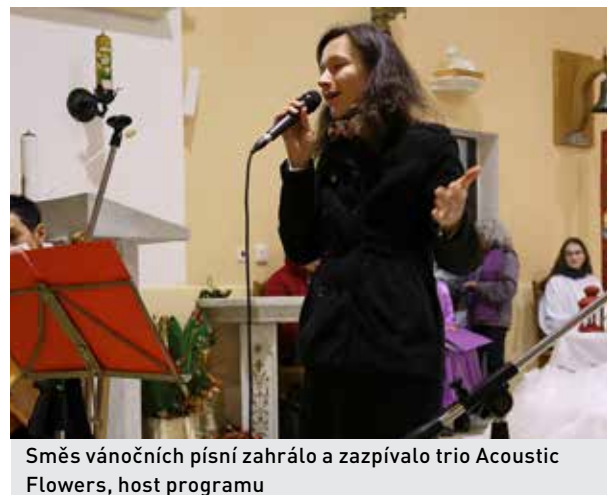
Směs vánočních písní zahrálo a zazpívalo trio Acoustic Flowers, host programu