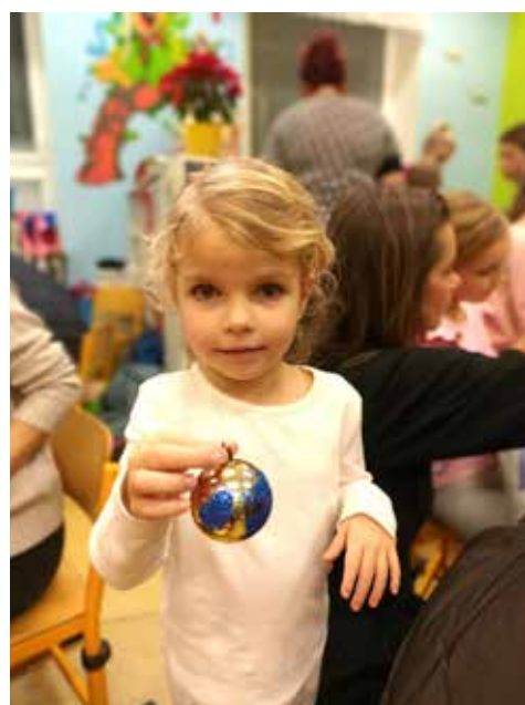
Tonička a její nádherná vánoční baňka