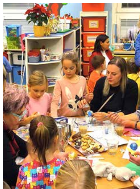
Momentka z vánoční dílničky