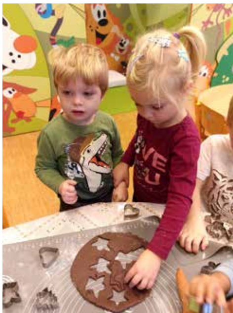
Ondrášek a Timinka pečou perníčky