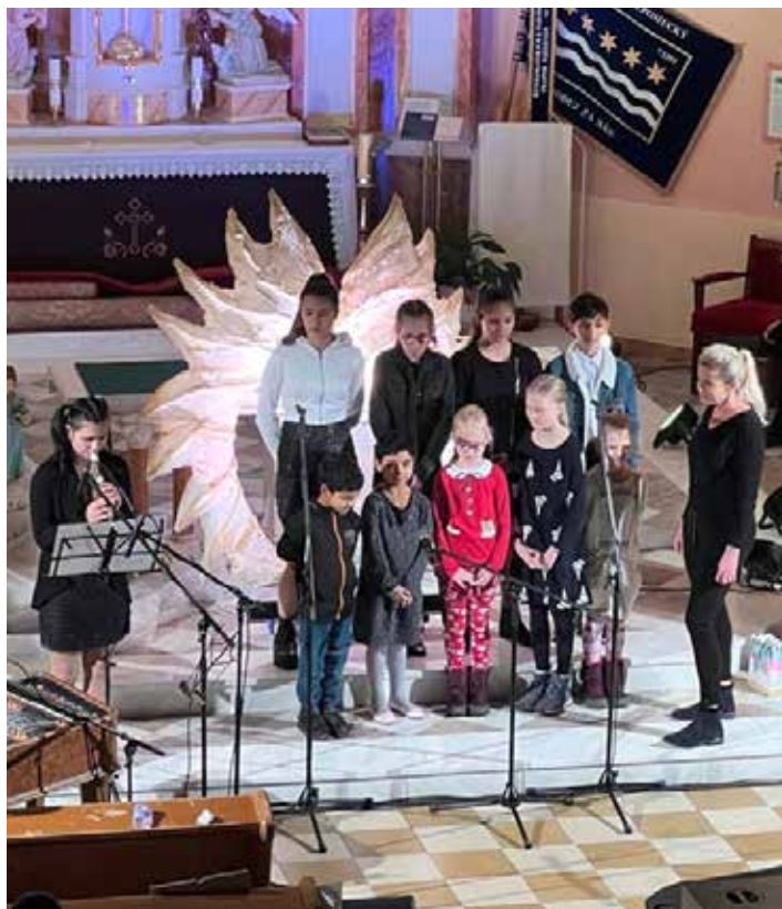
V kostele se představili i talentovaní kluci a holky, kteří vyrůstají v čeladenském dětském domově