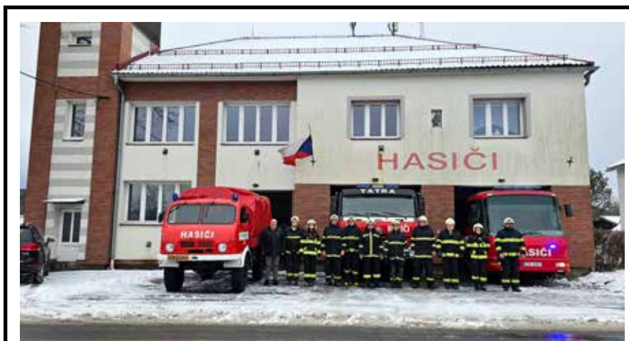
Minutou ticha před hasičárnou uctili v sobotu 23. 12. v poledne oběti pražského předvánočního masakru také členové SDH Čeladná a starosta obce