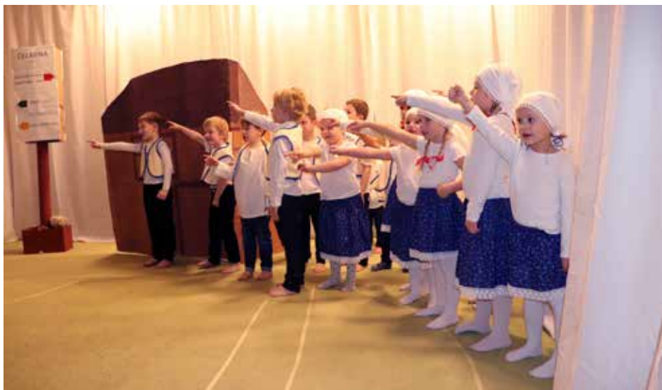
Z Beskyd do Betléma je to přes 4000 kilometrů

Těšíme se, až nastane jaro a půjdeme se podívat do Památníku Josefa Kaluse prohlédnout si exponáty, které život v Čeladné ukazují. Snad jsme u dětí vzbudili zájem o náš kraj a přispěli k účtění k tomu, co dokázali naši předci.