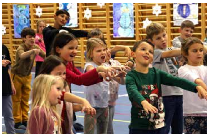
Vidíte, co nás ten čert naučil?