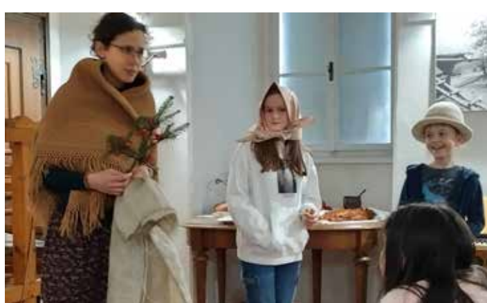
...u praktické ukázky jsme se dobře pobavili