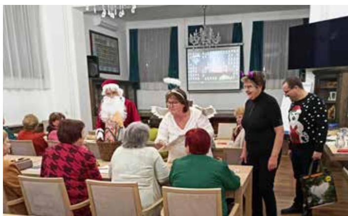
Mikulášský tým univerzitní