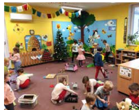
Před Vánocemi přišel Ježíšek i do školky