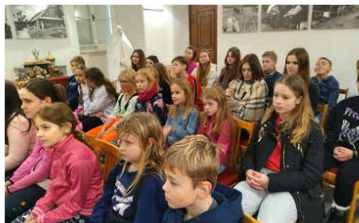
Zajímavé vyprávění o zvycích našich předků jsme si vyslechli v Příboře