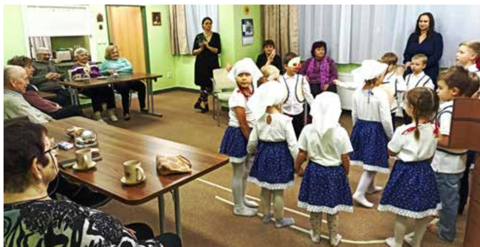
V podstatě symbióza tří generací