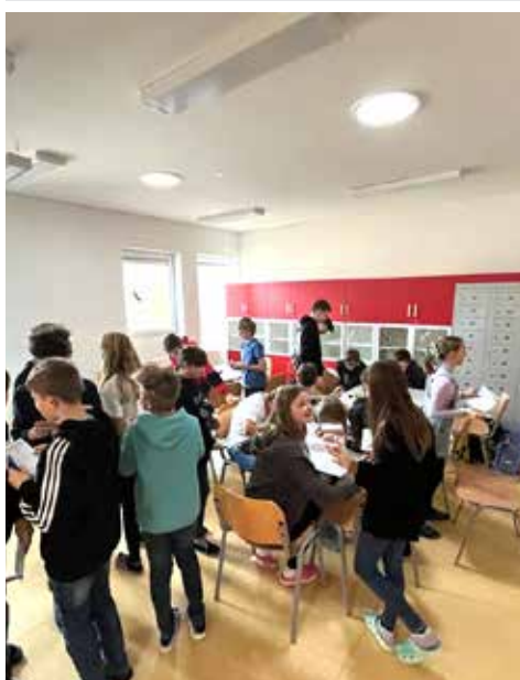
Cukroví pekli společně žáci z VI. A i VI. B