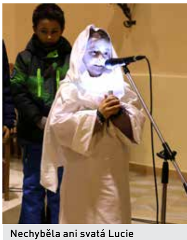
Nechyběla ani svatá Lucie