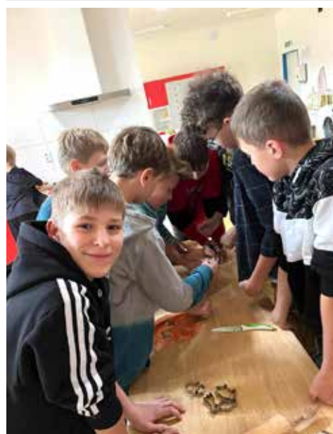
Důkaz, že pečení není jen doménou dívek