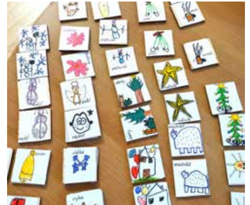
Prvňáčci vyrobili originální pexeso