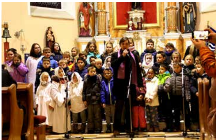
Žáci ZŠ vystoupili na tradičním vánočním koncertu již po dvacáté páté