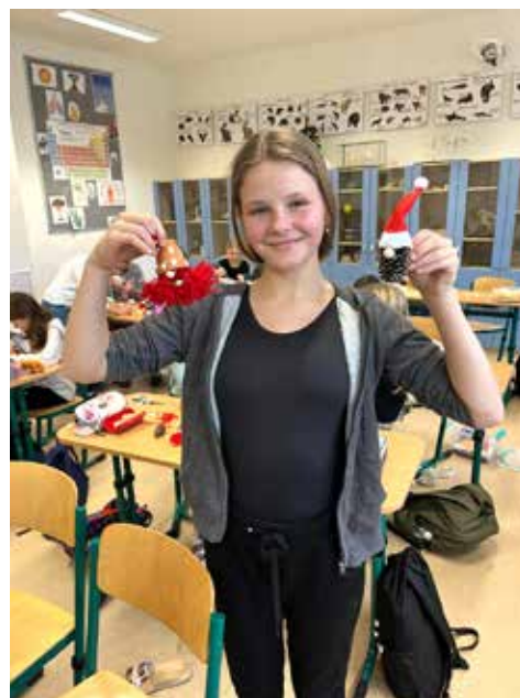
Výroba skřítků zamotala šestákům ruce