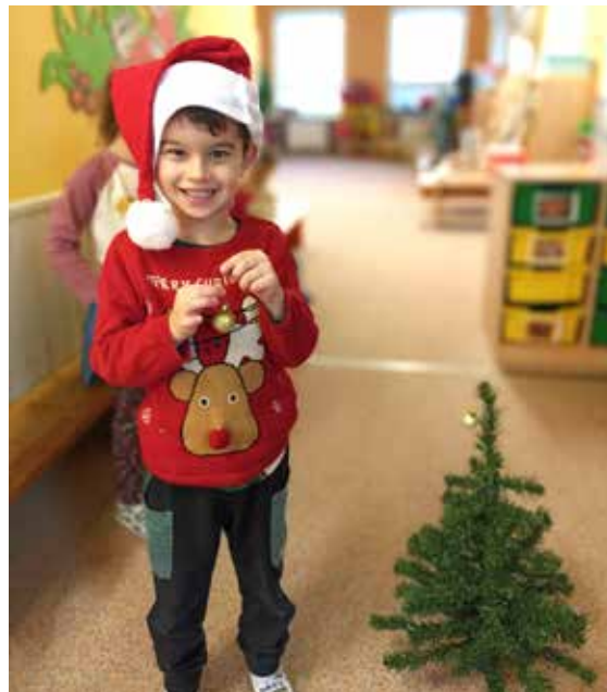
Tobik zdobí vánoční stromček

Poslední týden před Vánoci jsme šli tradičně koledovat zvířátkům ke krmelci. Děti jim donesly kaštan, mrkvičku, jablíčka, zazpívali jsme jim koledy, aby jim to nebylo líto, a hurá zpátky do školky. Také jsme se společně s dětmi z Žabičky vydali koledovat na obec, abychom zástupcům obce poděkovali za vše, co pro naši školku a celou Čeladnou dělají. Moc si toho vážíme. Poslední dny už jsme netrpělivě očekávali Ježíška, a tak věřím, že děti strávily vánoční čas krásně se svými rodiči a celou rodinou.