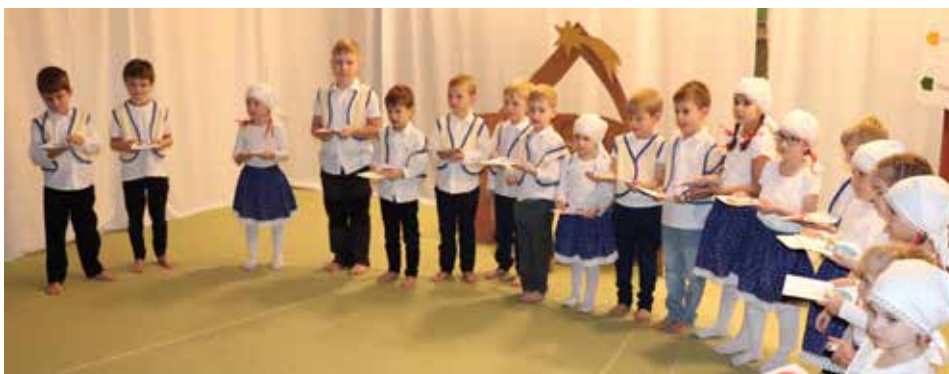
Na závěr besídky zazněla lašská píseň Hory v bílých loktuškách