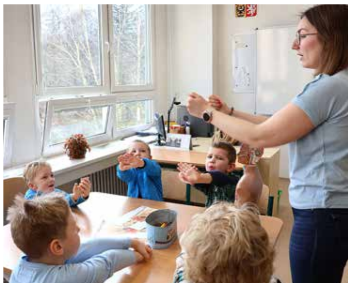
Beruška: lidské tělo