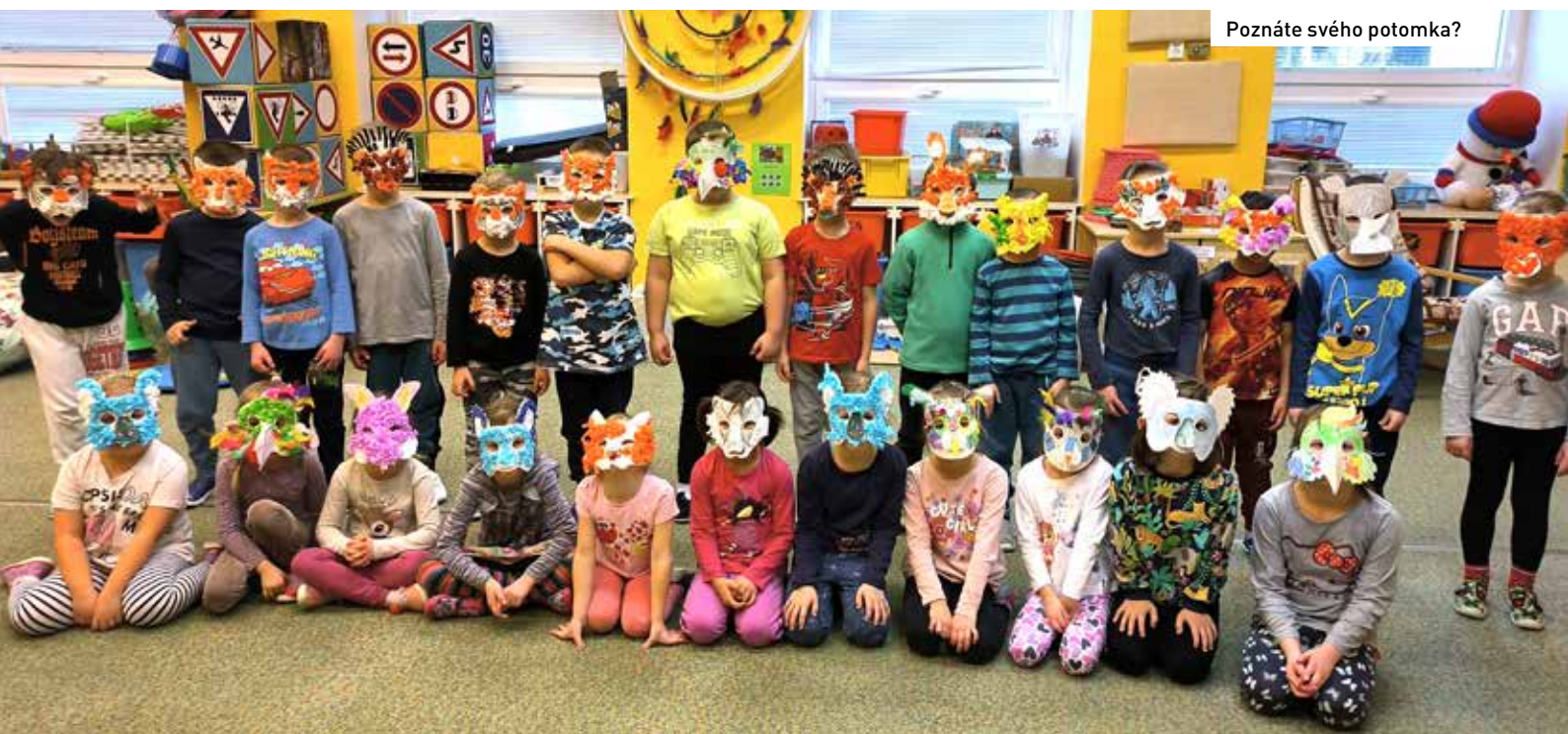
Poznáte svého potomka?