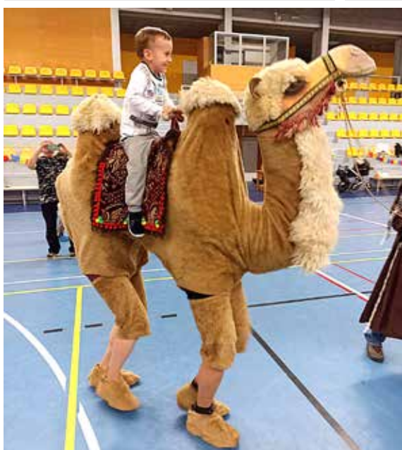
Jeronýmek na velbloudu