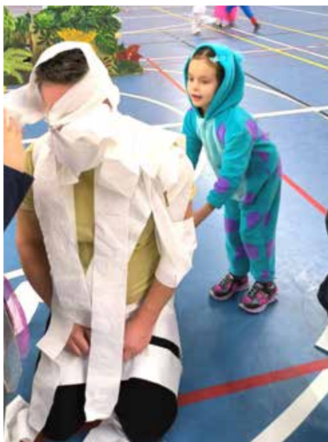
Neboj tati, papíru je dost