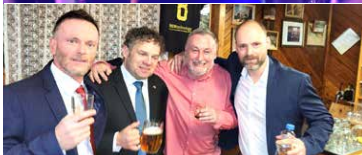
Stejně jako na hřišti každý věděl, kde je jeho místo