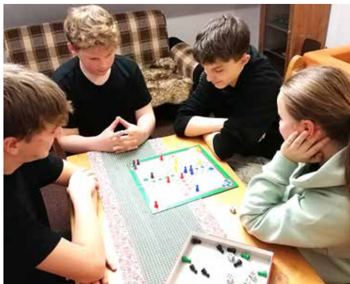
Místo moderních deskovek jsme si užili „člověče“