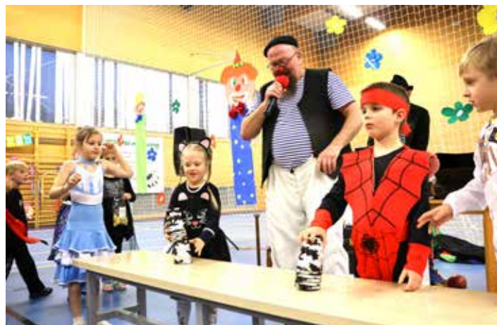
Soutěže ke karnevalu prostě patří