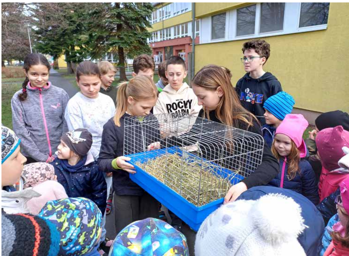
Během setkání jsme školákům darovali morčátko, které se nám ve školce narodilo. Školáci jej se svolením paní učitelky s radostí přijali. Přírodovědné činnosti v ZŠ se díky tomu rozšíří o péči o další živý exemplář.