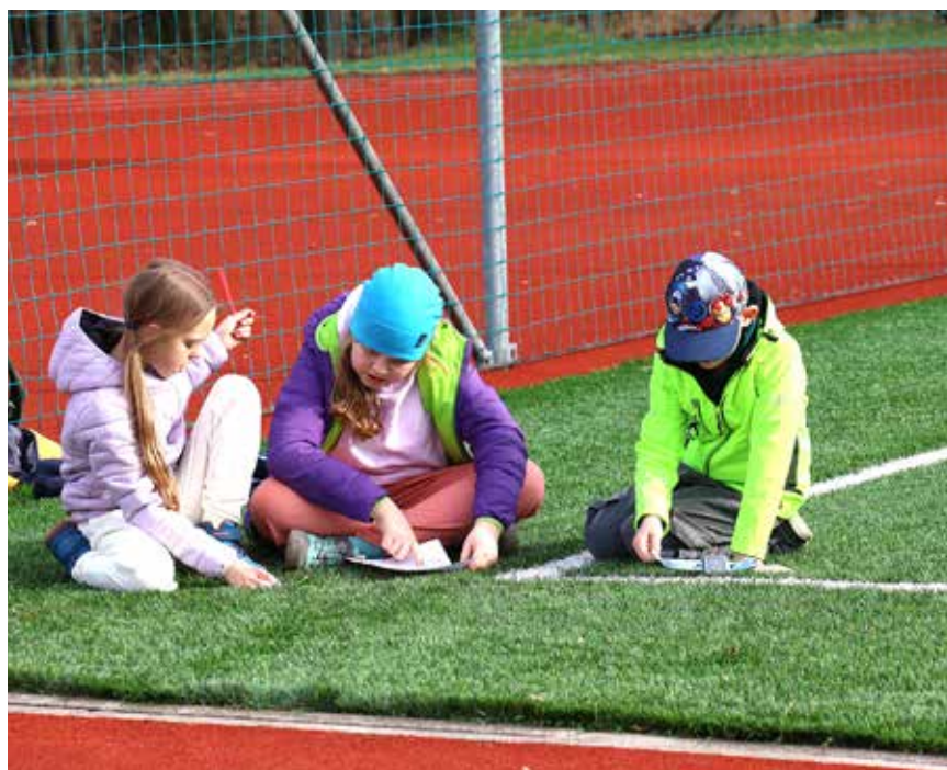
Luštění masopustní tajenky