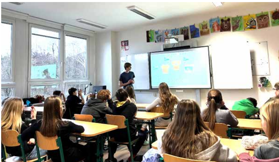
Téma kluky a holky zaujalo, stejně jako šikovný lektor, který vše zajímavě objasnil

Pro žáky zcela zásadní byla ale myšlenka udržitelného nakupování. Formou jednoduché aktivity zjistili, odkud pochází většina jejich šatníku, a došli k překvapivému závěru, že nevede všemi očekávané