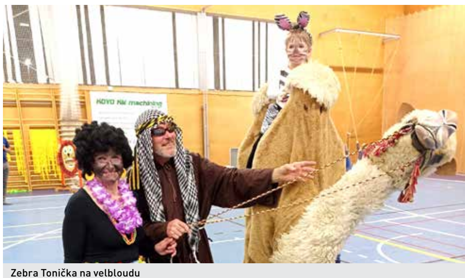
Zebra Tonička na velbloudu

Energii si všichni doplnili spoustou dobrot a nechyběla ani tombola. Malé princezny, víly, kočky, malí Spidermani, hasiči, potápěči, Harry Potterové... si odnesli nejen skvělé zážitky, ale také dárečky.