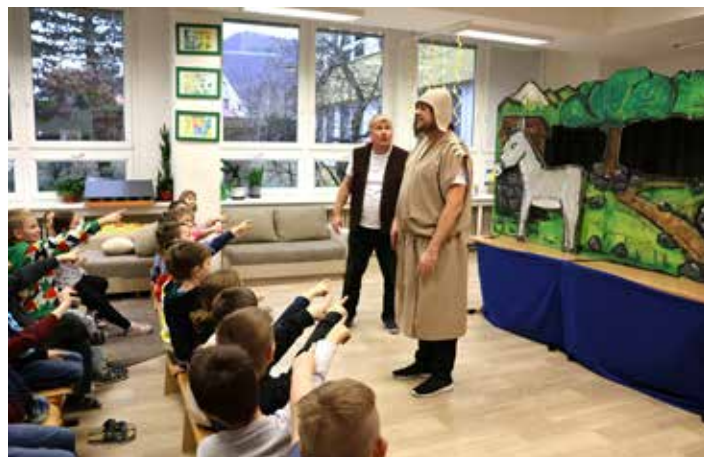
...a dokonce Ezopovi radili!