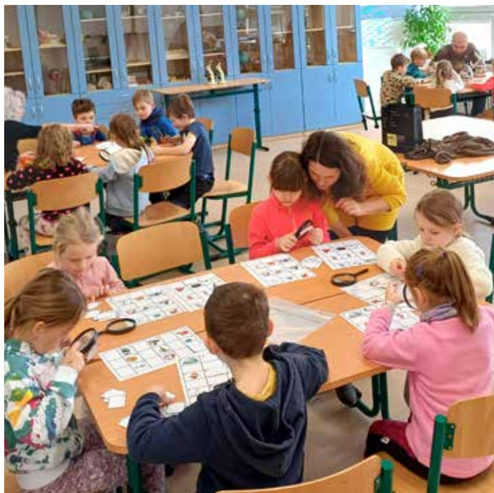
Učitelé a učitelky ze ZŠ Čeladná připravili pro děti ze školky zajímavý přírodovědný program, který všechny děti nadchnul