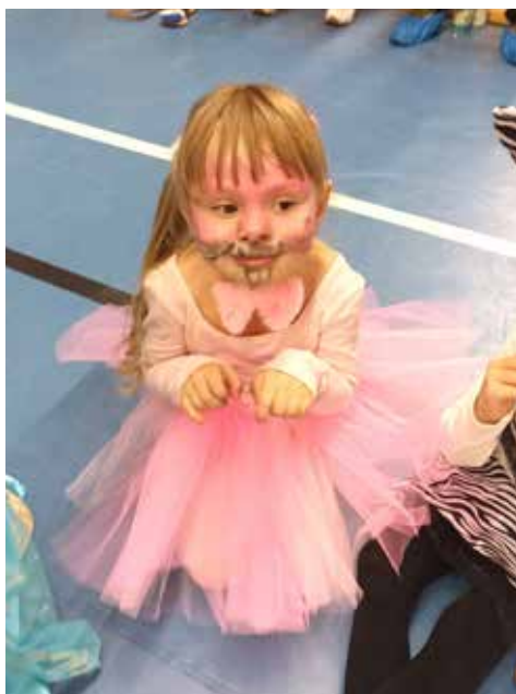
Magdička jako králiček