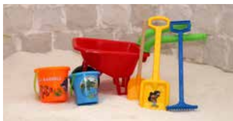
Magdička jako králíček

Jeskyně je příjemně osvětlená, teplé barvy tělo povzbudí a doplní mu energii. Naproti tomu studené barvy zklidní mysl a zlepší náladu, relaxační atmosféru doplňuje klidná hudba. Pobyt pomáhá při onemocněních cest dýchacích, poruch imunity u dětí i dospělých, revmatických onemocněních, zažívacích problémech, kožních onemocněních a dalších problémech. Navštěvovat ji mohou malé děti, senioři a je vhodná i pro těhotné ženy.