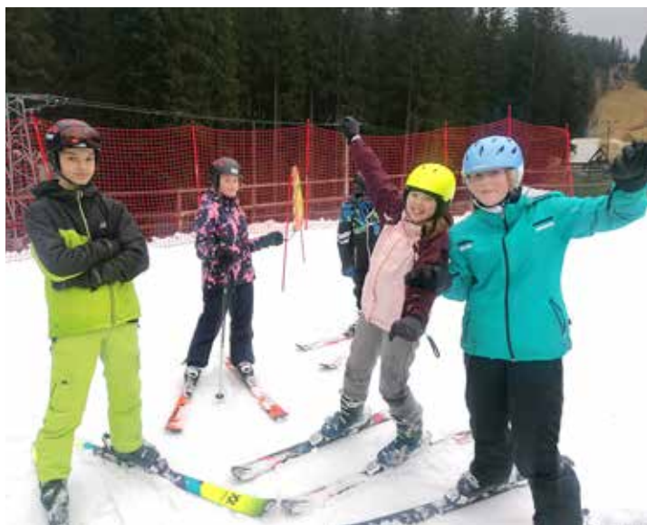
Radost až na kost!