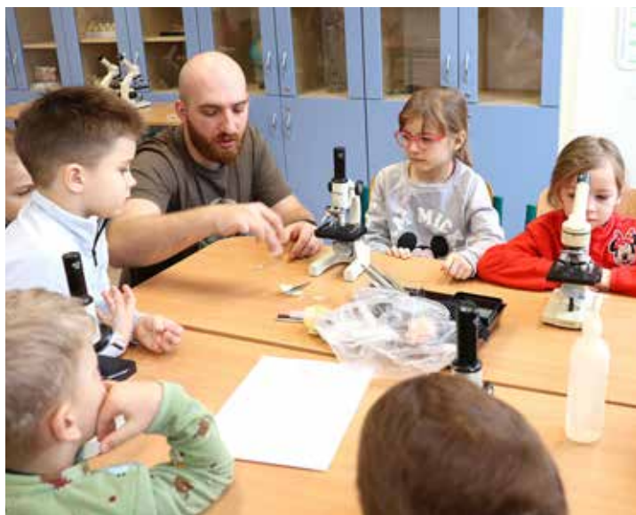
Krteček: práce s mikroskopem