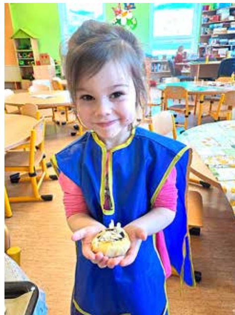
Natálka upekla koláčky pro babičku