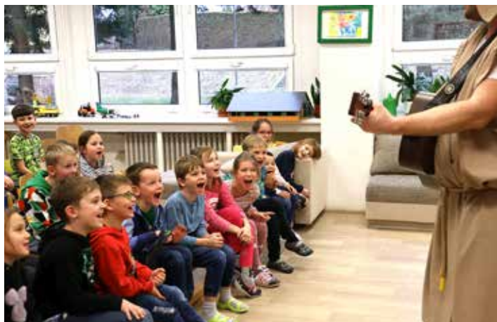
Malí diváci byli vtaženi do děje...

V únoru se děti pobavily i poučily u divadelního představení s názvem Bajky pana Ezopa aneb Dávná moudra věčně platná. Hlavním protagonistům se podařilo moderní formou zprostředkovat současným dětem tyto více než dva a půl tisíce let staré příběhy, které vypráví zejména o kladných a záporných lidských vlastnostech. Herci diváky pobavili svou hravostí a vtipem, kterým okořenili vypravěčské umění pana Ezopa. Děkujeme Divadlu pro školy, které k nám přijelo z Hradce Králové, a těšíme se, že se opět někdy uvidíme u některého z dalších představení.