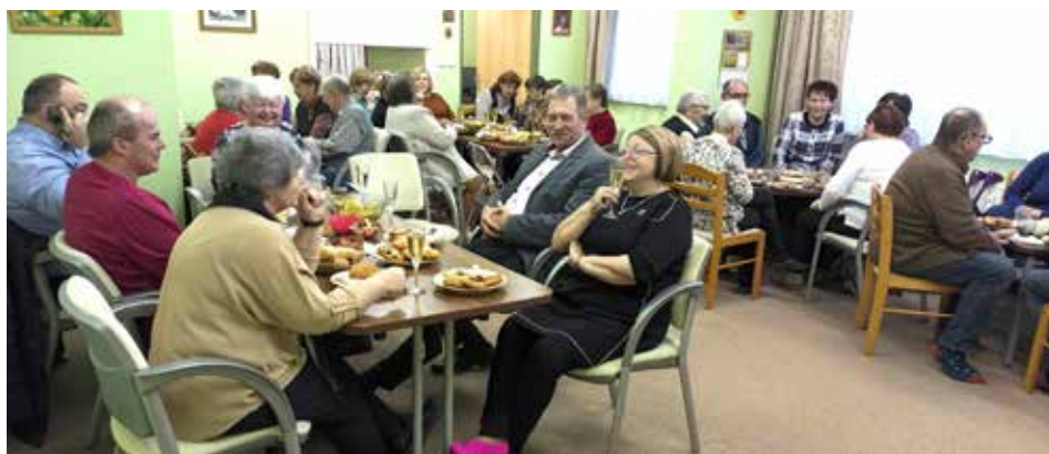
Zaplněná klubovna na letošním výročním setkání