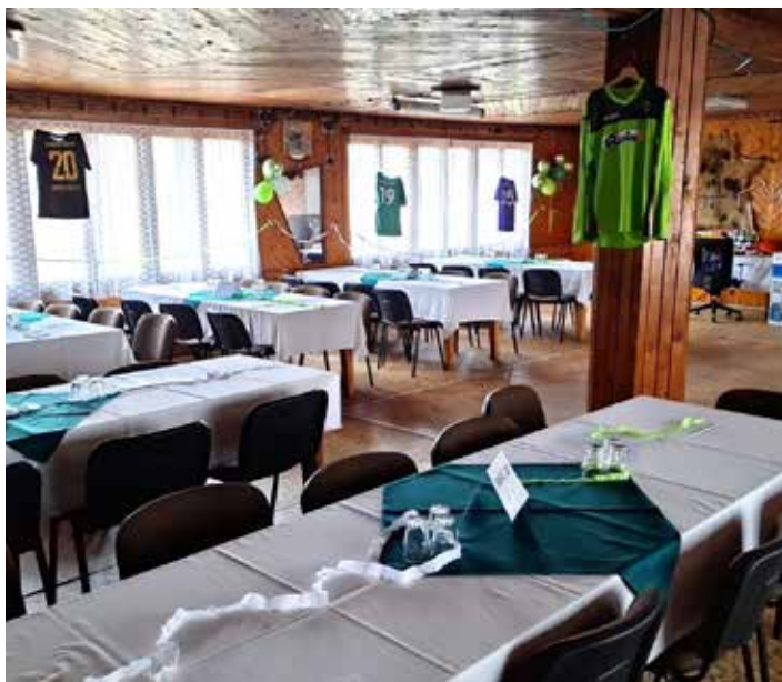
Sál připraven v režii fotbalistů