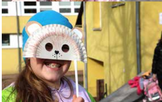
Masopustní škrabošky se opravdu povedly