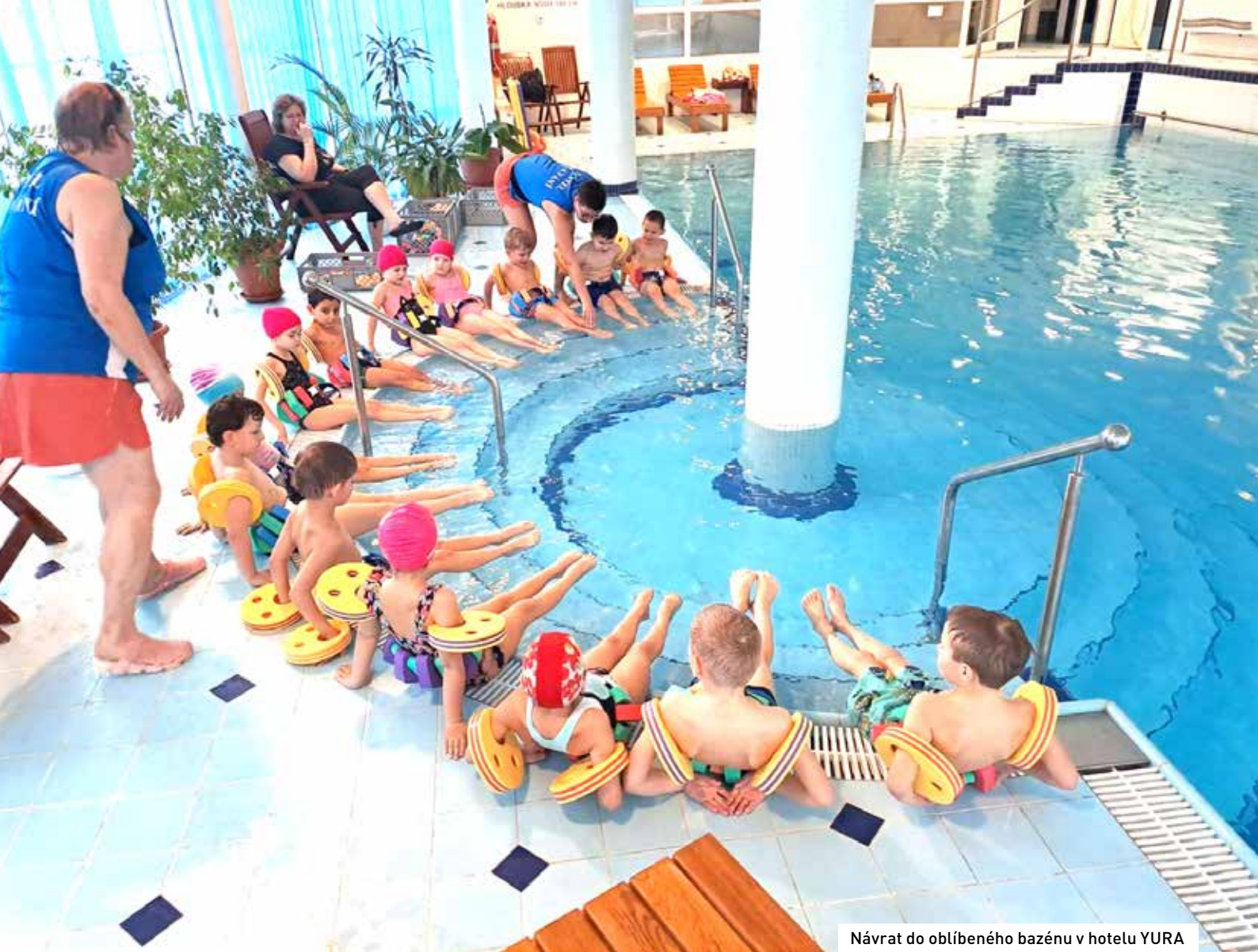
Návrat do oblíbeného bazénu v hotelu YURA