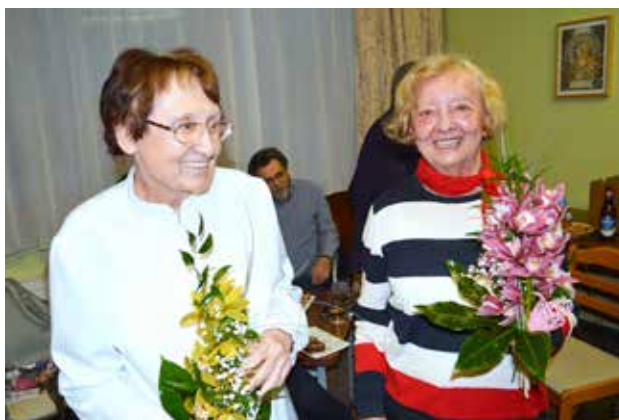
Fotka roku 2023: Poděkování dlouholetým členkám klubové rady na loňském výročním setkání

Cílem vycházky byla čeladenská restaurace Na Rozcestí, kde jsme v míru a pohodě poseděli, pojedli a popili. Vzhledem k počasí byl zcela vynechán obchvatný pěší přesun po „okruhu Anny Trefilové“, což se dalo očekávat.