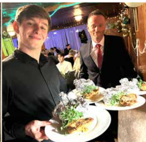
Kuchaři i číšníci z vlastních řad, tak to má na správném fotbalovém plese být