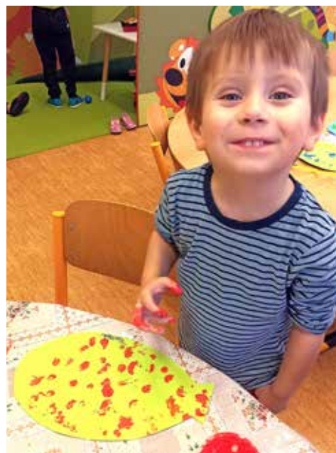
Toniček tvoří balónek prstovými barvičkami