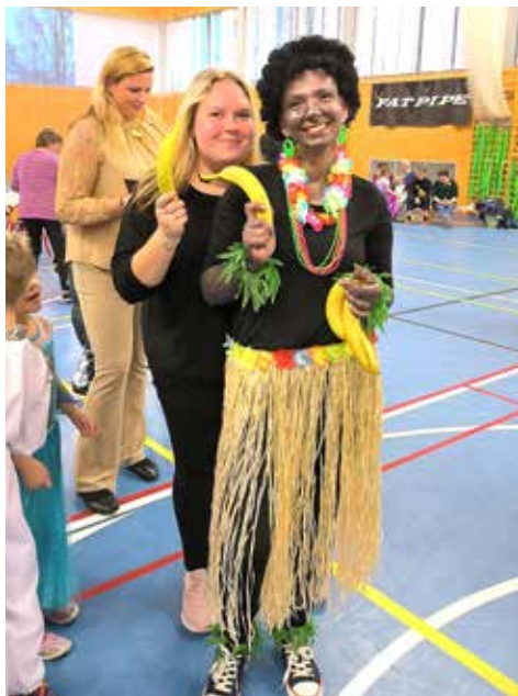
Banány ještě nedošly