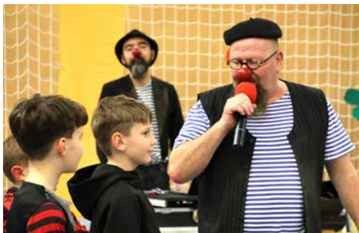
S klauny se bavili malí i velcí