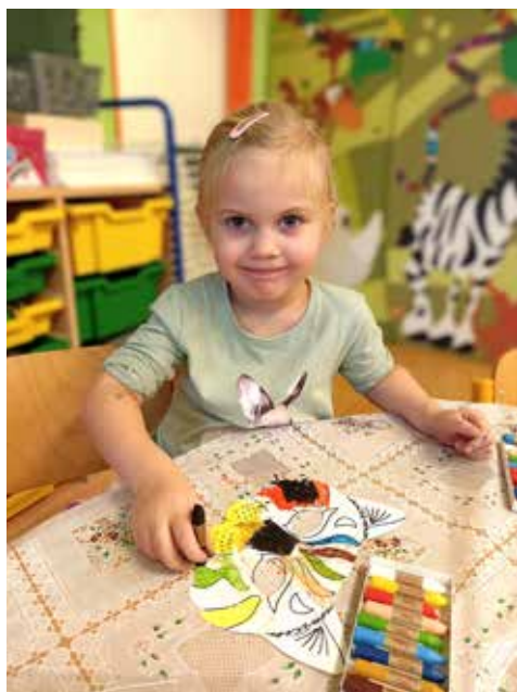
Timinka tvoří karnevalovou masku