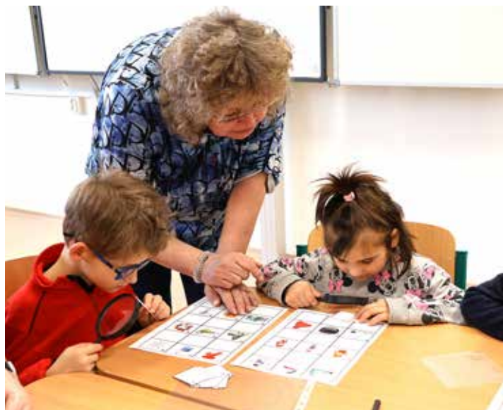
Krteček: práce s lupou