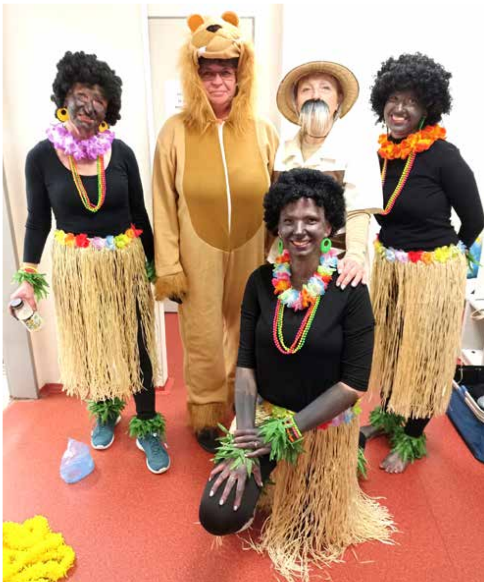
Lev, Pampalini a krásné tanečnice

Korunou karnevalu byl velbloud, který nejen „plival“ po zúčastněných, ale také povozil všechny předškolní děti, protože ty starší a těžší už by nezvládl. Ale byla legrace a děti si to užívaly stejně, jako by je vozilo opravdové zvíře, k tomu živému opravdu moc daleko neměl.