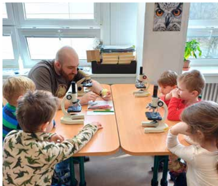
Ve „velké“ škole děti objevovaly tajemství přírody