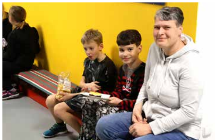
V bufetu mohli návštěvníci doplnit potřebnou energii