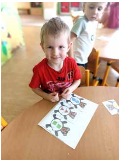
Maty lepí tvary