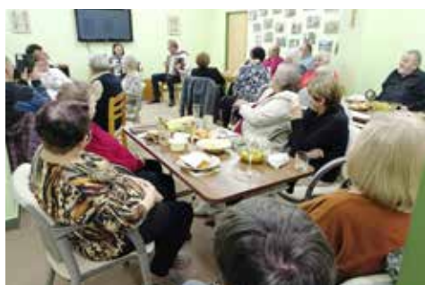
Výroční setkání: pohled z druhé strany