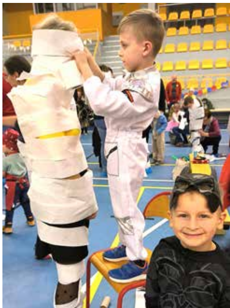
A mamka už je mumie