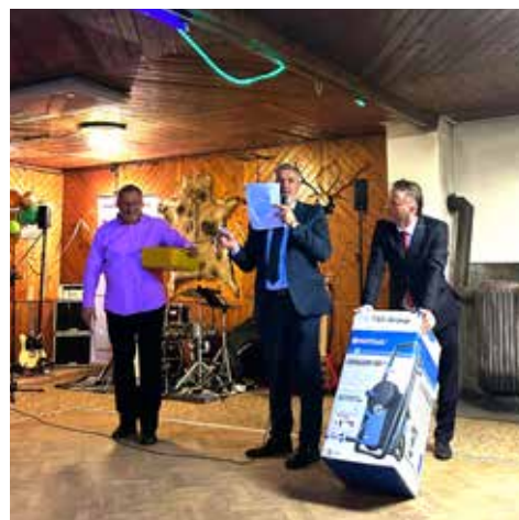
Na závěr exkluzivní tombola