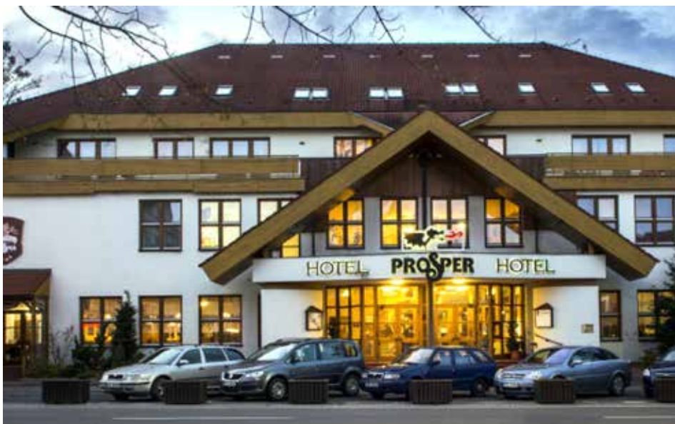
Fotografie z aktuálního e-mailu zaslaného do redakce Jiřím Švrčkem

Opakovaně rezonoval slib, že se hotel pronajme a do třech letech nové zastupitelstvo rozhodne, co bude dál. K tomuto zatím rovněž