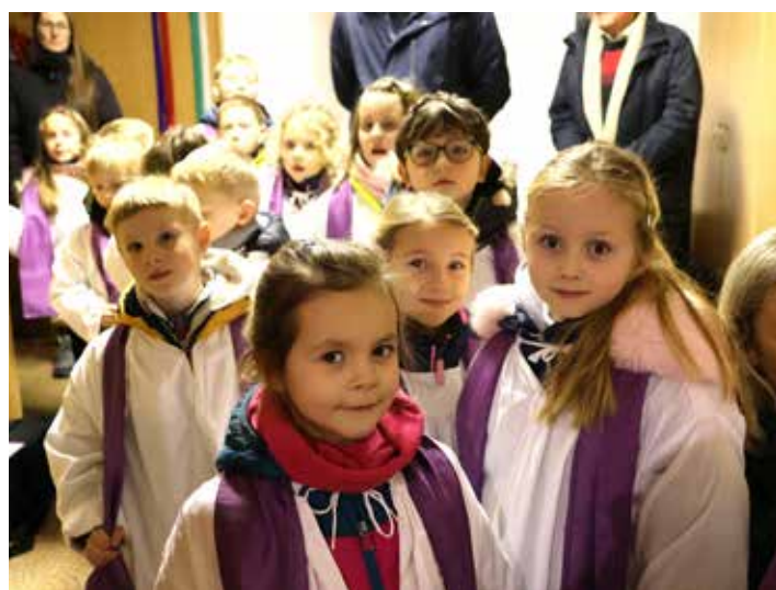
Ve sboru zpívali i prvňáčci a zpívali skvěle