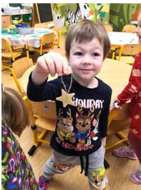
Tadeášek vyrobil krásnou hvězdičku