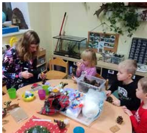
Pro rodiče a děti jsme uspořádali vánoční tvořivou dílnu