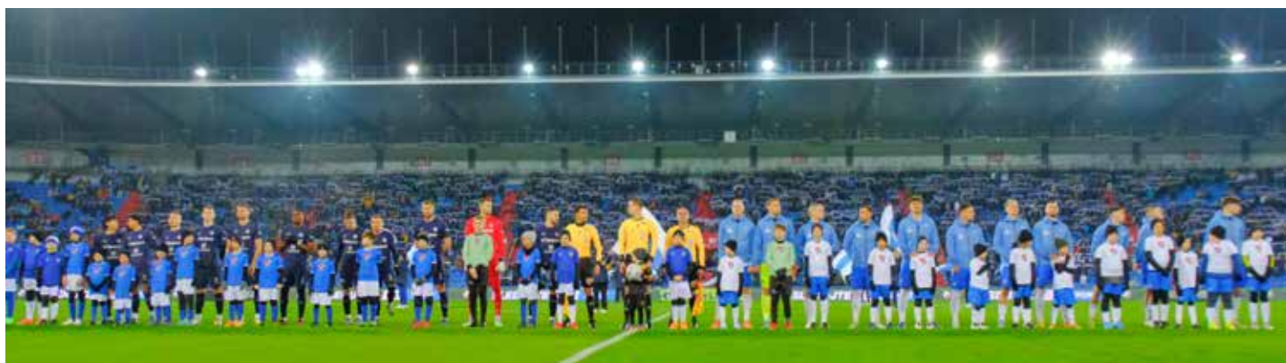
Nástup před výkopem