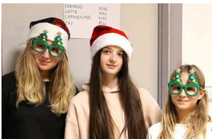
Občerstvení prodávala děvčata z šesté třídy