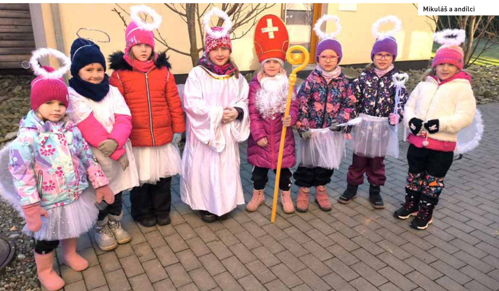
Mikuláš a andělci