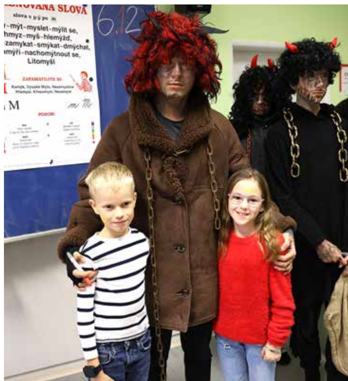
My se čerta nebojíme, radši se s ním vyfotíme