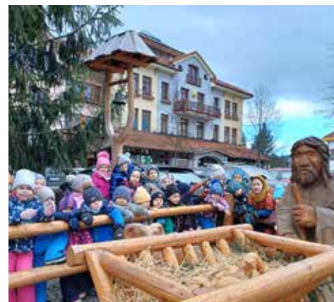
Předvánoční náladu jsme nasáli na náměstí v Čeladné