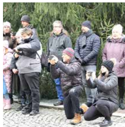
...a všechno si to fotili