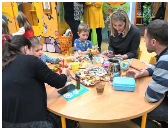
Vánoční dílna s rodiči