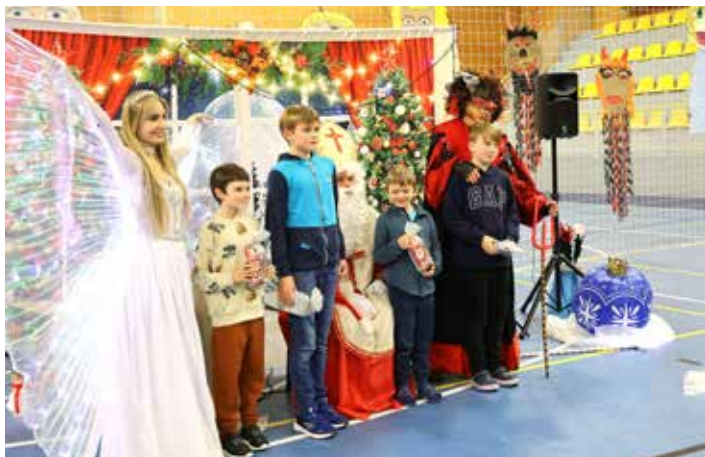
Děti si Mikuláše opravdu užily. Na focení stáli řadu kluci...