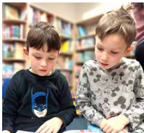
Bruník a Matýsek objevili knihu o hrdinech