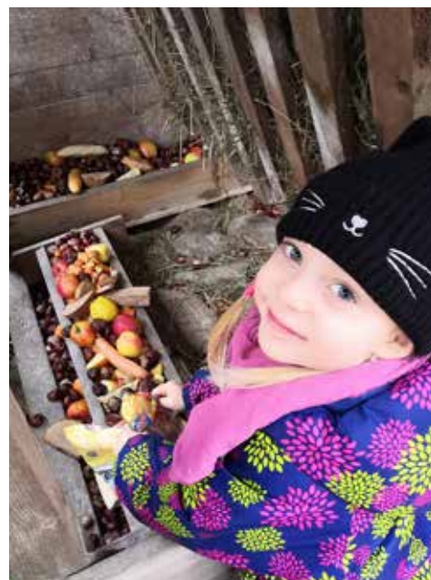
...a Kája ovoce