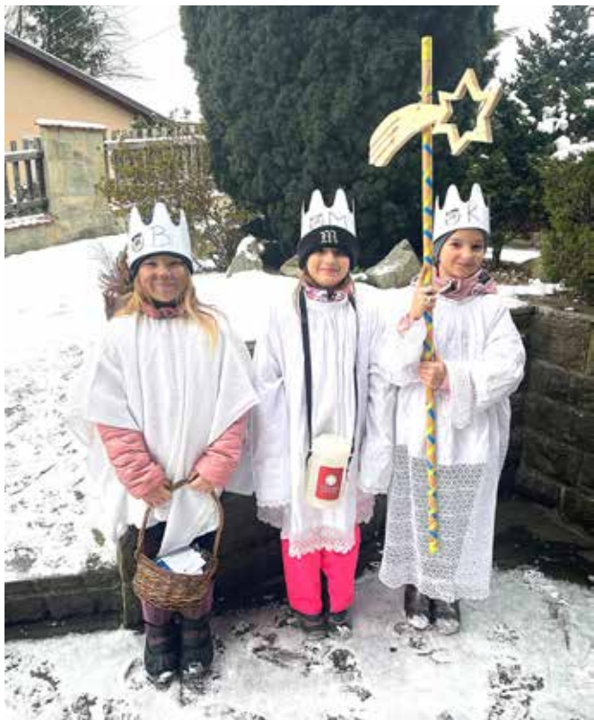
Začátkem ledna prošli Čeladnou koledníci Tříkrálové sbírky. Děkujeme všem, kteří se zapojili, výsledky přineseme v příštím čísle zpravodaje.