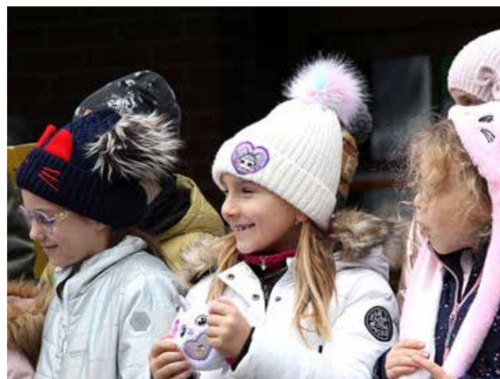
...a společné zpívání na náměstí je bavilo