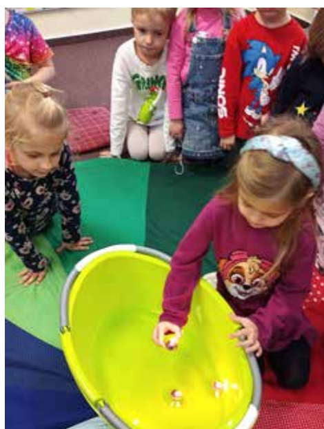
Připomněli jsme si vánoční tradice a jejich význam. Krájeli jsme jablíčka, zapalovali svíčky na adventním věnci, házeli střevíci, hráli si na Barborky a pouštěli skořápky se svíčkami po vodě.