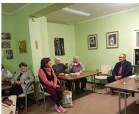
I tady jsme si připomněli některé tradice. Podle hvězdiček v rozkrojených jablíčkách, se mohou všichni z klubu těšit zdraví a štěstí po celý rok.