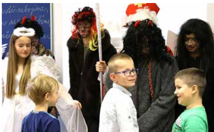
Trošičku jsem zlobil, ale čertů se nebojím