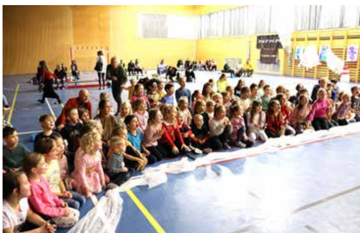
Všichni se při programu bavili skvěle