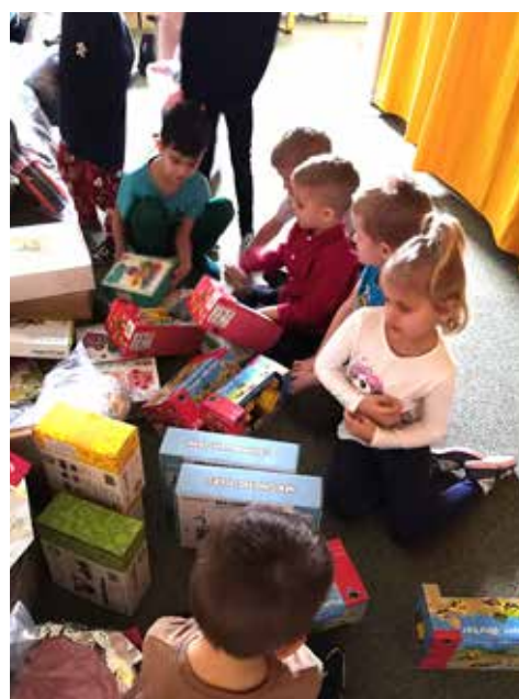
Vánoční nadílka v Krtečku