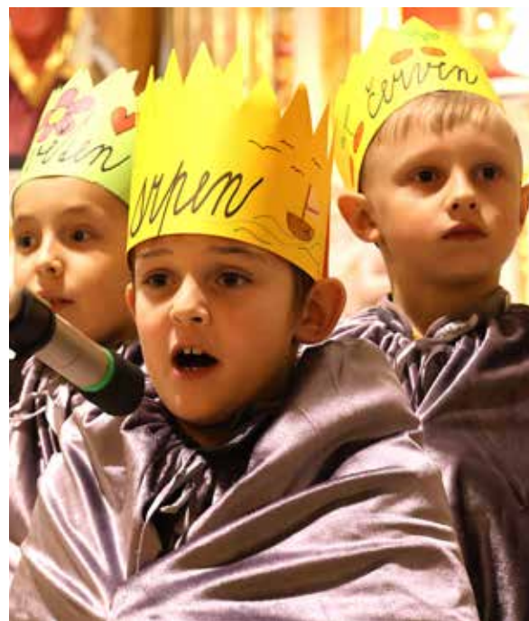
Pohádka O dvanácti měsíčkách měla u diváků úspěch