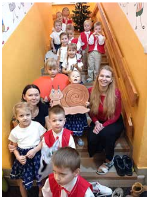
Vánoční besídka třídy Květinčka