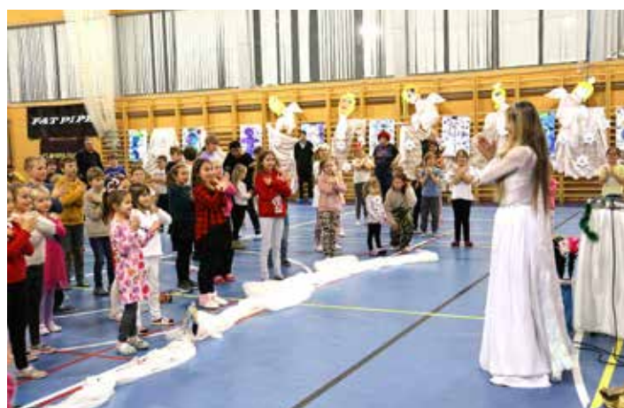
V programu nemohl chybět ani tanec