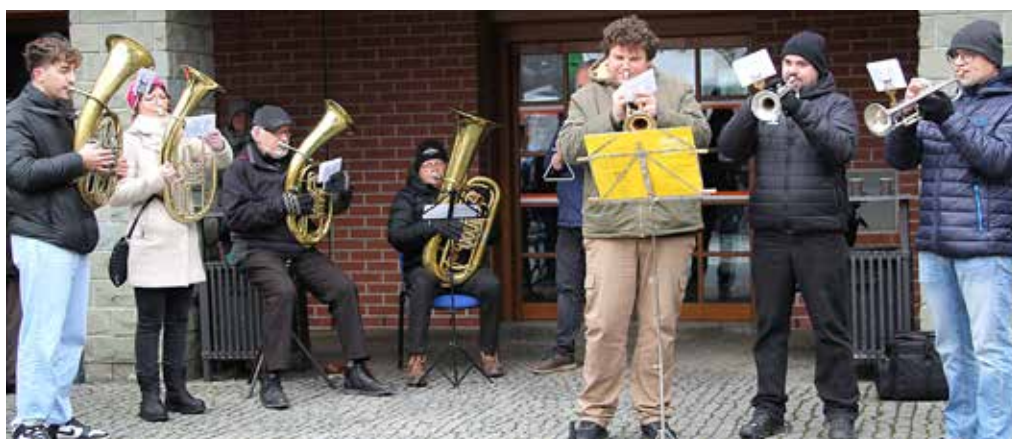
Druhou část muzicírování si vzala na starost Dechová kapela Huťačka