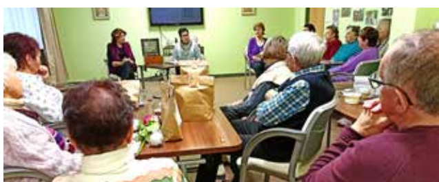
Z mikulášského posezení