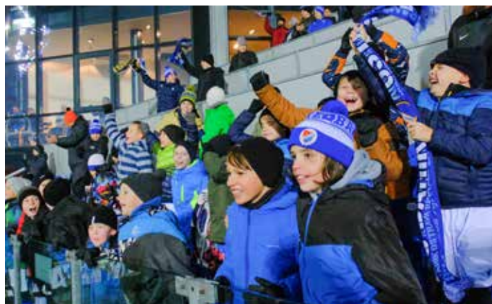
Fandilo se z plných plic