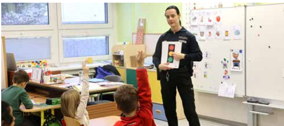
O bezpečnosti silničního provozu slyšeli žáci přímo z úst policistky