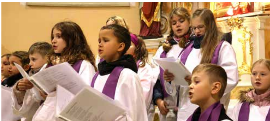
V hlavní roli byl i tentokrát pěvecký sbor naší základní školy

Součástí koncertů byla také jednotlivá pásma tříd prvního stupně. Letos začali prvňáčci, kteří nám zaveršovali pohádkové básničky. Druháci nacvičili známou pohádku O dvanácti měsíčkách. Sklidili bouřlivý potlesk a není divu – za-