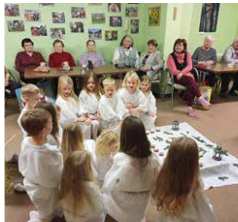
Nezapomněli jsme ani na klub seniorů. Na vystoupení zde se děti vždycky těší.