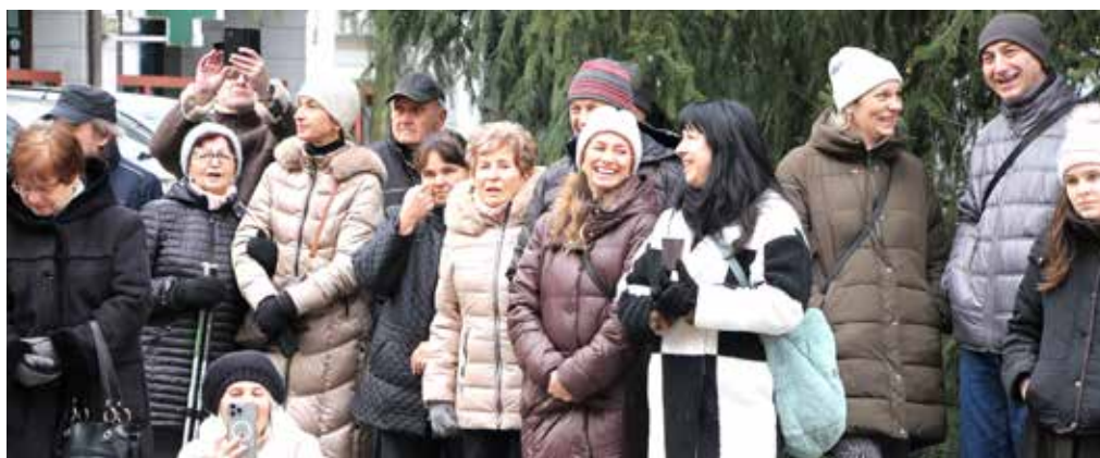
Lidé se dobře bavili...