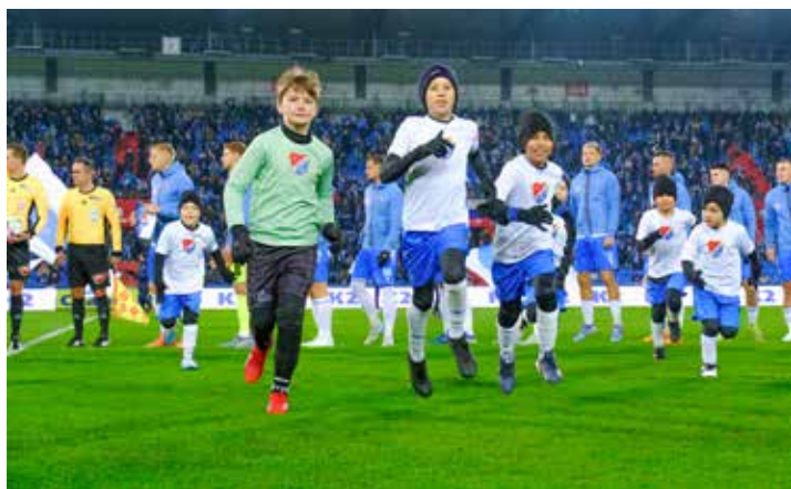
A zápas mohl začít