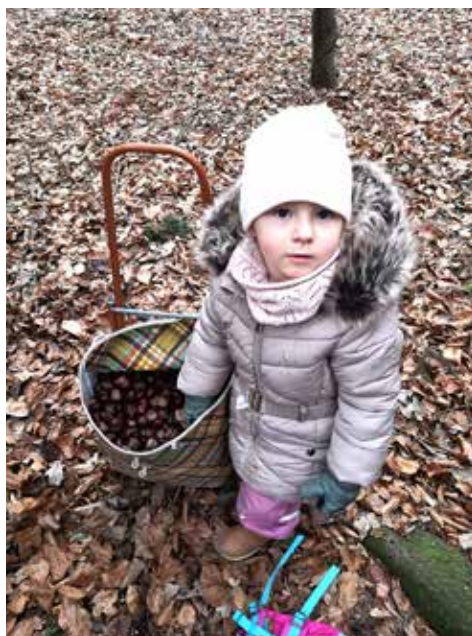
Violka dávala zvířátkům kaštiny...