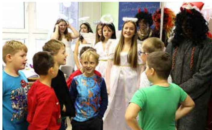
Během mikulášské nadílky jsme si užili hodně zábavy