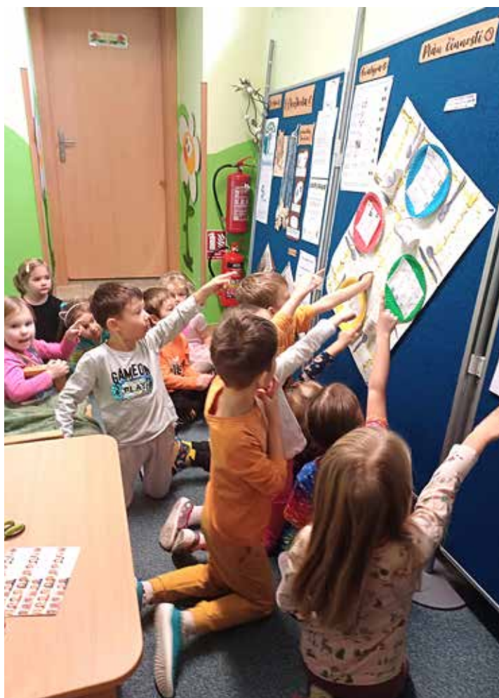
Dětský ekotým u nástěnky s výstupem průzkumu a plánu k tématu Jídlo