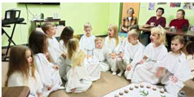
Z vystoupení dětí z Berušky