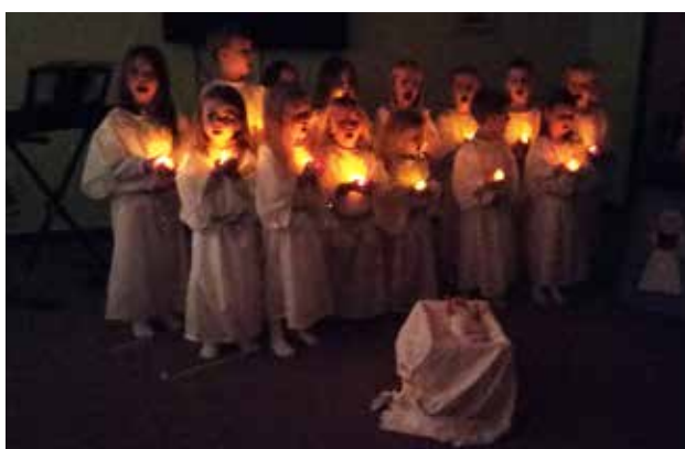
Působivé zpívání ve tmě