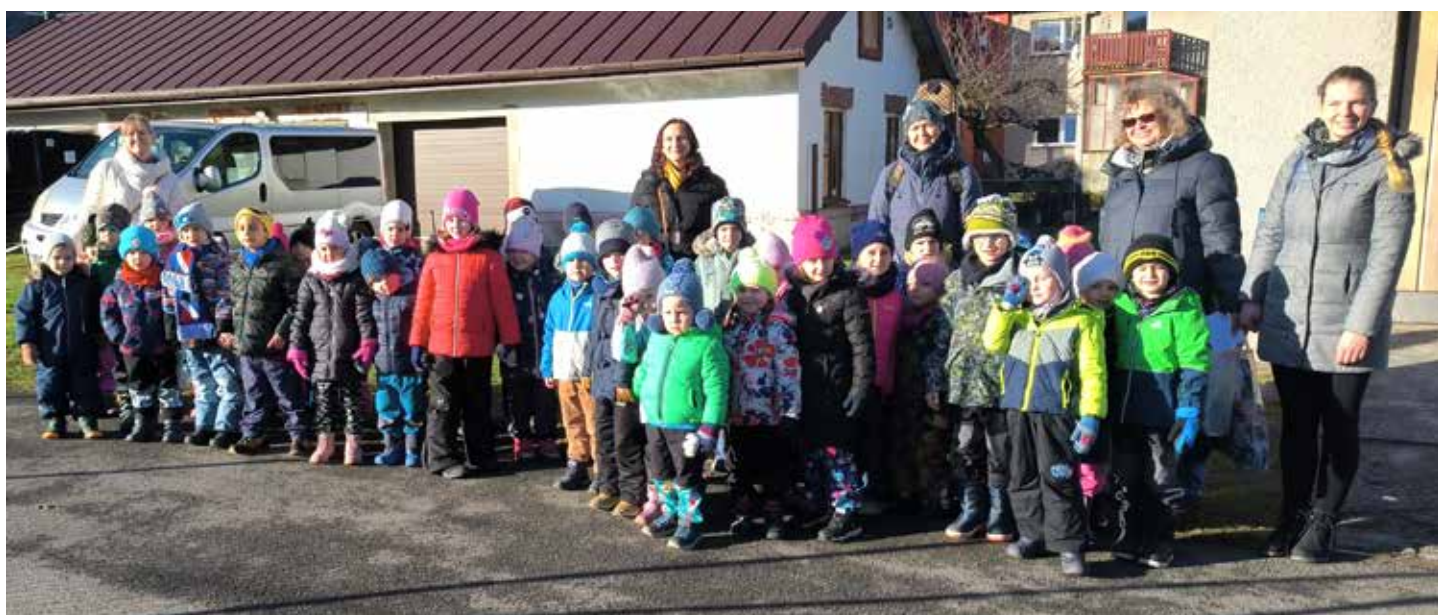
Děti z Berušky a Krtečka si společně zazpívali koledy