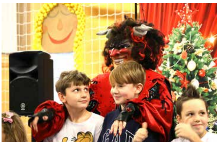
Nechyběl ani čert