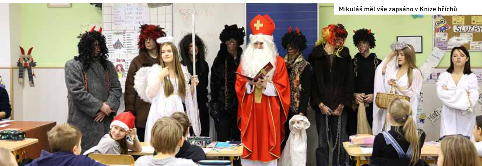
Mikuláš měl vše zapsáno v Knize hříchů