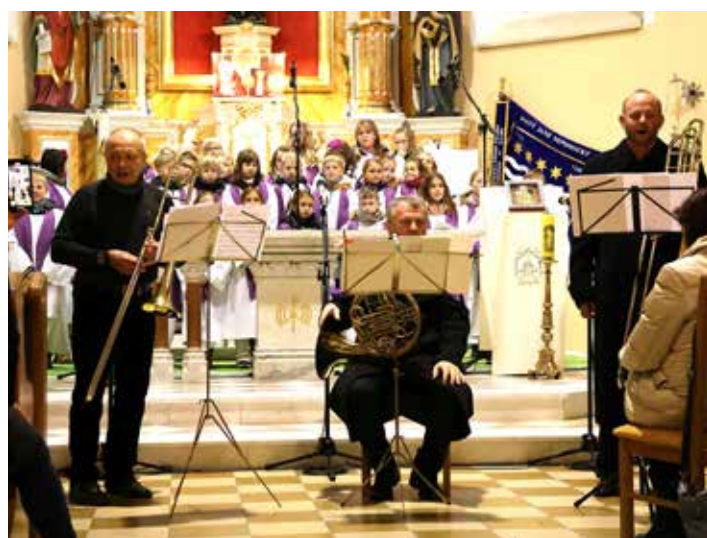
Žestové trio z Čeladné bylo hostem programu Pohádkových Vánoc