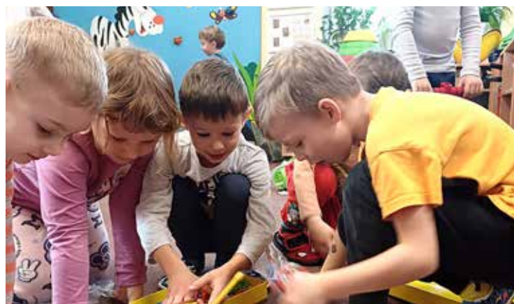
Přes náročné období, kterým pro nás ve školce advent je, bych každému přála zažít okamžiky radosti a štěstí, které s dětmi prožíváme