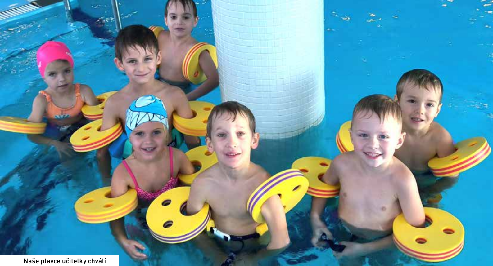
Naše plavce učitelky chválí