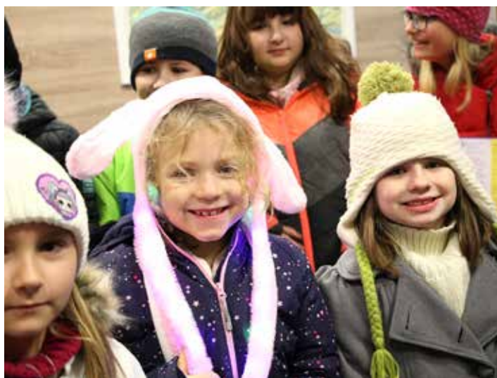
Čeladenští školáci už měli dárky od Ježíška jistě...