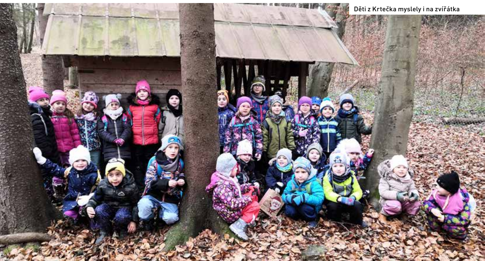
Děti z Krtečka myslely i na zvířátka