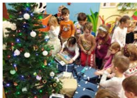
Adventní čas završila nadílka pod stromčkem. Radost dětí byla neskutečná. Obzvláště proto, že pod ním našly spoustu hraček, které viděly v obchodě u paní Kopecské a moc si je přály.