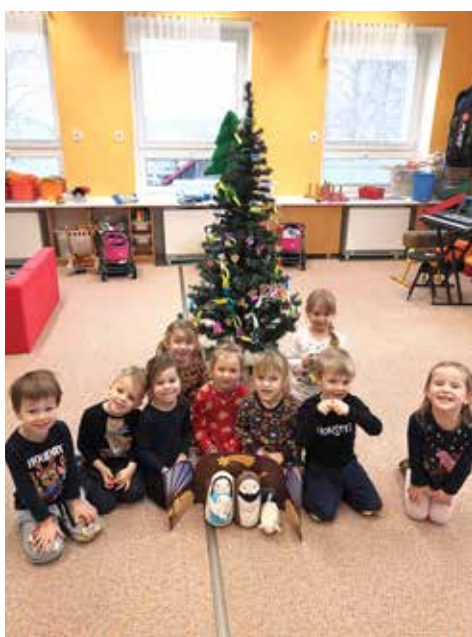
Květinčka si ozdobila krásný stromček