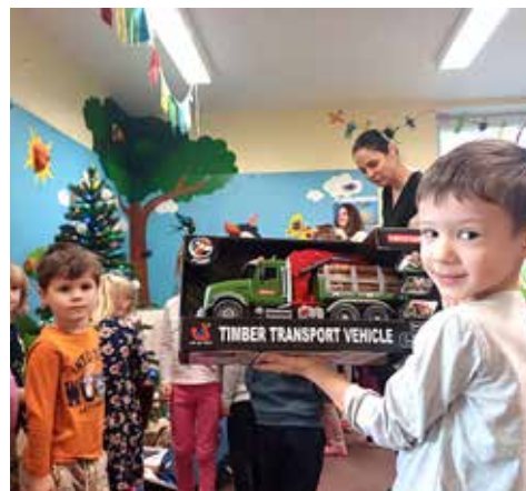
Pěťa byl nadšený z valníku se dřevem