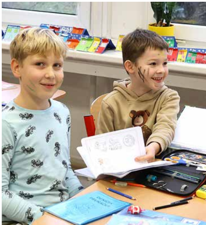
Prvňáčci se nebáli a pyšně ukazovali své žákovské knížky