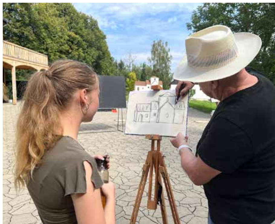
Památník Josefa Kaluse se stal místem oblíbených setkání tvůrčích lidí