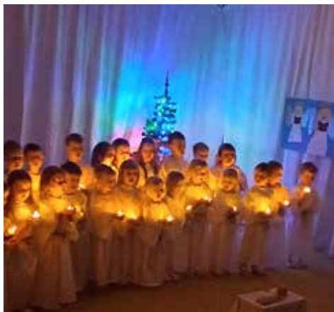
Děti svým vystoupením dojaly maminky, tatínky i nás učitelky