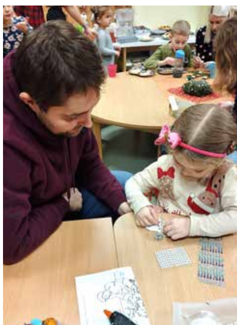
Do výroby vánoční vyzdoby se zapojili i tatínci a všichni jsme si tak mohli společně popovídat, tvořit a na chvíli se zastavit v rušném předvánočním období