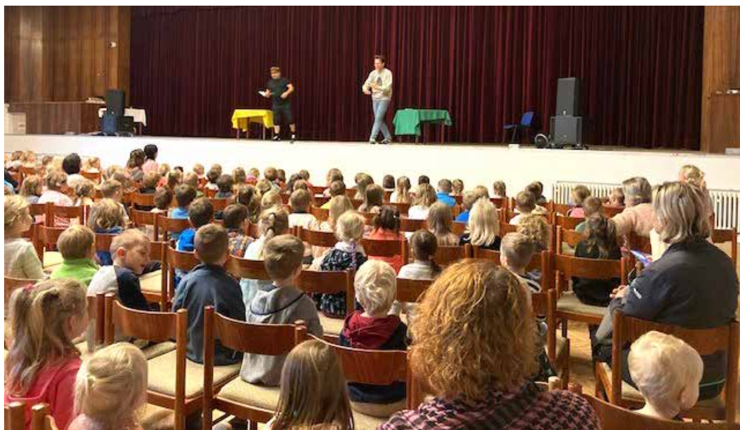
Scénické čtení vtáhlo do děje žáky i pedagogy