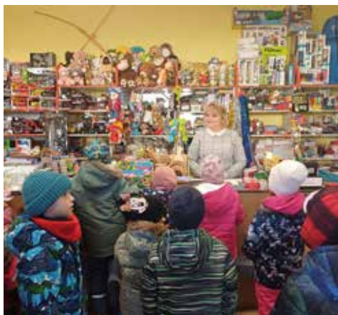
Šli jsme s dětmi na koledu po obci, zpívat, přát a projevit vděk našim blízkým.