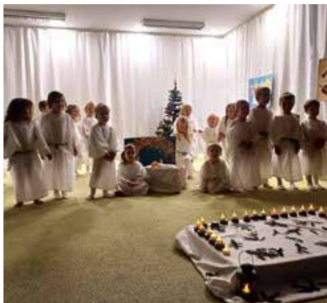
Pak přišel čas besídek, na kterých děti zpívaly vánoční koledy