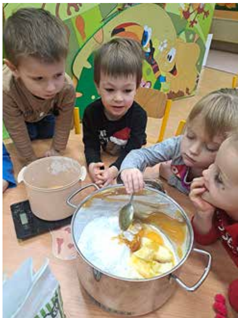
Děti z Květinčky připravují těsto na perníčky