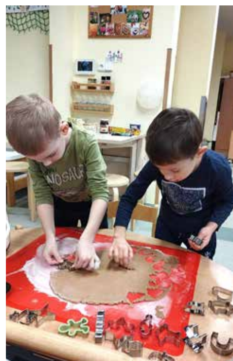
Na besídce jsme s dětmi napekli cukroví