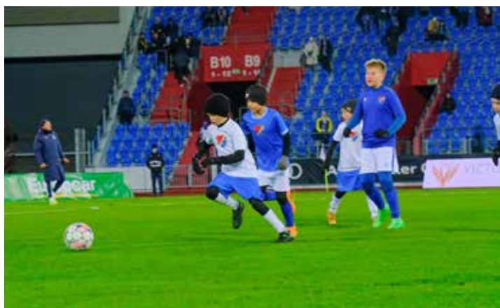
V poločase se taky hrál pěkný fotbal