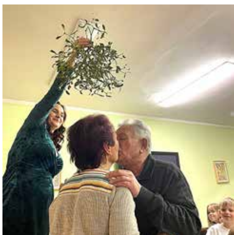
A polibek pod jmelím přinese zase lásku.