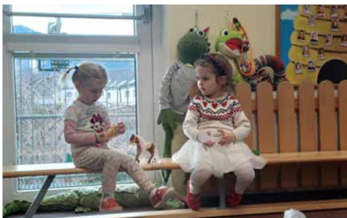
Ela si hrála s novým koníkem a Amálka se radovala a dlouho v ruce držela dětské peníze, ze kterých měla nekonečnou radost