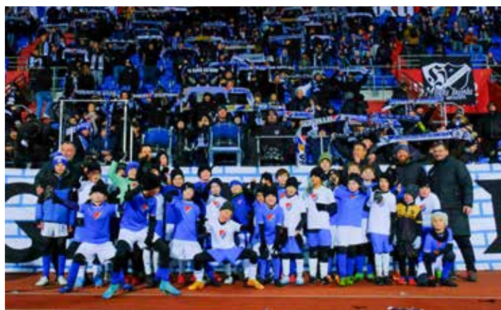
Skvělí fanoušci se chtěli vyfotit s budoucími hvězdami