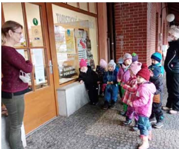
S koledou děti zavítaly také do knihovny