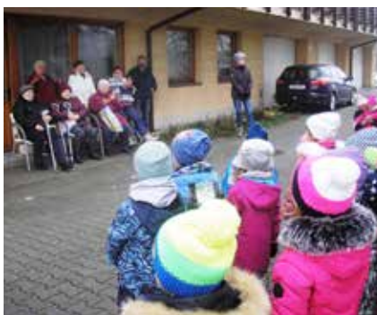
Beruška dozpívala, hlavní tribuna tleská