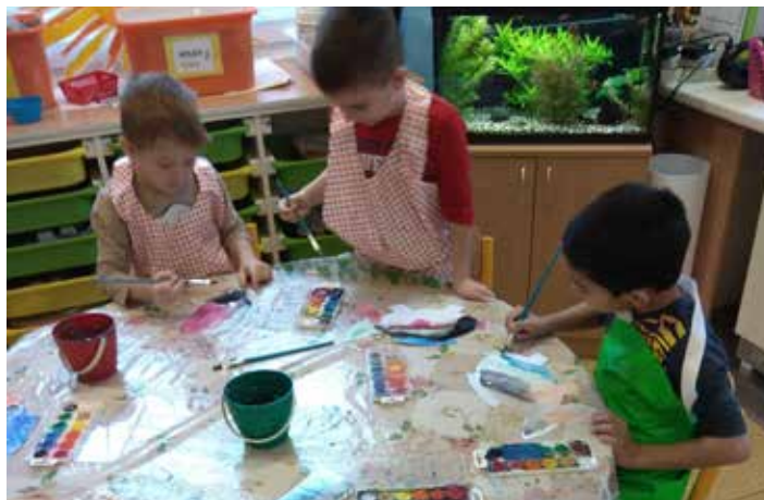
Ani o adventu jsme nezapomněli na procvičování jemné motoriky