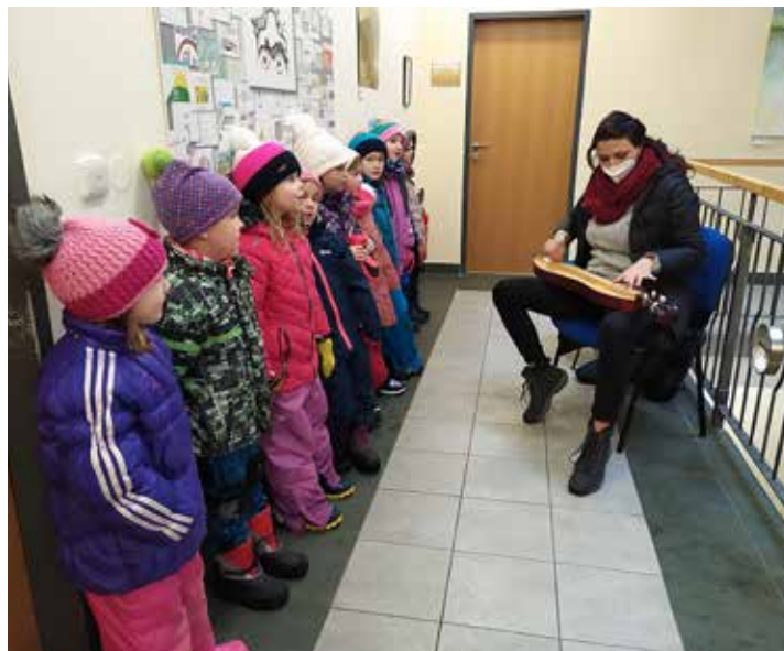
Koledou děti vánočně naladily i zaměstnance obecního úřadu