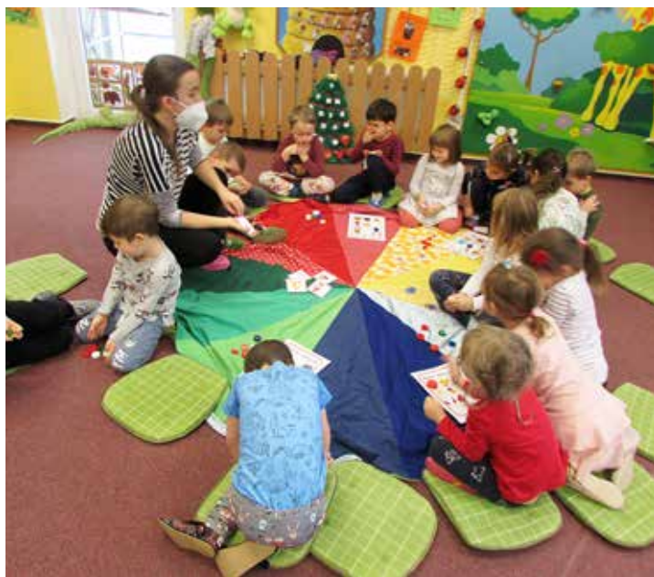
Z adventního kalendáře jsme každý den rozbalili jedno překvapení. Tentokrát jsme si zahráli adventní bingo.