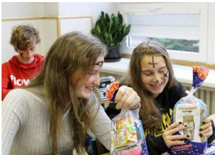
Radost z mikulášského balíčku od obce měli i devěťáci