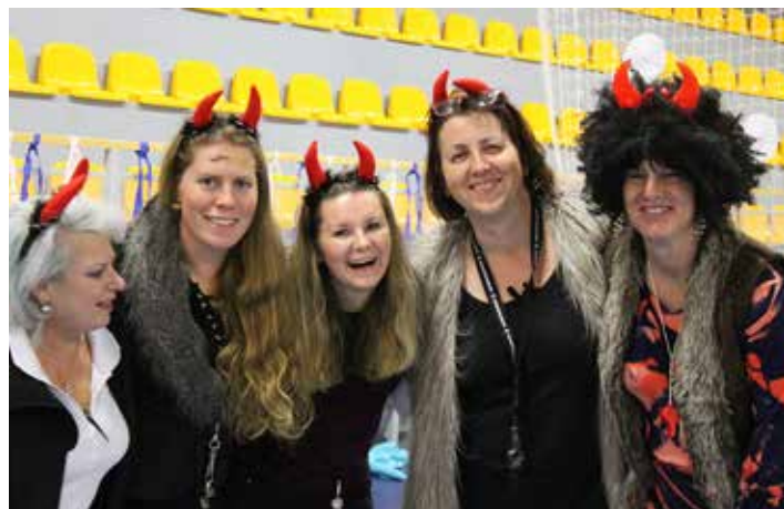
Pekelně řádily i paní druží