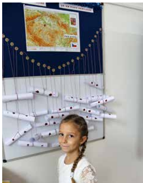
Projekt Kudy chodím: S adventním kalen- dářem jsme procestovali celou republiku

Některé příběhy byly veselé, některé na- pínavé, některé i trošičku smutné. Ale jak to tak v pohádkách bývá, tak nakonec všechno dobře dopadlo. My jsme se díky nim pobavili i poučili. Protože i slavný učitel národů Jan Amos Komenský tvrdil, že dokud se člověk může učit, tak není starý. A u nás ve ško- le, kudy chodíme, tudy se učíme a v družině jakbysmet.