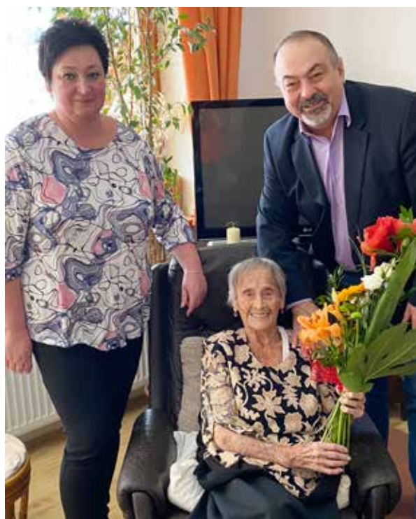
Za obec oslavenkyni gratulovali starosta s místostarostkou

Krátce nato mi ale zahynula dcera a zase se všechno otočilo ke špatnému. Se zaměstnáním jsem skončila a snažila se po-