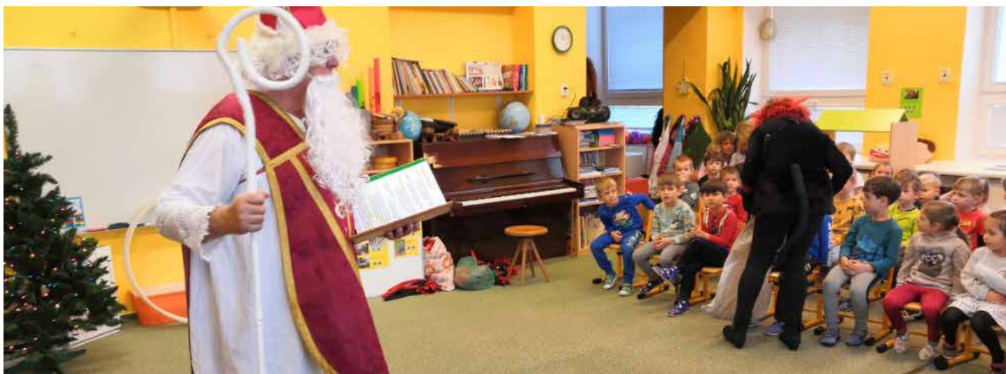
S Mikulášem a andělem přišel do školky i čert. Ten dlouho vybíral, do svého pytle ale nakonec nikoho nesebral.