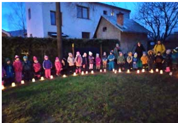
Děti zpívají koledy a recitují básničky za svitu lucerniček