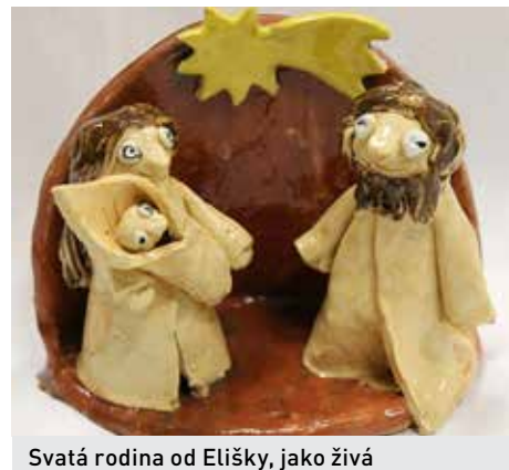
JS Svatá rodina od Elišky, jako živá

Před velkými svátky mají keramici vřdy- cky naplno. S vytvářením dárků s vánoční tematikou začínají někdy na konci babího léta. K těmto Vánocům udělaly děti spoustu výrobků, mezi kterými byl jejich majstršty- kem keramický Betlém.