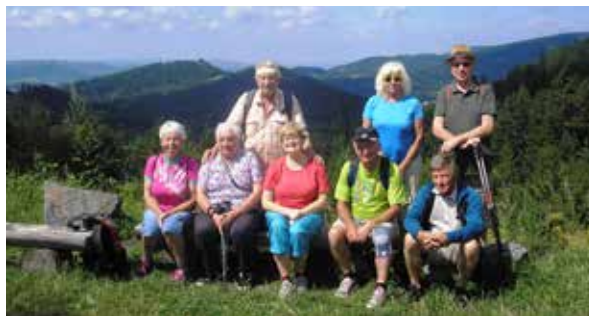
Fotka roku 2021: Zdatná osmička na Martiňáku

Tradiční předvánoční návštěva dětiček z MŠ Čeladenská