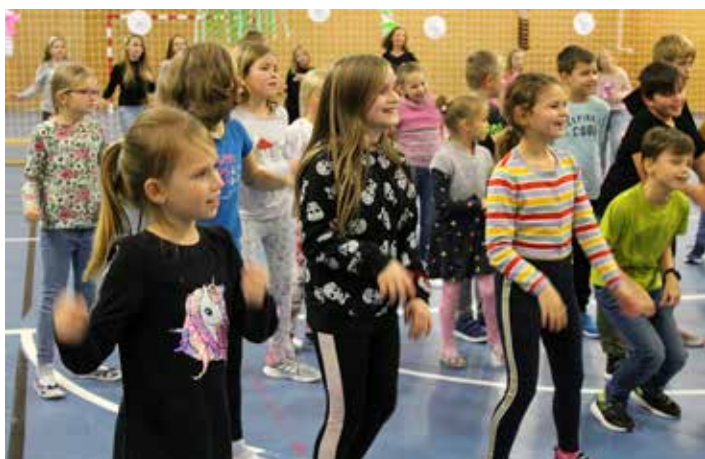
Sněhovánky v pohybu