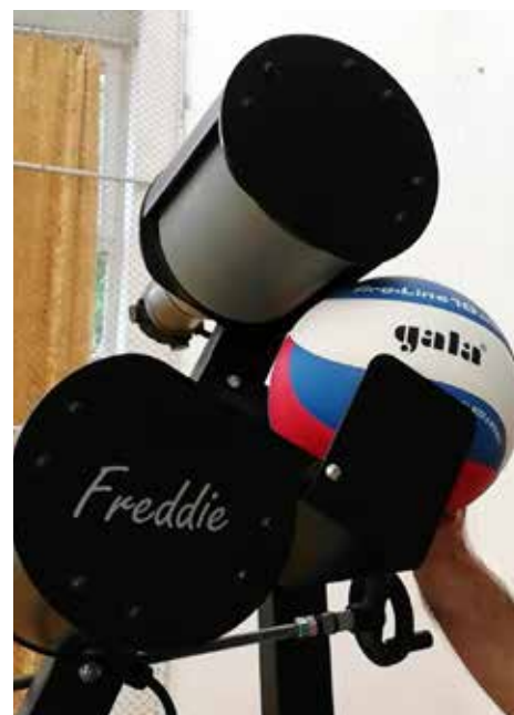
Volejbalový klub Beskydy Frýdlant nad Ostravicí získal z Programu rozvoje venkova přes 80 tisíc na volejbalové dělo