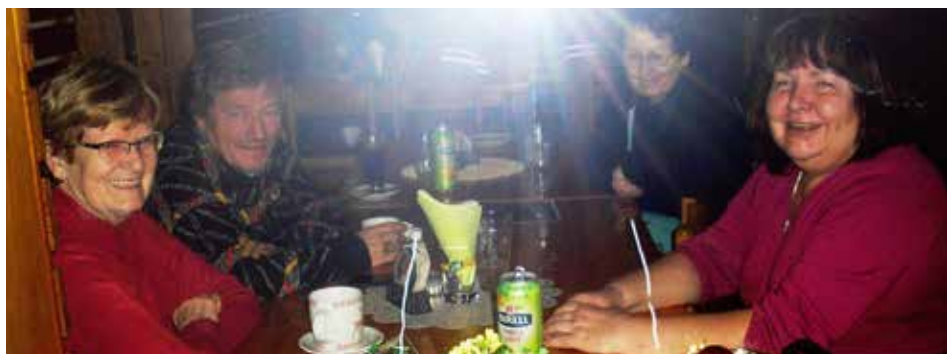
Pohoda za oknem Vlčárny (foceno zvenčí)