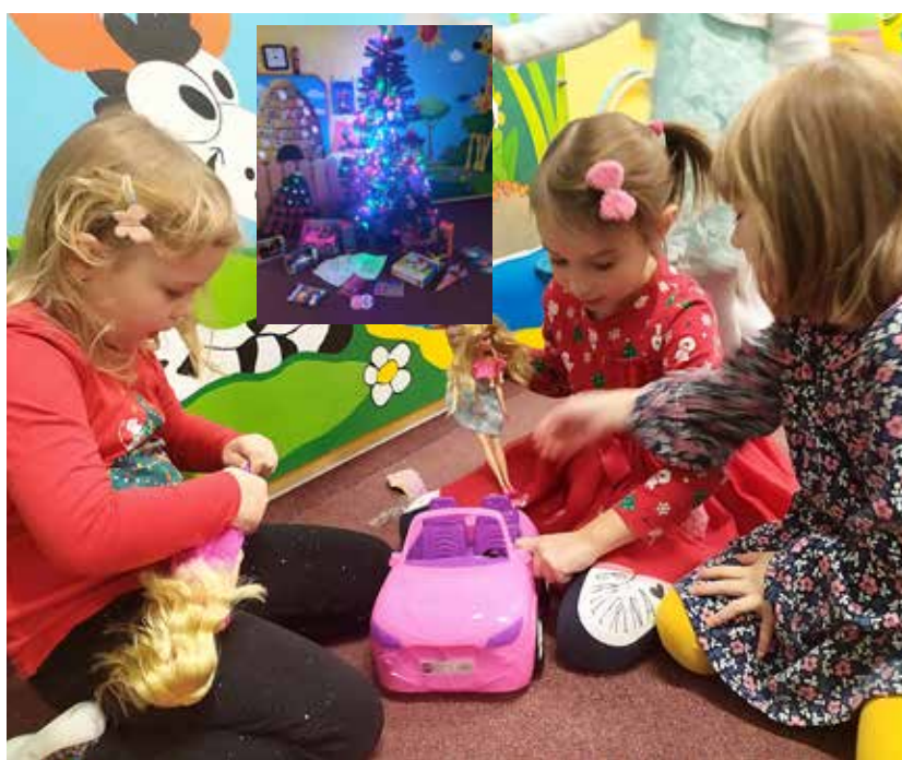
Radost dětí z dárečků pod stromečkem ve školce byla obrovská