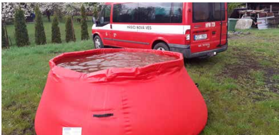
Samonosnou nádrž na vodu a další vybavení si mohli dobrovolní hasiči z Nové Vsi pořídit díky dotaci 182.200 Kč z Programu rozvoje venkova