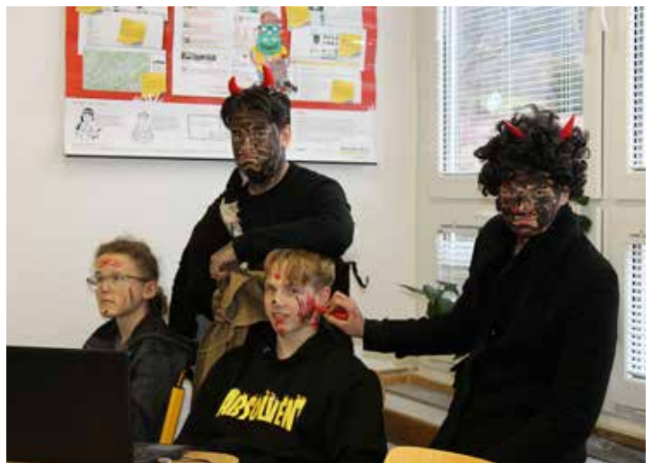
Čerti se činili a zdatně špinili