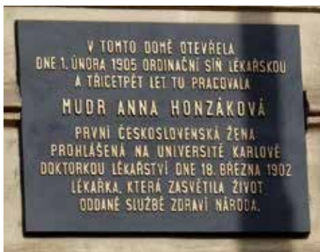
Deska na domě Na Moráni