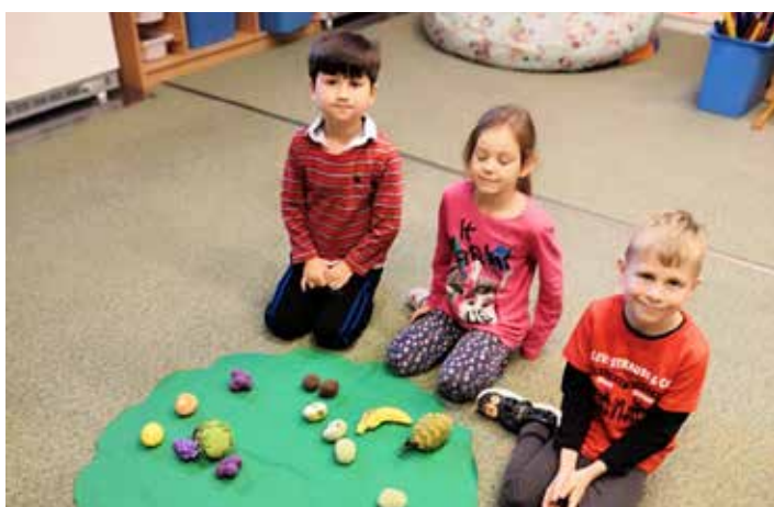
Na projektovém dni jsme si řekli, jak jíst zdravě i o Vánocích