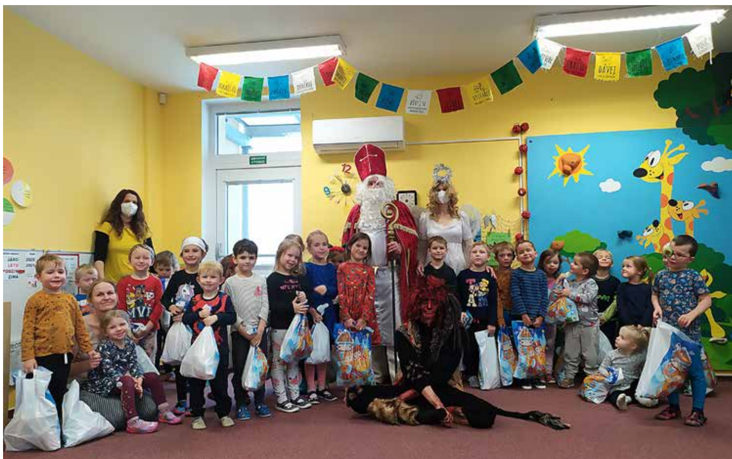
Do školky přišel Mikuláš s čertem a andělem. Letos byla nadílka bohatší o velký balíček dobrot, které děti dostaly od obce.