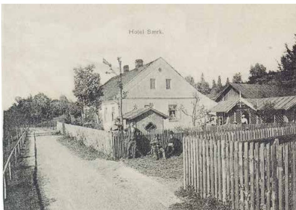
Původní hotel Smrk