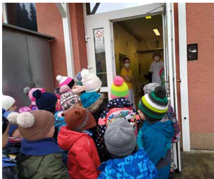
Radost z koledy měly i paní kuchařky ze školní jídelny