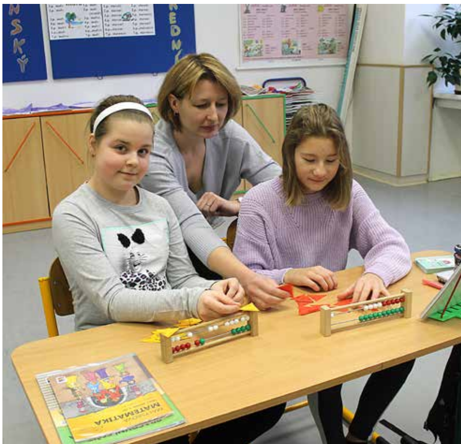
„Když už nevím, co bych pro děti připravila, inspiřuji se na Facebooku nebo Twitteru.“

Ten už skončil, vlastně trochu předčasně. Asi jsme ho vyhlásili v nevhodnou dobu, kvůli covidovým opatřením do něj mohla chodit jen jedna třída a zájem postupně upadal. Přece jen 3D modelování není až tak akční, že děti kliknou a hned je hotovo, chce to trpělivost. Ale tiskárna nám zůstala,