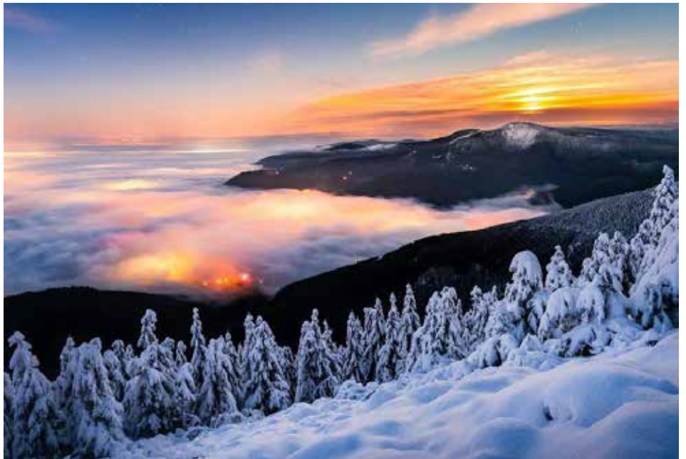
V roce 1938 pozorovali Čeladňané nad obcí polární záři. Tento snímek sice není z roku 1938 a nezachycuje polární záři, ale jiný pozoruhodný přírodní úkaz. V Čeladné se pořád něco děje.

29. května konaly se obecní volby . 11. května byla svolána schůze všech politických