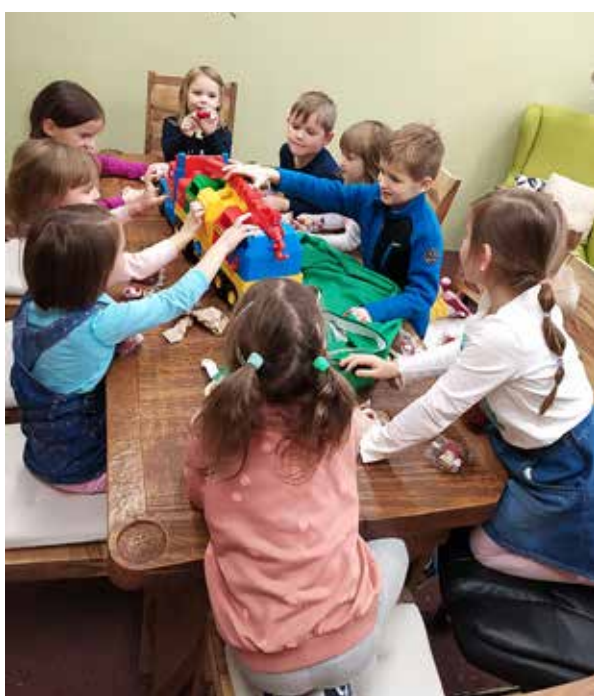
První vánoční nadílku si užily děti z ekokroužku Sovičky