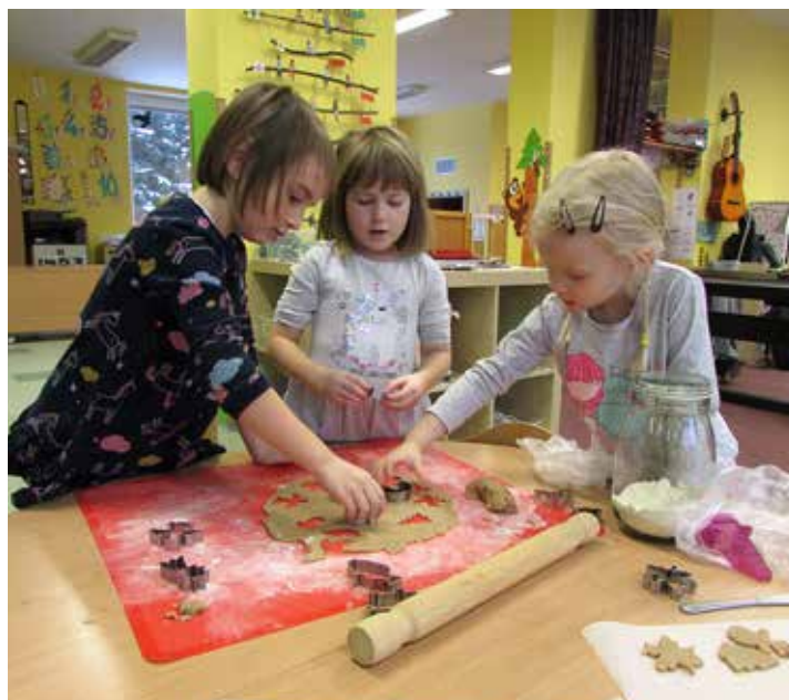
Stejně jako doma, i ve školce pečeme cukroví