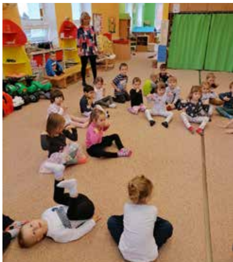
Před vánoční hostinou je fajn si zacvičit