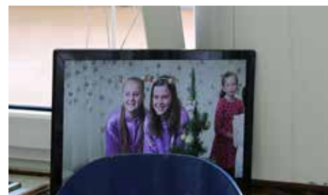
Jé, my se vidíme v televizi!