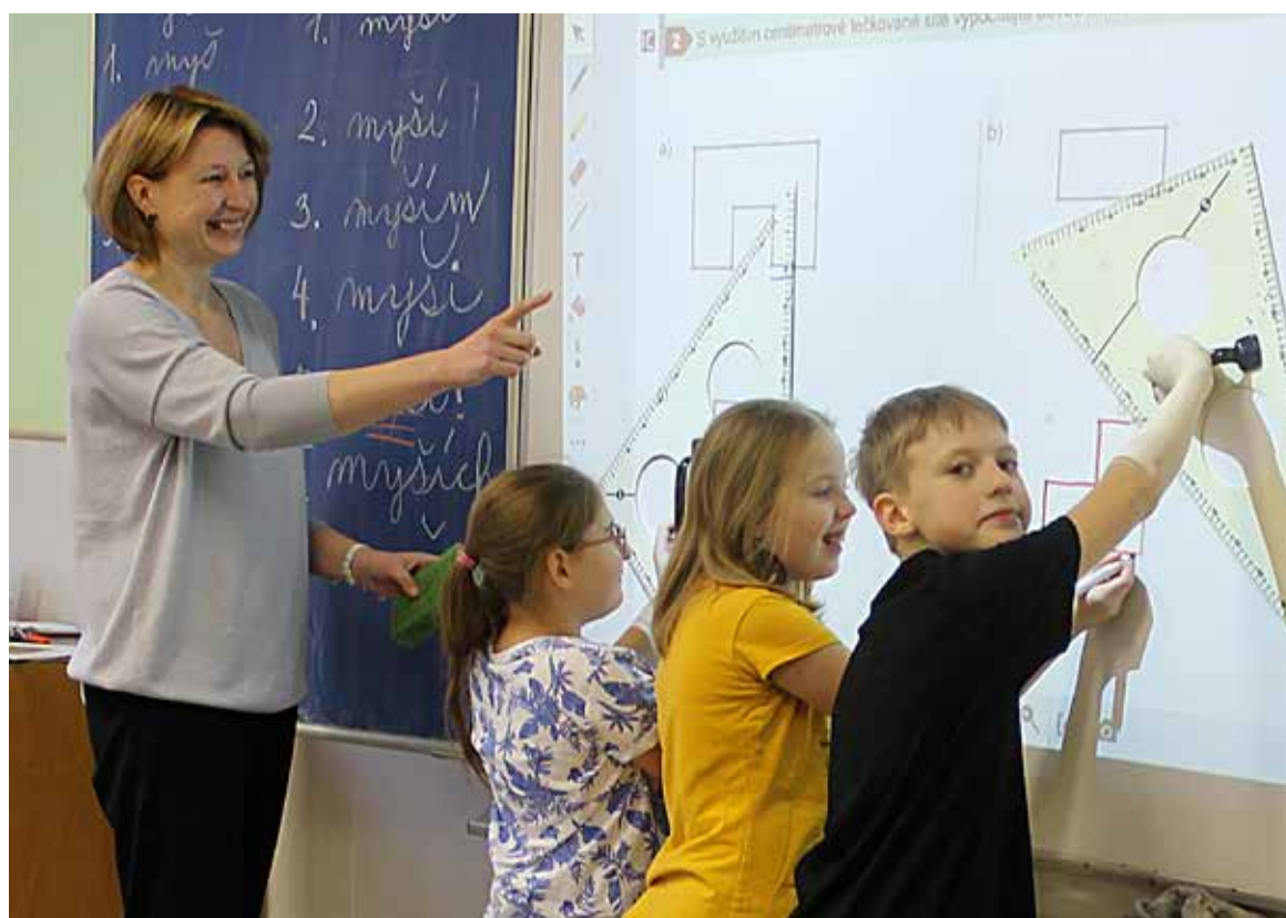
„Překvapilo mě, že po covidu děti nemají výrazné mezery. Nejde jim třeba geometrie, tu se přes kameru nenaučíte.“

Většina dětí dělá na počítačích a chytrých telefonech stále tři čtyři stejné věci a ty zvládají dokonale – stáhnout si písničku, upravit fotku nebo vložit video... Ale se složitějšími úkoly mají problém, například když mají postupovat přesně podle návodu. První a druhý bod zvládnou, ale ve třetím už jsou dvě věty, tak ho radši vynechají, a když se jim nedaří čtvrtý bod, řeknou si, že to paní učitelka asi napsala špatně. Často nezvládají ani různé nastavování nebo práci s hardwarem, což měla naše generace zmáknuté výborně. Když jsme zjistili, že nefunguje grafická karta, uměli jsme počítač rozložit,