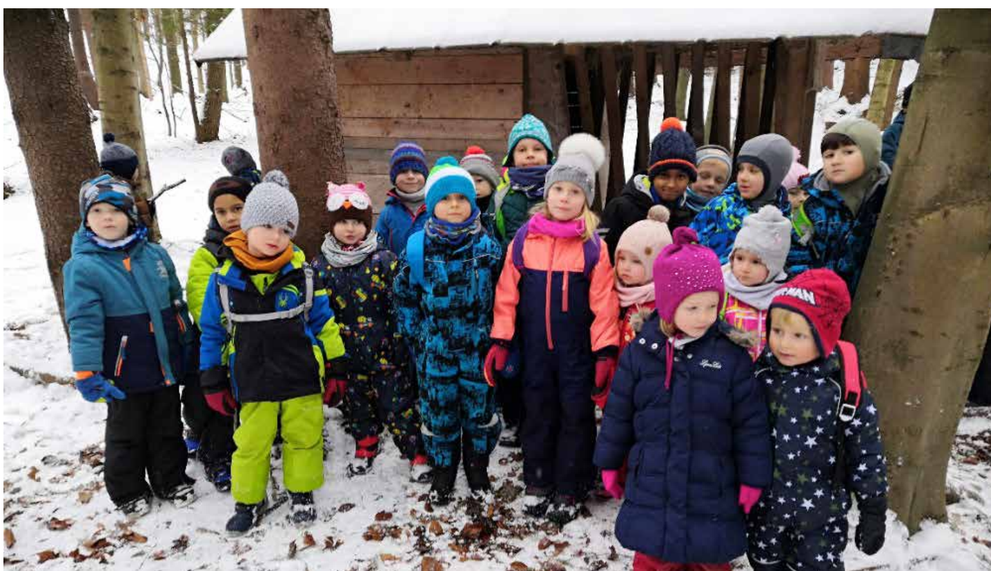
Děti nezapomněly ani na zvířátka, do krmelce jim přinesly chléb, jablíčka, mrkev i kaštiny