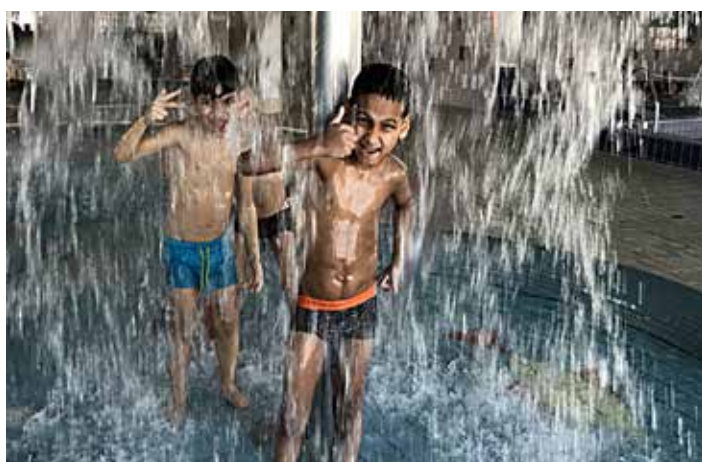
...a pak si zařádily v Aquaparku Kravaře.