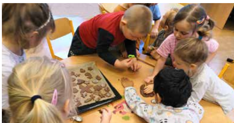
Naše perníčky byly mooc dobré