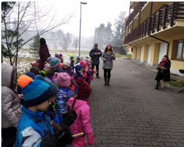
Svým vystoupením a dárečkem potěšily děti babičky a dědečky z domu s pečovatelskou službou