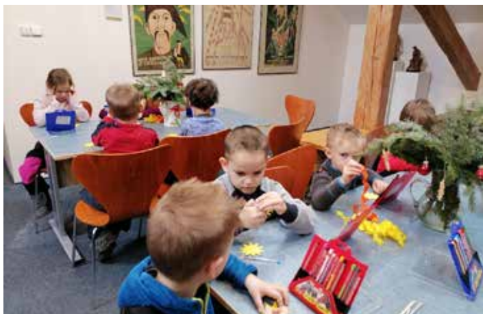
Z výletu dětí z Žabičky do frenštátského muzea