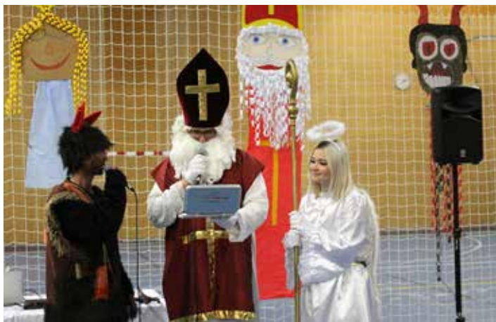
Na Sněhovánky zavítal i Mikuláš s čertem a andělem