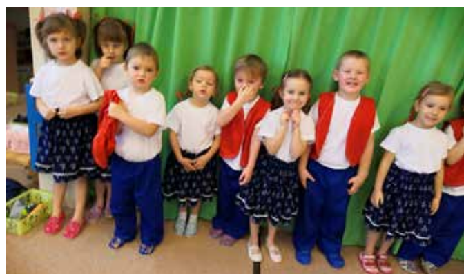
Natáčíme vánoční CD pro rodiče