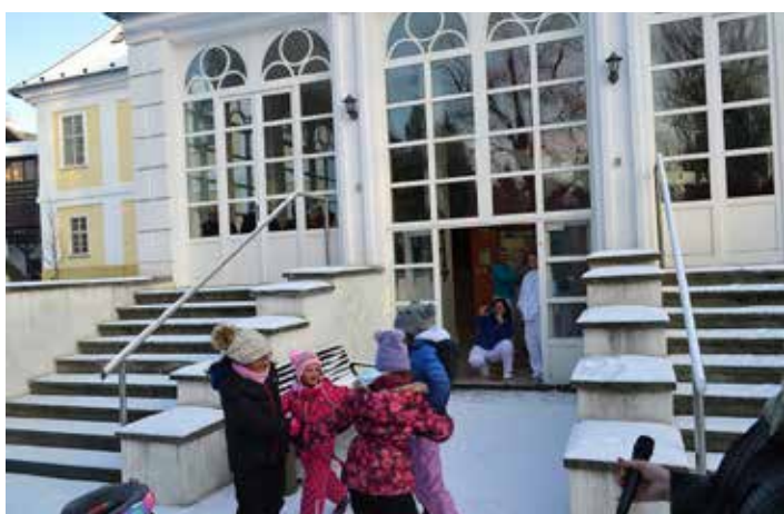
Děti potěšily seniory v Domově Na zámku v Kyjovicích...