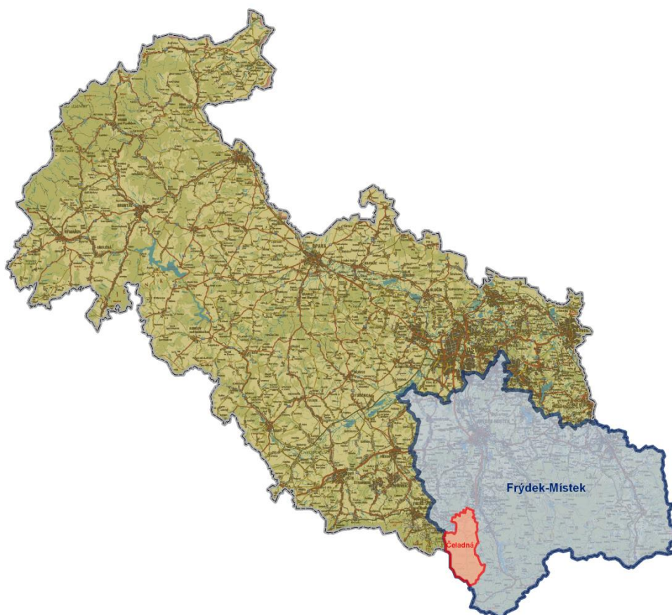
Obrázek 1 - Poloha obce Čeladná v Moravskoslezském kraji

Obec Čeladná se nachází v Moravskoslezském kraji v okrese Frýdek – Místek.